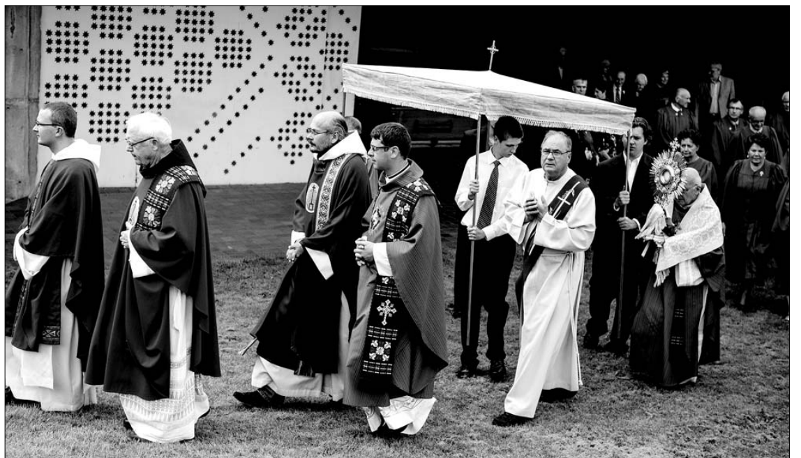
Po palaiminimo Švenčiausiuoju kapinių koplyčioje, procesija grįžta Lietuvos kankinių šventovėn Mišioms