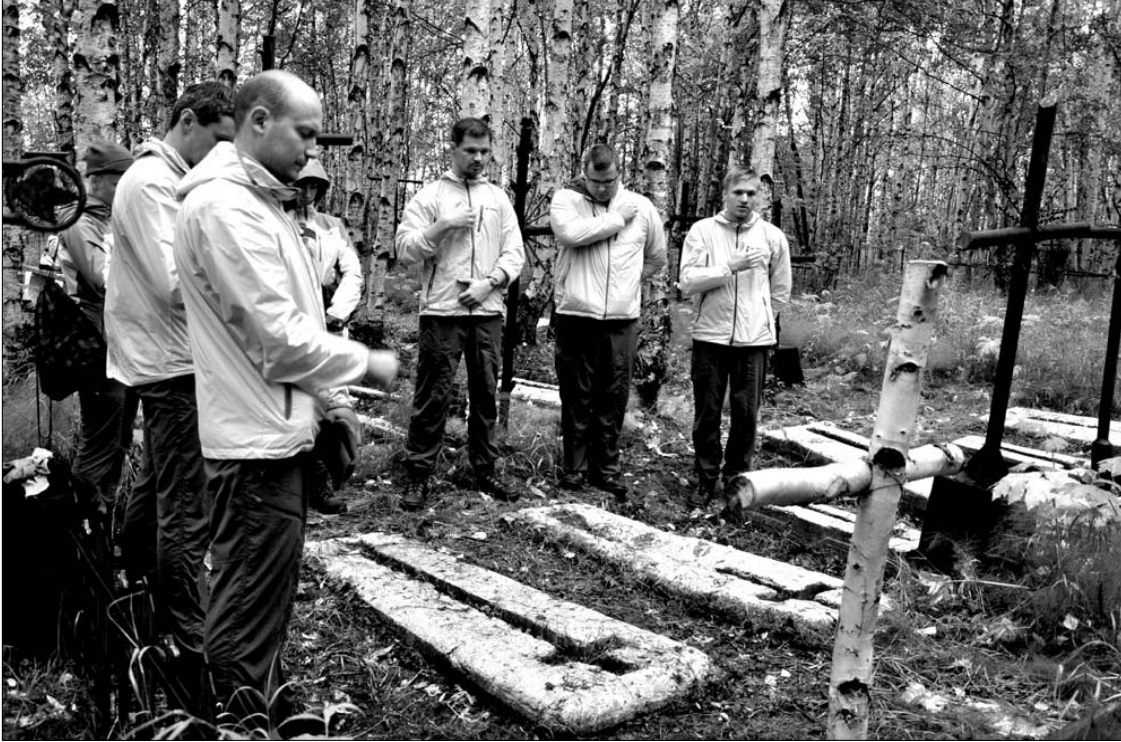
Ekspedicijos dalyviai Intos kapinėse