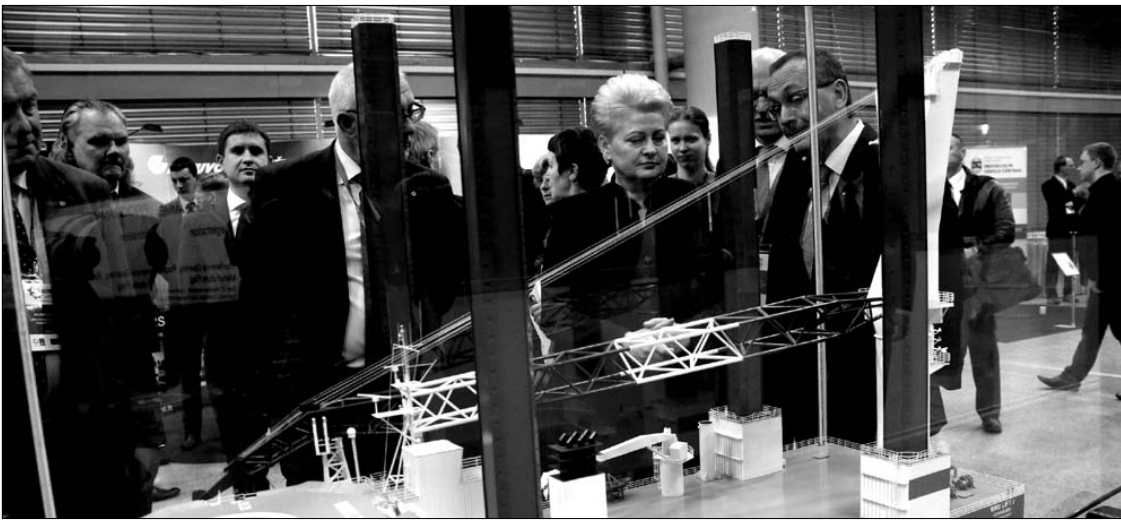
Vilniuje Lietuvos prezidentė Dalia Grybauskaitė atidaro Europos inžinerinės pramonės technologijų platformos konferenciją „Horizontas 2020 ir ateities gamyba“. Tai – Lietuvos pirmininkavimo ES Tarybai renginys, globojamas prezidentės. Konferencijoje dalyvauja apie 450 dalyvių iš ES ir kitų šalių: stambaus verslo ir pagrindinių Europos inžinerinės pramonės verslo draugijų vadovai, Europos universitetų ir mokslų įstaigų atstovai