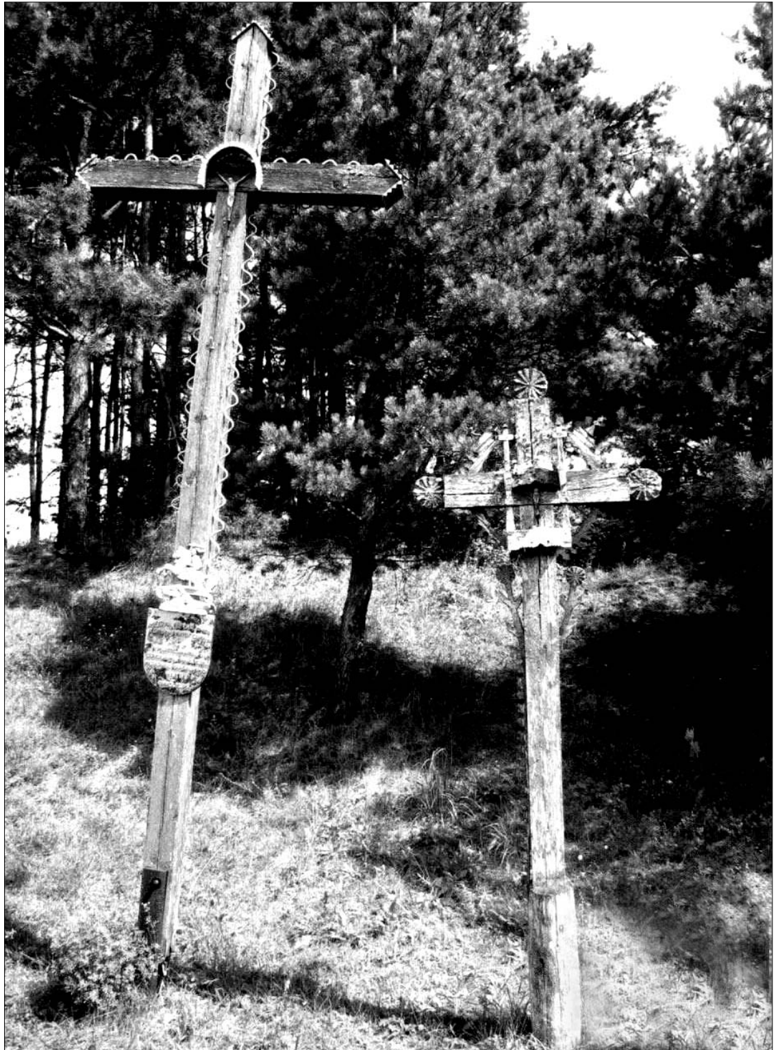
Merkinės kryžių kalnelis Dzūkijos partizanams atminti

K ARTAIS prieinama prie išvados, kad šiais laikais nebėra tokių žmonių, kokia buvo močiutė. Atsi- grežtiama į praeitį, atsiminimuose ieškoma šviešiausių dienų, kokios buvo gyvenant šeimoje. O tai lyg dingusi ar kitiems atiduota brangenybė, kuri tik viena tokia tegali būti. Didysis dvasinis palikimas – tai velionies atlikti darbai – visi visokie, be išimties. Jie brangūs, einantys iš kartos į kartą – vieni žymūs ir garsūs, kiti kuklūs, bet visi svarbūs ir gerbtini. O patys ryškiausiai iš jų yra tie, kurie su pasiaukojimu buvo skirti visai žmonijai arba tautai. Šitokie aukos palikimai iškyla virš visų kitų, įsiamžina. Pvz. seselės Teresės atliktų artimo meilės darbų palikimas ilgus amžius bus dalinamas visiems, kurie stengiasi pasaulį padaryti geresnį negu jį rado. Arba aukoja net gyvybes, kad kiti galėtų laisviau ar geriau gyventi. Čia prisimintini mūsų laisvės kovotojai. Jų atminimui žūties vietose dygsta kryžiai ir paminklai, liudijantys didžiausią dvasinį palikimą, pasirašytą narsa ir krauju. Šiomet ypatingai tebūna minimi Norilsko sukilėliai, kurie prieš šešiasdešimt metų išdrįso stoti į nelygią kovą ir žūdami laimėti – po šio ryžtingo žygio sovietinių lagerių ir kalėjimų sistema buvo priversta keistis. Tai palikimas, kuris nenyksta, kuriam skirta per kartų kartas eiti ir per Vėlines kasmet atgimti laisvės žiburiu. Kur bebūtume, uždekime žvakutes visų jų garbingam prisiminimui, kad stiprėtų mūsų meilė tiesai ir Tėvynei. ČS