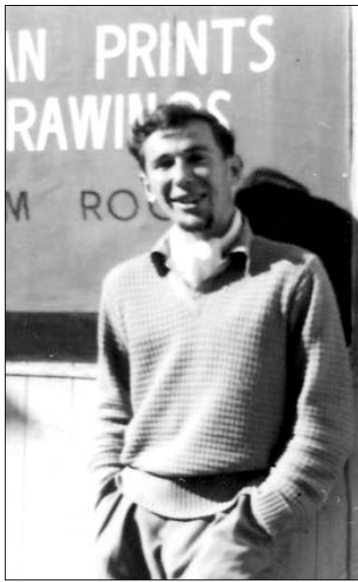
Genius Procuta 1959 m. prie N. Zelandijos Auklando miesto meno galerijos, į kurią iš Australijos atvežė 7 lietuvių meno darbus "Lithuanian Prints and Drawings"

Atgavus Vilnių, tėvo karininkų dalinį perkėlė į senąją Lietuvos sostinę ir istorinę Lietuvos širdį. 1941 m. birželio 13-14 d. iš arti, kaip 8 m. vaikas,