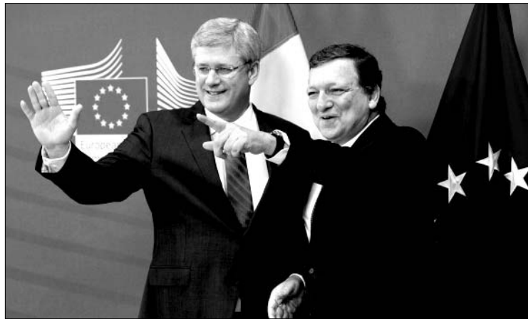
Kanados PM S. Harper ir ES komisijos prez. J.M. Barosso

Kanados ministeris pirmininkas S. Harper Briuselyje pasirašė su Europos sąjunga ilgai rengtą sutartį. Pasirašytas laisvos prekybos dokumentas kol kas tik simbolinis, jis įsigalios tik po poros metų, kai patvirtins kiekviena iš 28 Europos sąjungos narių.