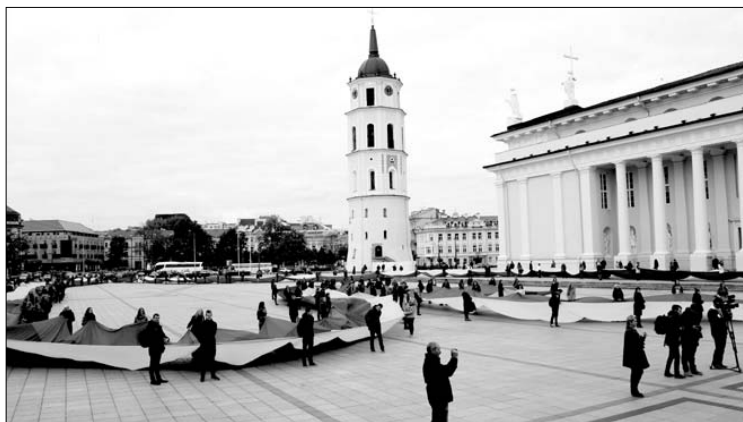
Lietuvos jaunimas Vilniuje Katedros aikštėje surengė Lietuvos ir Ukrainos vienybės dieną

TĖVIŠKĖS ŽIBURIAI THE LIGHTS OF HOMELAND