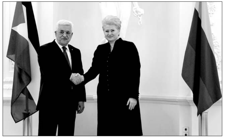
Vilniuje su oficialiu vizitu spalio 21 d. pirmą kartą lankėsi Palestinos prezidentas M. Abbas. Nuotraukoje priėmimo metu svečias kartu su Lietuvos prezidente D. Grybauskaite

Lietuvos prezidentė Dalia Grybauskaitė susitiko su Palestinos prezidentu Mahmud Abbas. Tai pirmasis dabartinio Palestinos vadovo vizitas Lietuvoje. Pagrindinis prezidento M. Abbas apsilankymo tikslas – aptarti Artimųjų Rytų taikos procesą su Europos sąjungos Tarybai pirmininkaujančios Lietuvos vadove. Prieš atvykdamas į Lietuvą Palestinos vadovas susitiko su Romos popiežiumi Pranciškumi ir Vokietijos kanclere Angela Merkel. Prezidentė pabrėžė, jog Europos sąjunga remia Palestinos ir Izraelio sprendimą sėsti prie taikos derybų stalo. Prieš kelerius metus nutrūkusios taikos derybos buvo atnaujintos šių metų rugpjūtį.