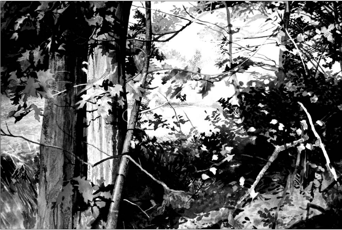
Dail. Ona Ališauskas – Hikinghappy (akvarelė)