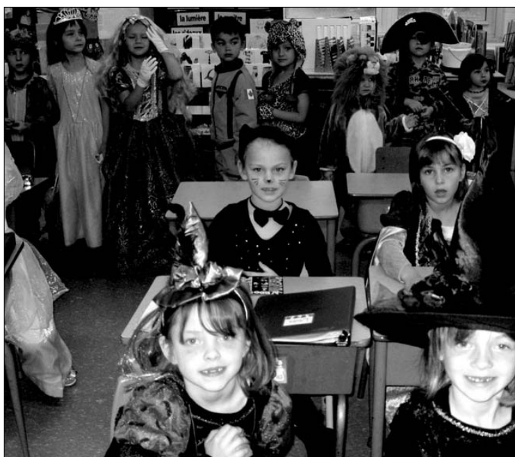
Maironio mokyklos kaukių baliuje spalio 26 d. pasipuošę jaunesniųjų ir vyresniųjų darželio ir pirmojo skyriaus mokiniai