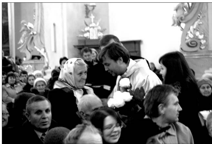
Iškilmingų Mišių akimirka Seinų bazilikoje

Mišių metu dėkota dar gyviems anų metų įvykių dalyviams ir melstasi už jau iškeičiusių iš šio pasaulio sielas. Iškilmes Seinų bazilikoje