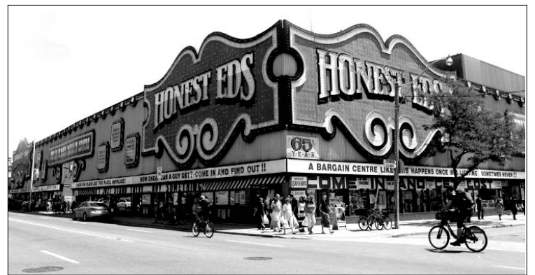
Parduotuvė “Honest Ed’s” Toronte

Dviejų Toronto istorinių prekybos centrų ateitis neaiški. Buvęs Eaton Centras, dabar Sears Canada, turistų mėgstama lankymosi vieta, ir populiari pigių prekių parduotuvė “Honest Ed’s” keičia savininkus. Parduodamas beveik 70 metų Mirwish šeimai priklausęs pastatas ir sklypas Bloor/Bathurst gatvių sankryžoje miesto centre.