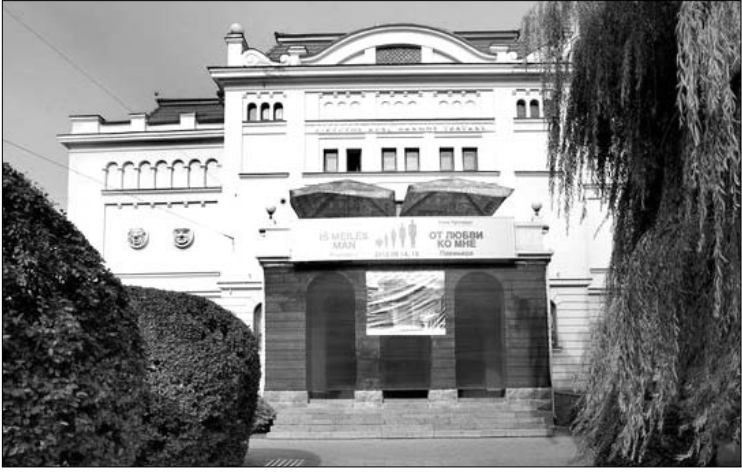
Šimtmetis pastatas Vilniuje, J. Basanavičiaus gatvėje mena Lietuvos valstybės ir Lietuvos teatro istoriją

Dabartinio Lietuvos rusų dramos teatro pastatas Vilniuje, J. Basanavičiaus gatvėje, pastatytas lygiai prieš šimtmetį (1913 spalio 12, arch. W. Michniewicz), įdomus ne tik savo išvaizda. Šimtmetis pastatas mena ne tik reikšmingus teatro, bet ir Lietuvos valstybės istorijos įvykius: čia 1917 metų rugsėjo 18-22 d.d. vyko Vilniaus konferencija, numaçiusi nepriklausomos Lietuvos valstybės sukūrimą, Steigiamojo seimo sušaukimą, įsteigusi Lietuvos tarybą.