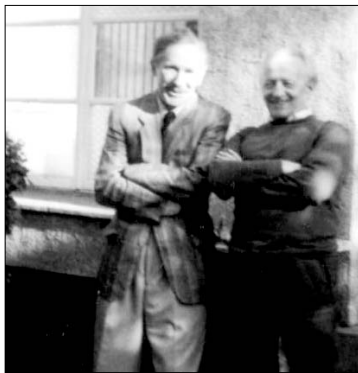
1980 ar 1982 m. su Vilniaus univ. rektorium, dr. prof. Jonu Kubiliu prie jo namo Antakalnyje, Vilniuje

Knygų, kaip ir meno objektų dovanos mokslo ir meno įstaigoms yra visuotinai priimta ir praktikuojama kultūringa ir prasminga, pagarbos ir dėmesio išraiškos forma. Todėl nuoširdžiai kvietėme ir raginame užsienio lie-