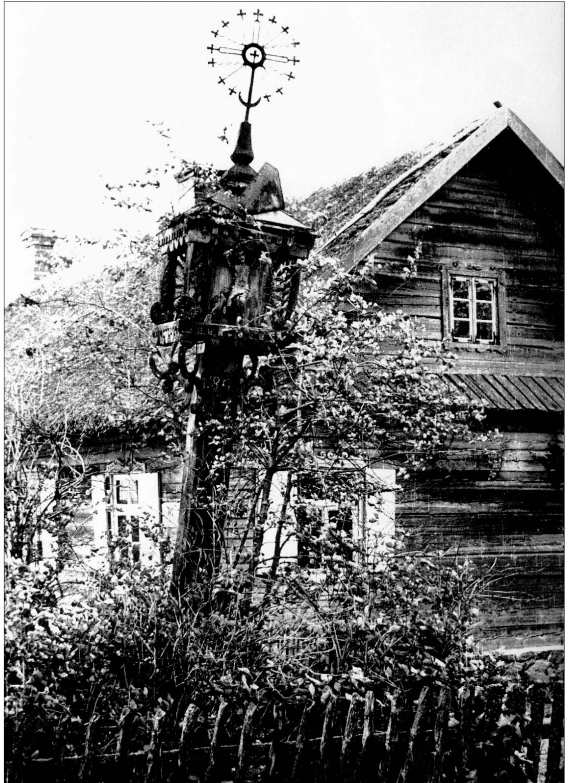
Koplytstulpis prie sodybos, statytas 1854 m. Želčių k., Pašvitinio vls., Šiaulių apskr.

Iškilmingos Mišios Seinų bazilikoje – 2 psl. Strateginiai energetikos projektai – III – 3,5 psl. Ketvirtas laiškas išėjusiam draugui – 4,11 psl. Gražiai paminėta amžiaus sukaktis – 6 psl. Laiškas iš Ekvadoro (Tęsinys) – 8 psl. Lietuviškai pastogei dar vienas dešimtmetis – 10 psl.