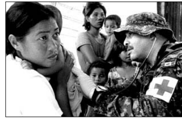
Kanadietis medikas teikia pagalbą filipinietei

ta, aprangą, vandenį, vaistus. Kanadiečių medikų grupės su vandens valymo įrenginiais; Kanados skubios pagalbos grupė ir trys kariniai sraigtasparniai dirba nelaimės vieto-