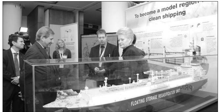
Baltijos valstybių forumo parodoje Lietuvos prezidentė Dalia Grybauskaitė ir kiti dalyviai

Vilniuje lapkričio 11 d. vyko 4-asis Baltijos jūros regiono strategijos forumas. Tai vienas iš didžiausių ir svarbiausių Lietuvos pirmininkavimo ES Tarybai renginių, kuriame susirinko apie 700 dalyvių. Forumas skirtas Baltijos jūros regiono iššūkiams ir galimybėms aptarti, įgyvendinant aplinkosaugos reikalavimus ir kartu skatinant ekonominį augimą, darbo vietų kūrimą ir konkurencingumą. Baltijos jūros regiono strategija vienija 8 ES šalis – Lietuvą, Latviją, Estiją, Lenkiją, Vokietiją, Daniją, Švediją ir Suomiją. Jos tikslas – gerinti viso regiono susisiekimo sistemas, didinti energijos tiekimo saugumą, rūpintis Baltijos jūros švara ir saugiu laivų eismu. Lietuvai ypač svarbi Baltijos jūros regiono energetikos projektų pažanga.