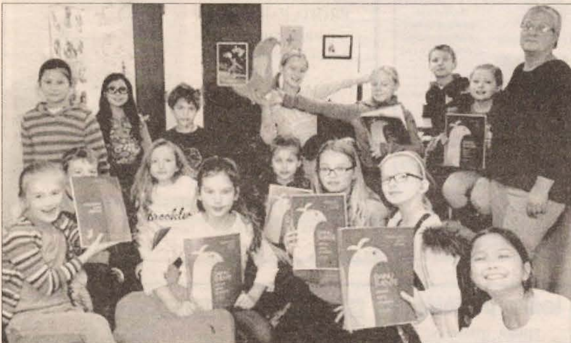
Pirmasis Melodijos nutūpimas – pas Maironio lituanistinės mokyklos chorą Niujorke

Beje, čia visai tinkama vieta kreiptis su štai tokiu klausimu: kas šiapus Atlanto grojate akordeonu? Mums jūsų, vietinių talentų, LABAI reikia! Kodėl, kol kas nesaky-