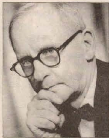
Vladas Jakubėnas (1904-1976)