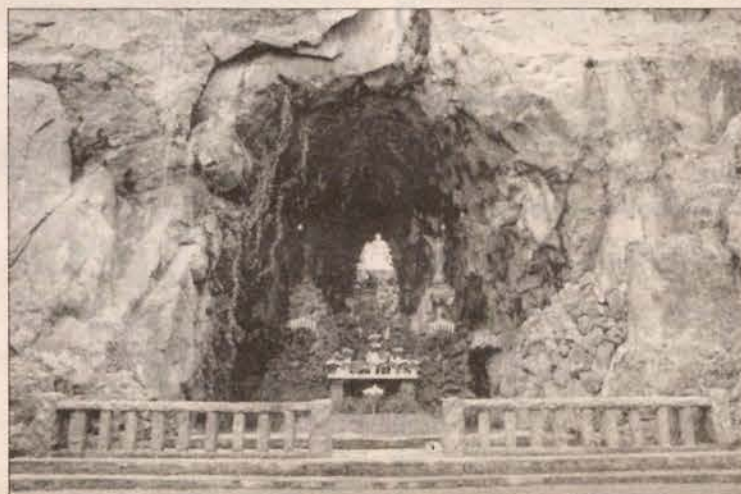
Portlando Grotas tapo ramybės prieglobstiu visų žemės tautų žmonėms; šventovę kasmet aplanko apie 200,000 tikinčiųjų

Lietuvių kryždirbių palikimas išdidžiai stūkso beveik kiekvienoje Amerikos valstijoje, kur yra apsigyvenę šiek tiek daugiau nei saujelė “paklydusių” Lietuvos vaikų. Prisiminus išėivijos lietuvių tradi-