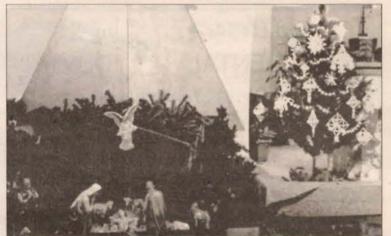
Gražiai papuošta Šv. Kazimiero parapijos šventovė Kalėdų metu

Šv. Elzbietos draugija ruoš kavutę po Mišių sekmadienį, sausio 18. Narės prašomos atsinešti draugijos knygeles ir užsimokėti metinį narės mokesį. VL