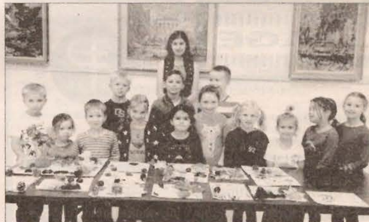
Lituanistinė mokyklėlė “Atžalynas” pirmą kartą duris atvėrė 2014-ųjų metų rugsėjį

cijas, nesudėtinga suprasti, kodėl ir tokioje, rodos atokioje, vietoje kaip Portlandas prieš pusę amžiaus iškilo devynių metrų aukščio koplytstulpis, vienas iš vos ketverių