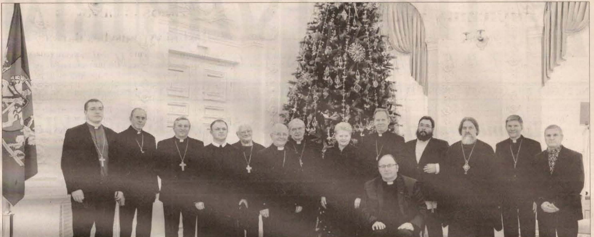
Lietuvos prezidentė Dalia Grybauskaitė susitiko su Lietuvos tradicinių krikščioniškųjų bendruomenių vadovais. Prezidentė su dvasininkais kalbėjosi apie tikinčiųjų bendruomenių indėlį, stiprinant visuomenės santarvę, Bažnyčios iniciatyvas sprendžiant opias socialines problemas ir prisidedant prie kovos su alkoholizmu, smurtu, vykdant savižudybių ir korupcijos išankstinę apsaugą