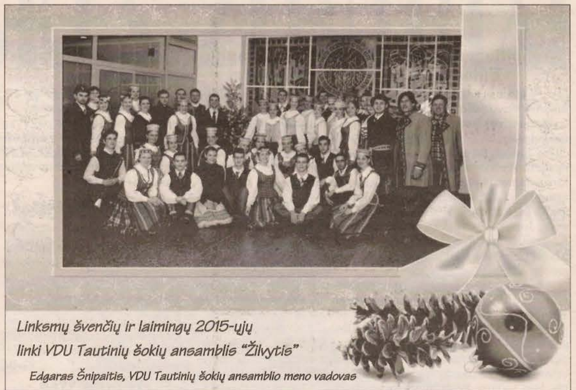
Linksmų švenčių ir laimingų 2015-ųjų linki VDU Tautinių šokių ansamblis "Žilvytis"

IRENA DEGUTIENĖ, seimo pirmininkės pavaduotoja