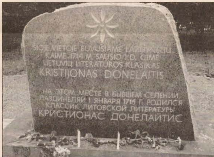
Paminklas Donelaičiui Lazdynėliuose