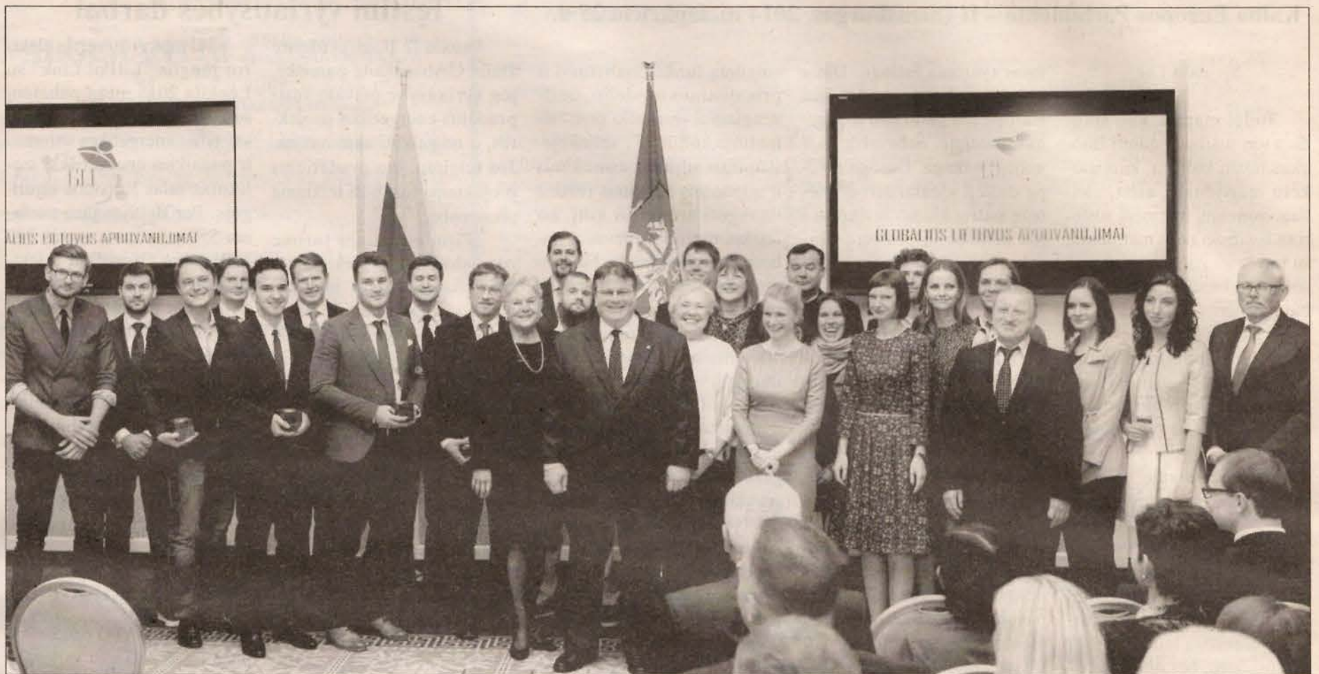
Apdovanojimo iškilnių dalyviai prezidentūroje; centre – Lietuvos užsienio reikalų ministeris Linas Linkevičius