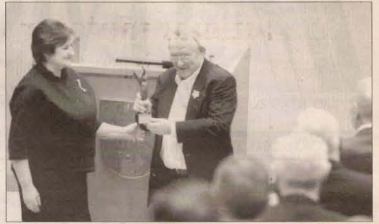
2014 metų Laisvės premijos laureatui, Lenkijos buvusiam disidentui, dienraščio Gazeta Wyborcza vyriausiam redaktoriui Adam Michnik apdovanojimą įteikia Lietuvos seimo pirminkė D. Grauzinienė