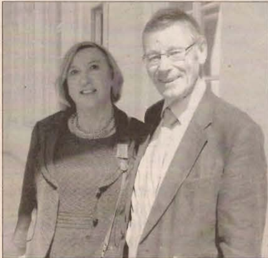
Straipsnio autorė su vyru