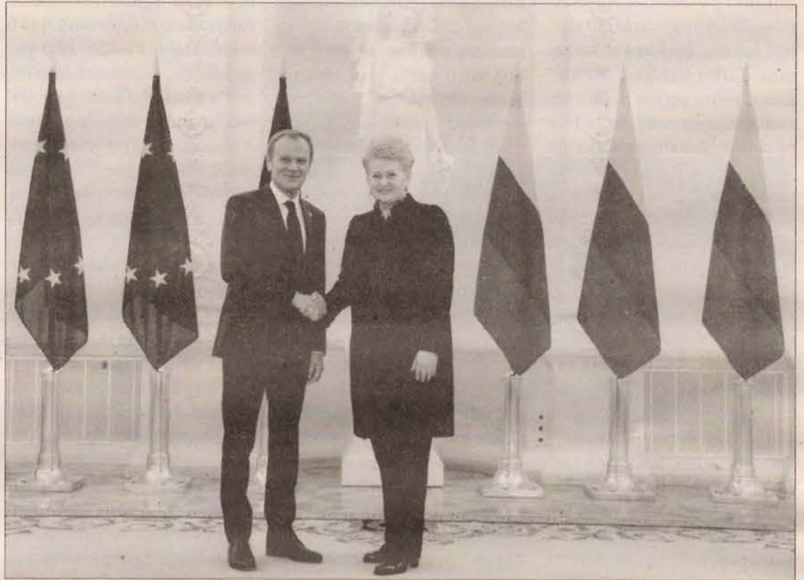
Sausio 14 d. Vilniuje lankėsi Europos Vadovų tarybos (EVT) pirmininkas D. Tusk. Susitikime su Lietuvos prezidentė D. Grybauskaitė aptarė svarbius Lietuvai ir visai ES klausimus. Buvęs Lenkijos premjeras D. Tusk Europos Vadovų tarybai, kurioje posėdžiauja valstybių ir vyriausybės vadovai, pirmininkauja nuo praėjusių metų gruodžio mėn. Į Vilnių jis atvyko dalyvauti Lietuvos įstojimo į euro zoną renginiuose.