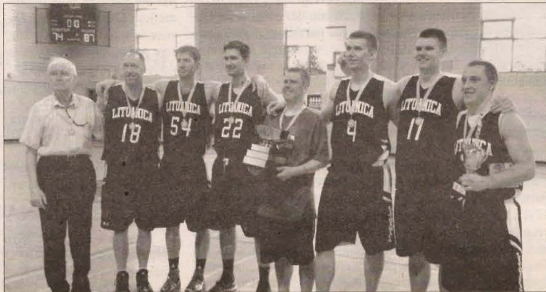
ŠALFASS žaidynių, vykusių 2014 m. gegužės mėn. pabaigoje, Toronte vyrų krepšinio "A" (pusiau profesionalių komandų) varžybų nugalėtojai. Čikagos "Lituanica" atiteko Lietuvių fondo įsteigta taurė ir čempionams skirti proginiai medaliai

ma www.salfass.org ), o dėl populiariausių Šiaurės Amerikos lietuvių krepšinio, tinklinio, stalo bei lauko teniso ir šachmatų varžybų apturėta karštų diskusijų. Galų gale paaikškėjo, jog mūsų pamaina šių metų pavasarį vyks aplankyti "Didžiojo obuolio": vaikų ir jaunimo (iki 16 m. amžiaus) krepšinio žaidynes organizuos Niujorko Lietuvių atletų klubas balandžio 25-27 d.d. Pag-