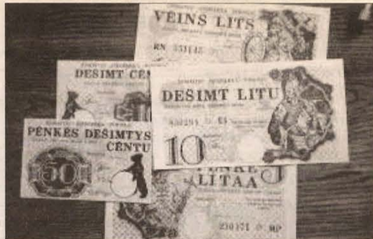
Seni lietuviški pinigai