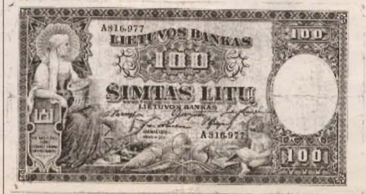
Pirmieji Lietuvos respublikos litai

ry, druską mokant auksu. Už degtinę – pusę kainos auksu. Tokiu būdu iš Lietuvos buvo išvežta į Vokietiją auksinių rublių už 2.2 milijono aukso markių. Lietuvoje cirkuliuo trijų rūšių piniginiai vienetai – ostrubliai (privaloma mokėjimo priemonė), Rusijos rubliai ir Vokietijos markės. Gyventojai geriausiai laikė rublius, o blogiausiai – „ostus“. 1916 metų spalio mėnesį išleistos 1, 2, 3 kapeikos, 1917-aisiais išleisti popieriniai 20 „osto“ kapeikų ženklai. 1917 m. gegužės 30 d. Skolinamosios kasos būstinė perkelta į Kauną ir pradėti keisti ostrubliai į markes santykiu 1:2, bet išliko ir caro rublių kursas, todėl 1917 metų gegužės mėnesį už rublį mokėjo 2.43 markės. Carinio rublio kurso kilimas didino jo paklausą ir silpnino vokiečių pinigų pozicijas. Iki 1922 m. Lietuvos gyventojai naudojo Vokietijos piniginius ženklus markėmis ir pfenigiais, tik vadino juos auksiniais ir skatikais. 1917 m. liepos 24 d. buvo uždraustas atsiskaitymas cariniais rubliais. Lietuvoje atsirado Rusijos dūmos ir Kerensko vyriausybės išleistų pinigų, bet vokiečiai juos iškart uždraudė naudoti. Rusijos rublio vertė krito. 1918 m. balandžio 4 d. buvo išleistos ostmarkės ir