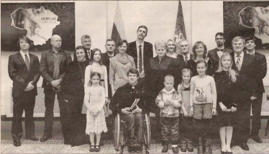
Konkurso nugalėtojai kartu su prezidente Dalia Grybauskaite