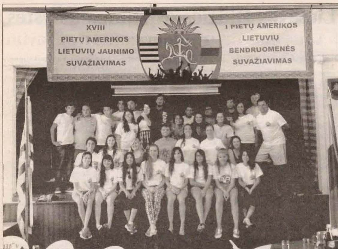
XVIII Pietų Amerikos lietuvių jaunimo bei I-ojo Pietų Amerikos bendruomenės suvažiavimo, įvykusio š.m. sausio 13-18 d.d. Urugvajuje, dalyviai