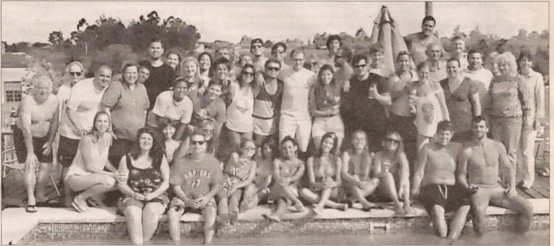
Iš XVIII Pietų Amerikos lietuvių jaunimo suvažiavimo š.m sausio 13-18 d.d. Urugvajuje – atgaiva po posėdžių ir kelionių prie baseino

Vieną dieną praleidome Montevideo sodyboje "La Manta" prie baseino. Programa prasidėjo diskusijomis, kur kiekvieno krašto delegacija pasisakė tema: "Lietuvybės išlaikymas per šimtmetį Pietų Amerikoje" ir "Kaip atrodys Pietų Amerikos lietuvių bendruomenės bei lietuviybė mūsų kontinente po 30-ies metų". Vakare vyko Talentų vakaras. Kiekvienas LJS kraštas smagiai pasirodė, visi