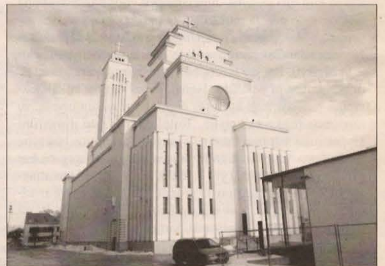
Kauno Kristaus Prisikėlimo šventovė

Kauno Šv. apaštaltų Petro ir Pauliaus arkikatedra bazilika (bazilikos titulas 1921 m.), Vilniaus Šv. vysk. Stanislovo ir šv. Vladislavo arkikatedra bazilika (1922 m.), Šiluvos Švč. M. Marijos Gimimo bazilika (1974 m.), Žemaičių Kalvarijos Švč. M. Marijos Apsilankymo bazilika (1988 m.), Marijampolės Šv. arkangelo Mykolo bazilika (1992 m.) ir Krekenavos Švč. M. Marijos Ėmimo į dangų bazilika (2009 m.). Visos jos drauge su Kauno Kristaus Prisikėlimo šventove yra Šv. Jono Pauliaus II piligrimų kelio. Inf.