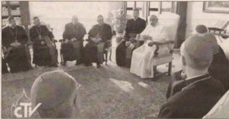
Lietuvos vyskupai Vatikane