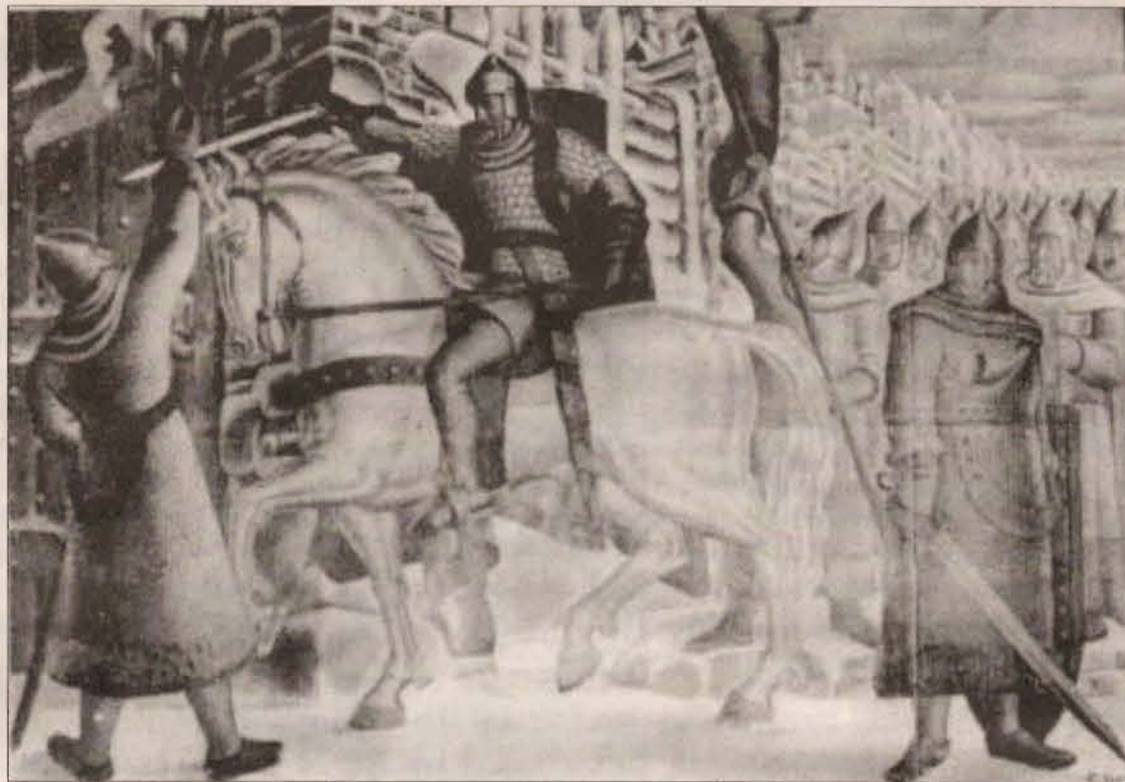
DLK Algirdas smogė į Maskvos vartus 1368 m.