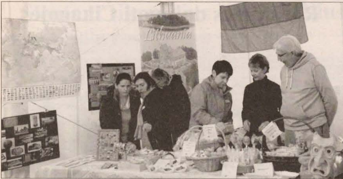
Edmonton, AB, lietuvių bendruomenės suruoštoje Lietuvos Nepriklausomybės šventėje