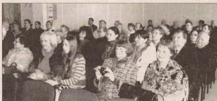
Šventės akimirka Seinų Lietuvių Namuose

šventėje; nežinojau, kad kovo pirmoji paskelbta Pasaulio lietuvių Maldos diena... Antroji šventė – pavasario pranašas Kazimierinės, trečioji – Lenkijos lietuvių šv. Kazimiero draugijos jubiliejus, bendramiškis su Lietuvos Nepriklau-