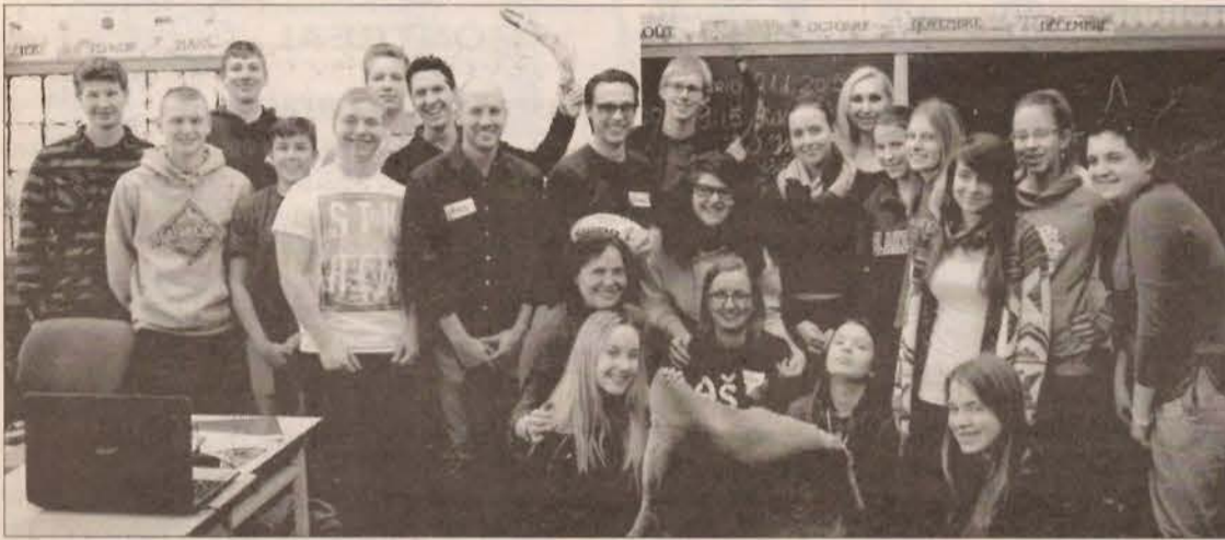
Kanados lietuvių jaunimo sąjungos suruoštas Vasario 16-osios minėjimas vasario 21 d. Toronto Maironio mokykloje