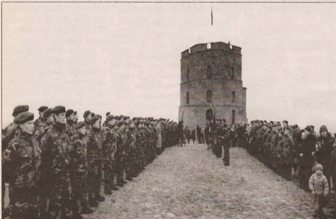
Lietuvos nepriklausomybės 25-mečio minėjimo dieną gynybiniame Gedimino pilies bokšte vyko naujų Lietuvos šaulių sąjungos narių priesaikos iškilmės. Tarnauti Lietuvos valstybės ir visuomenės saugumui priesaiką davė 300 įvairaus amžiaus ir išsilavinimo Lietuvos žmonių