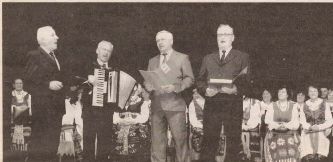
Seinų lietuvių Šv. Kazimiero draugijos vyrų kvartetas

mo maldele lenkiuosi ir kunigo poeto A. Baranausko atminimui. Didinguose skliautuose skamba pašlovinimo giesmės, plaukia padėkos ir užtarimo maldos... Po pamaldų Seinų Lietuvių namuose vyko šventinis minėjimas Mūsų giesmės ir malda tau, šv. Kazimierai . Salė kaip ir šventovė buvo pilnutėlė žmonių. Scenoje Marijampolės Trečiojo amžiaus universiteto choras. Išklusėme aukšto meninio lygio kompoziciją, supintą iš tautinių dainų, giesmių, poezijos ir šv. Kazimiero gyvenimo istorijos.