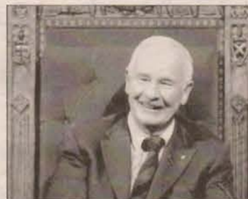
Kanados gen. gubernatorius D. Johnston

D. Johnston buvo paskirtas 2010 m., jo tarnyba turėjo baigtis šiemet. Tačiau atėjęs Kanados svarbiai istorinei datai – 150-osioms konfederacijos įsteigimo metinėms, Kanados vyriausybės vadovas S. Harper, vertinda-