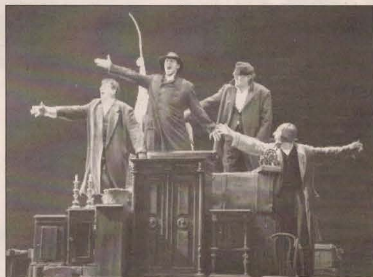
Scena iš spektaklio Nusišypsok mums, Viešpatie

lyg visam gyvenimui, kažkur šmėkšteli nuojauta, kad tai kelionė, iš kurios gal ir negrįžtama. Daiktai tariamame vežime (pats režisierius prilygina jį Nojaus arkai) – tai viso gyvenimo ženklai, kuriuos pagal tradiciją ir pareigą reikia visada turėti su savimi ir išsaugoti, kaip savasties dalį.