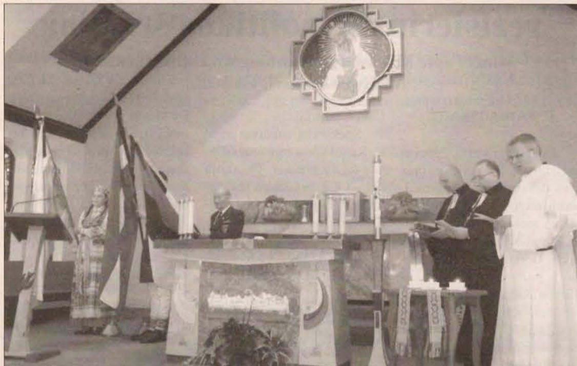
Ekumeninės pamaldos Sibiro tremtiniams atminti Hamiltono Aušros Vartų parapijos šventovėje, kuriose dalyvavo Estijos, Latvijos ir Lietuvos kunigai