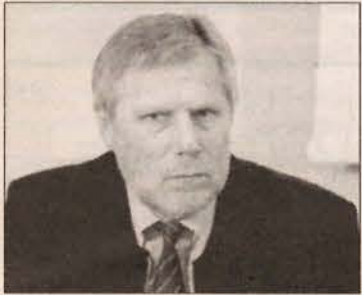
Kompozitorius F. Latėnas

Tik vėliau, kai galvoji apie matytus vaizdus, prisimeni girdėtas replikas, ateina į galvą mintis, kad tai spektaklis ne tik apie juos – Lietuvos žydus, mūsų bendrapiliečius, bet ir apie mus, dabar gyvenančius ne gimtojoje žemėje, ne po savu dangumi. Apie vaikus, ir dabar bėgančius kuo toliau nuo gimtinės, tėvus, trokštančius, kad vaikai ieško-