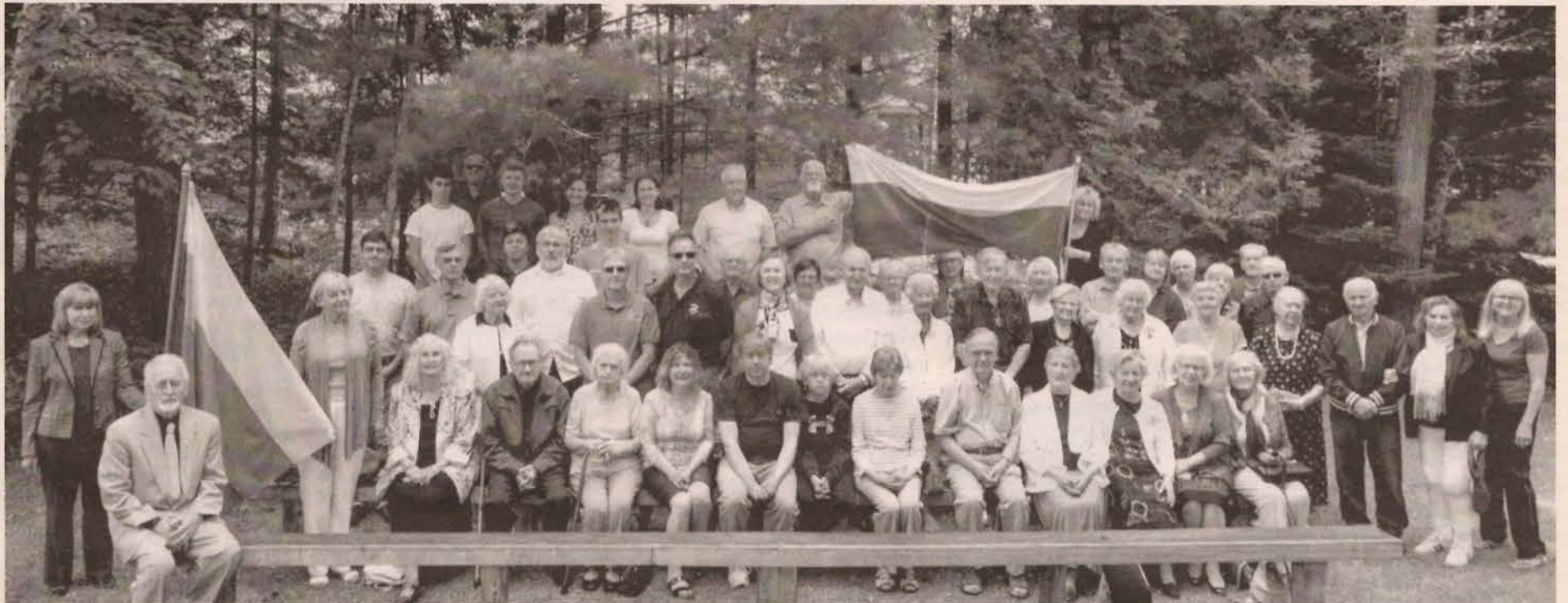
Didesni ir mažesni lietuvių būriai įvairiose pasaulio valstybėse Lietuvos Valstybės dieną, paminėdami karaliaus Mindaugo karūnavimo progą, drauge giedojo Lietuvos himną. Dėl geografinių juostų skirtumo ne visai sutapo giedojimo laikas, tačiau V. Kudirkos giesmės lietuviški žodžiai skambėjo tarsi apjuosdami visą žemės rutulį, skelbdami meilę savo artimam ir tolimam gimtinei Lietuvai. Prie šio choro prisijungė ir Wasaga Beach, ON, lietuviai, po pamaldų Gerojo Ganytojo šventovėje po Mišių sugiedojo Lietuvos himną