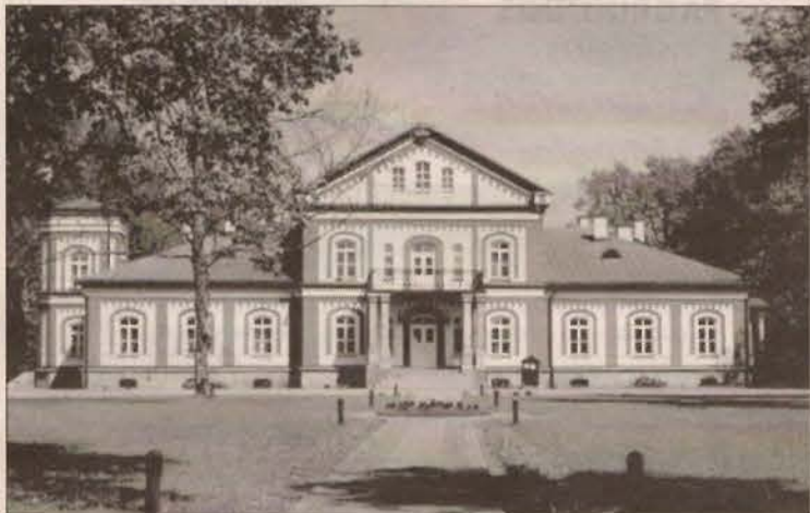
Alantos dvaro rūmai