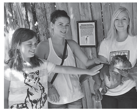
Indian River roplių prieglaudoje – zoologijos pamoka

Nedidelio roplių zoologijos sodo netoli Peterborough (ON) vedėjas sulaukė neįprasto prašymo – priimti globon...150 gyventojų – krokodilų, aligatorių, kaimanų. Visi šie tropinio klimato plėšrieji vandens gyvūnai bent 10 metų buvo laikomi privačioje valdoje pastatytuose akvariumuose. Daugelis jau pakankamai dideli, kad keltų grėsmę prižiūrėtojams. Jų savininkas negalėjo paaiškinti savo neįprasto potraukio šiems gyvūnams, tačiau jis laiku suprato, kad jų tolesnis buvimas namuose gali kelti pavojų ir aplinkiniams gyventojams. Pagal Kanados įstatymus tokius gyvūnus draudžiama laikyti namuose ir veisti; baudos už taisyklių pažeidimą siekia nuo $240 iki $5,000. Tačiau neretai roplius mėgstama slapta laikyti kaip naminius gyvūnus. Praėjusiais metais Toronto High