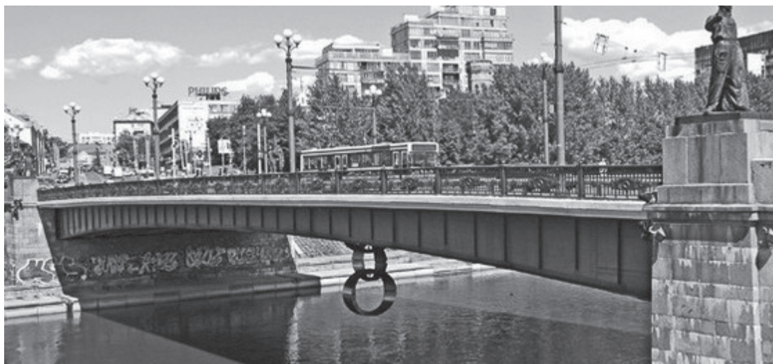
Žaliojo tiltas, Vilnius

Panašu, kad su mūsų istorine atmintimi ne viskas gerai. Ir tai liudija ne vien šis fejtoninis renginys, turėjęs intencijų sužadinti visuomenės pasididžiavimą įvykiais, nutikusiais Lietuvoje 1655-aisiais. Pažvelkime į juos iš arčiau.