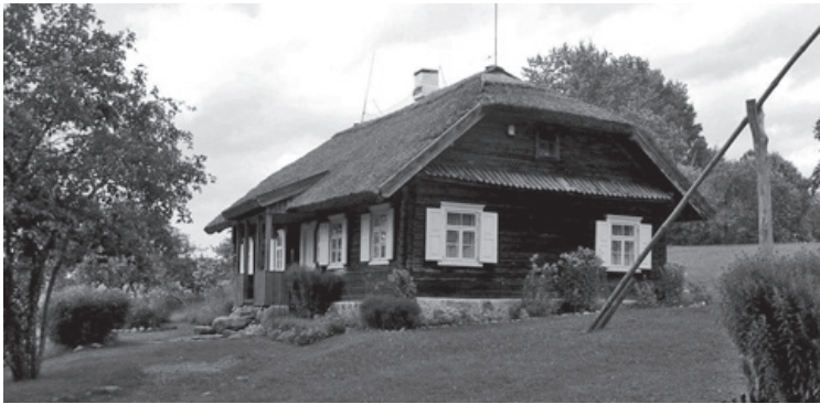
Jono Biliūno muziejus Niūronyse, rašytojo gimtajame name