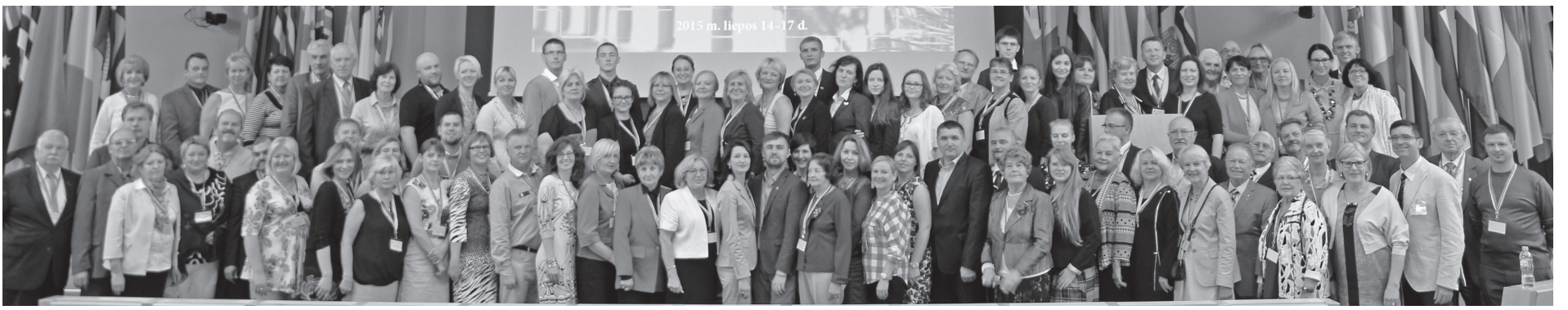
PLB seimo atstovai Vilniuje, posėdžiavę 2015 m. liepos 15-17 d.