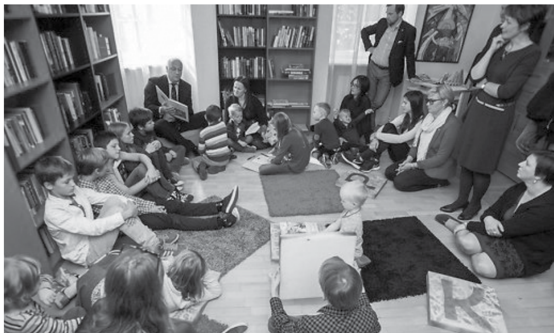
Užsiėmimas Prahos lietuvių šeštadieninėje mokykloje "Debesynas"