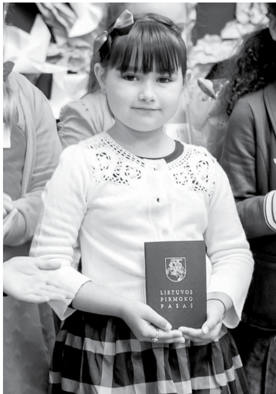
Dublino lietuvaitė su Lietuvos pirmoko pasu

Spalio 3 d. buvo atidaryta ir Prahos lietuviška mainų biblioteka, kurioje bendruomenės nariai