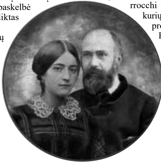
Senovinėje graviūroje – sutuoktiniai Liudvikas ir Marija Azelija Martinai šv. Teresėlės tėvai, paskelbti šventaisiais

Palaimintųjų ir būsimų šventųjų Liudviko ir Marijos Azelijos Martinų gyvenimo šventumas liudija, jog Bažnyčios akyse ir mokyme santuokinė meilė yra kilnus ir tikras šventumo kelias. Jų šeimoje augo iš viso devynios dukros; keturios mirė jaunos, kitos penkios –