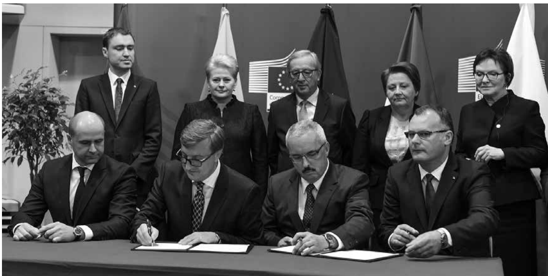
Bruselyje Lietuvos ir Lenkijos atstovai pasirašo sutartį dėl Lietuvos – Lenkijos dujotiekio