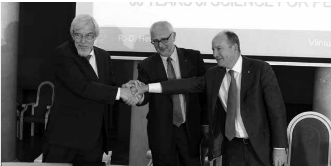
CERN vadovas R.D. Heuer su Lietuvos mokslininkais