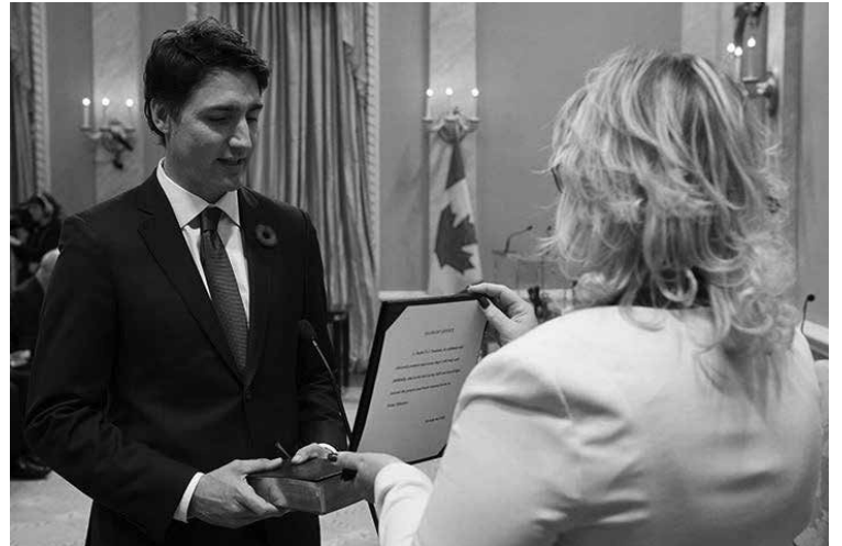
Justin Trudeau – naujasis Kanados ministeris pirmininkas

Lapkričio 4 dieną prisaikdinta naujoji Kanados liberalų vyriausybė ir jos naujasis ministeris pirmininkas Justin Trudeau, tapęs 23-uoju valstybės vadovu. Liberalų partija, spalio 19 federaciniuose rinkimuose laimėjusi didelį rinkėjų palankumą, pakeitė 11 metų vadovavusią konservatorių vyriausybę. Prieš prisaiškinimo iškilmes buvęs konservatorių vyriausybės vadovas S. Harper Kanados gen. gubernatoriui D. Johnston įteikė atsistatydinimo raštą ir pasitraukė į politikos užribį. Naujosios vyriausybės prisaiškinimo iškilmės gen. gubernatoriaus būstinėje vyko viešai, kanadiečiai buvo pakviesti