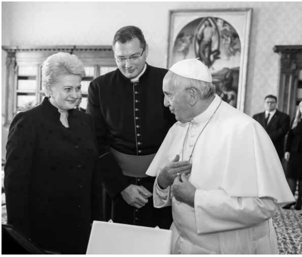
Vatikane Prezidentė susitikime su popiežiumi Pranciškumi

Lietuvos respublikos prezidentė Dalia Grybauskaitė su oficialiu vizitu spalio 29 d. apsilankė Vatikane ir