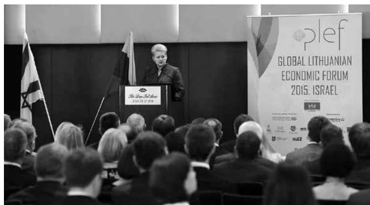
Lietuvos prezidentė D. Grybauskaitė atidaro Pasaulio lietuvių ekonomikos forumą Tel Avive

pirmaujanti pagal inovacijas ir aukštąsias technologijas, turinti puikiai įtvirtintus mokslo ir verslo ryšius visame pasaulyje. Ši valstybė sulaukia dvigubai daugiau kapitalo investicijų nei JAV ir pirmąją pagal startuolių – sukuriama jauno verslo skaičių. Prezidentės tvirtinimu, erdvę abiejų valstybių bendradarbiavimui atveria ir chemijos pramonė, biotechnologijų sritis, medicinos, žemės ūkio ir gyvybės mokslai, turizmas ir kt.