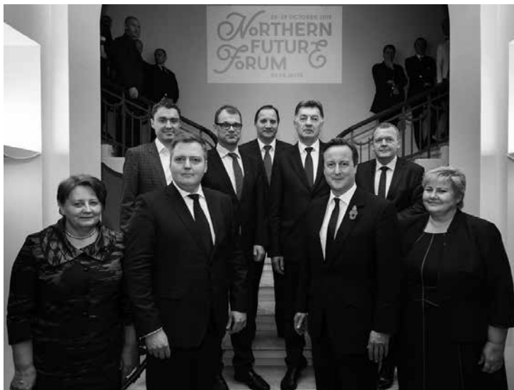
Lietuvos ministeris pirmininkas A. Butkevičius (4 iš d) Šiaurės tarybos posėdyje Reikjavike

Šiaurės ir Baltijos šalių (Danijos, Islandijos, Norvegijos, Suomijos, Švedijos ir Estijos, Latvijos bei Lietuvos) vyriausybės vadovų susitikime aptarti svarbūs klausimai, susiję su tarptautine padėtimi, saugumu, Rytų kaimynystėje, taip pat ekonominėmis reformomis Europoje, ypač Ekonominės ir pinigų sąjungos stiprinimu. Susitikime Lietuvos vadovas pabrėžė, kad būtina ir toliau skirti dėmesį Rytų partnerystės klausimams ir paramai šioms šalims. Kaip pažymėjo susitikimo dalyviai, padėtis Ukrainoje tebekelia susirūpinimą, Minsko susitarimai turėtų būti visiškai