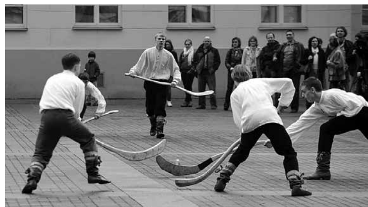
Senovės lietuvių sporto žaidimas – ritinis

Merginos žaisdavo "Trečias bėga", "Žaselės", kartu su vyrais šokdavo ant lentos. Buvo populiarios taip pat bėgikų ir galiūnų imtynės, o taip pat grumtynės su lazdomis ar