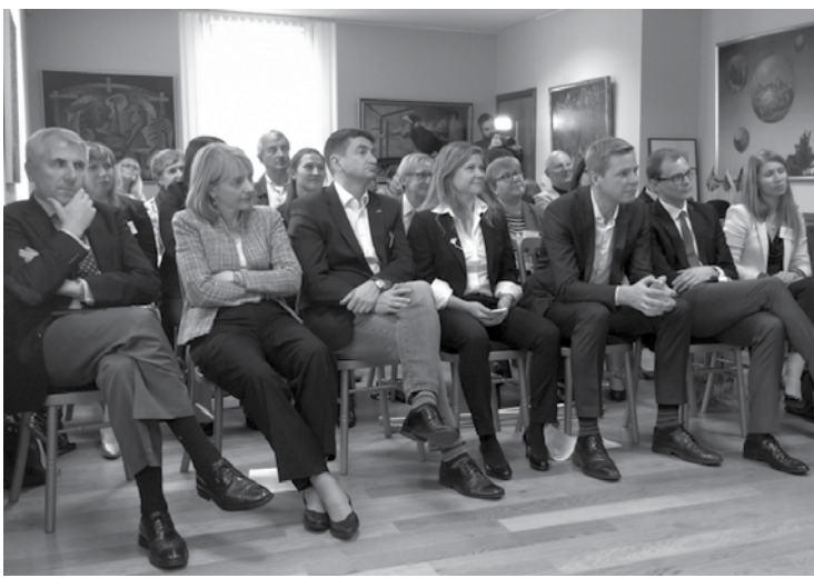
D.Britanijos lietuvių bendruomenės atstovai ir Lietuvos atstovai pokalbyje apie Vienybės susitarimą