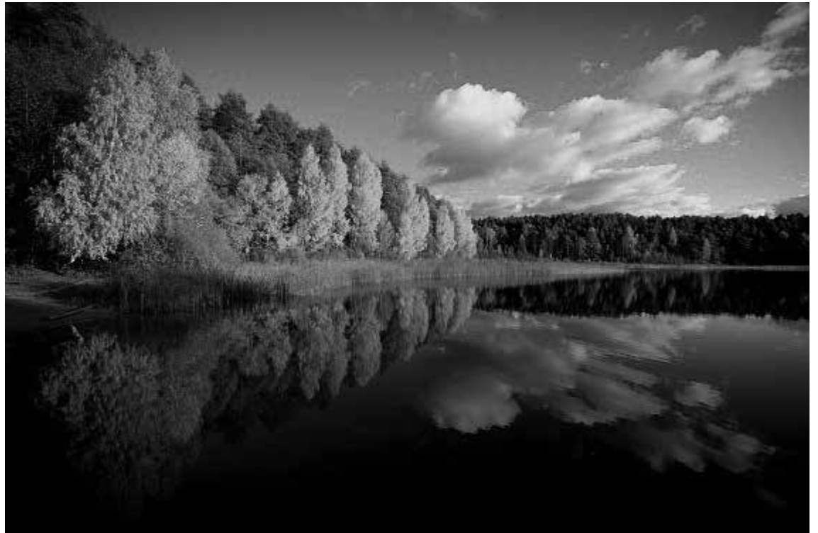
Rudenėjanti Lietuva. Gėlos ežeras