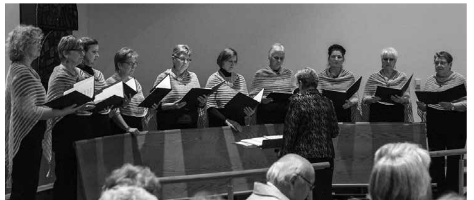
Gieda “Volungės” choro moterų ansamblis