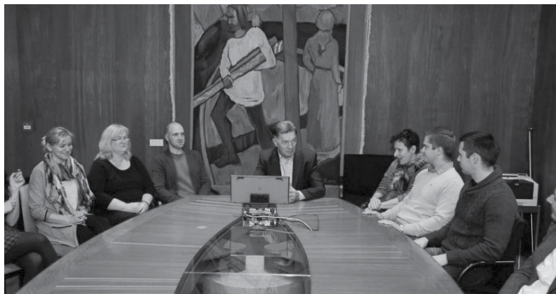
Lietuvos ministeris pirmininkas A. Butkevičius susitikime su Islandijos lietuviu

Lietuvos ministeris pirmininkas A. Butkevičius, lankydamasis Islandijoje, Reikjavike vykusiame Šiaurės tarybos posėdyje ir forume, šių renginių išvakarėse susitiko su Islandijos lietuvių bendruomenės atstovais. Trumpai papasakojęs apie Lietuvos politines ir ekonomines permainas, premjeras padėkojo Islandijos lietuvių bendruomenės atstovams už nuoširdžią ir prasmingą veiklą, vienijančią už tėvynės ribų atsідurusius tautiečius. Ši 2008 metais suburta lietuvių