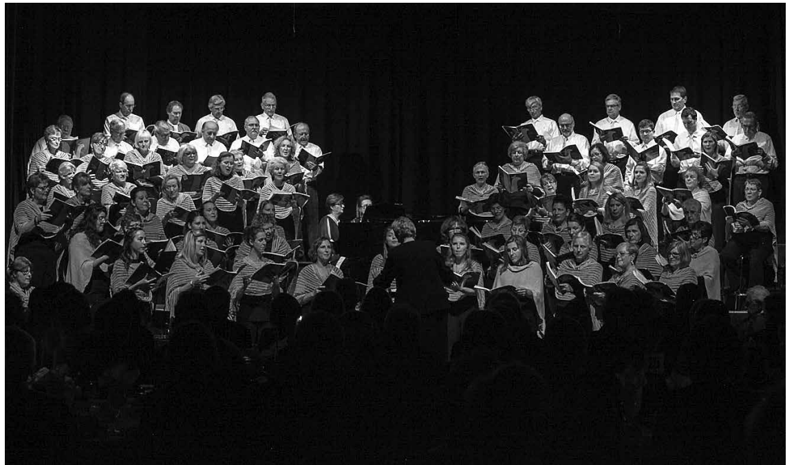
Toronto Prisikėlimo parapijos šventėje dainuoja Didysis choras. Apie šventę skaitykite 4 psl.