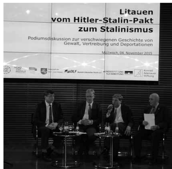
Berlyne K. Adenauerio fondo akademijoje surengto pokalbio apie Lietuvos netektis dalyviai

Diskusijos organizatorių teigimu, pristatant