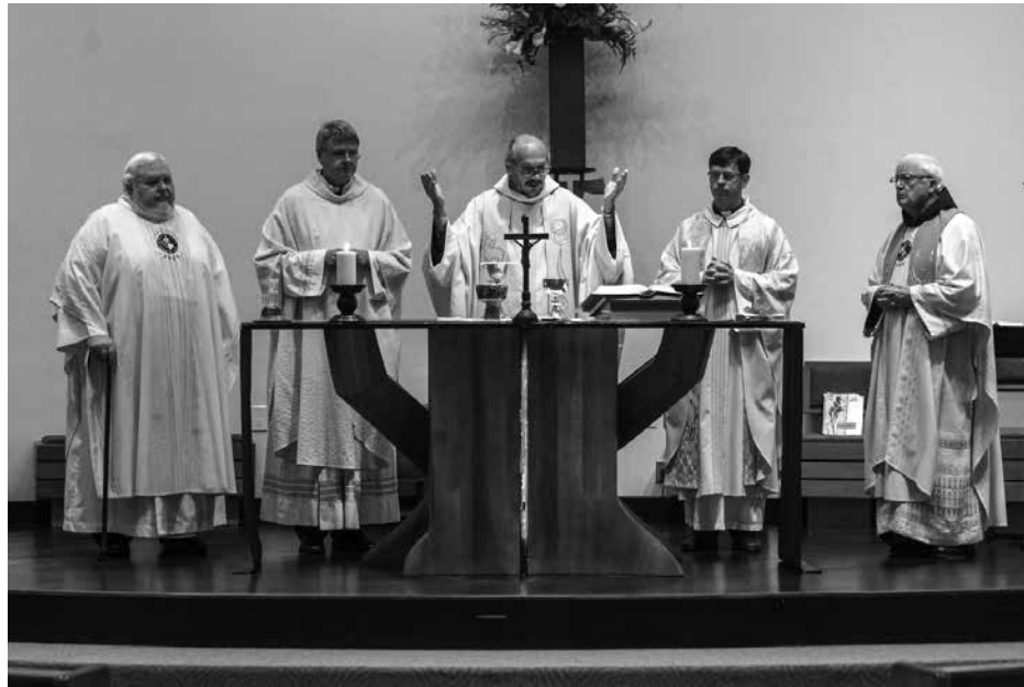
Toronto Prisikėlimo šventovėje aukojamos Padėkos Mišios