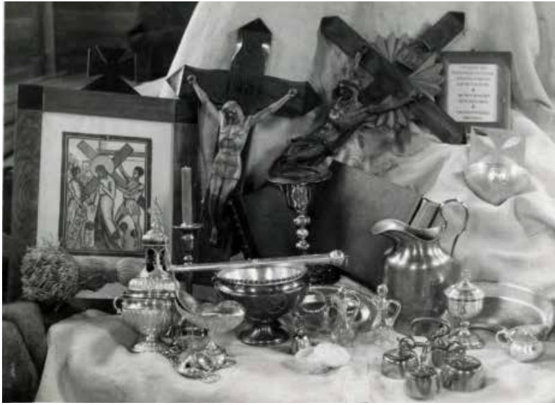
Akmenynės Šv. Kūdikielio Jėzaus Teresės šventovės liturginiai indai

Bažnytinio paveldo muziejaus ir LMA Vrublevskių bibliotekos surengta paroda – tai ne tradicinės