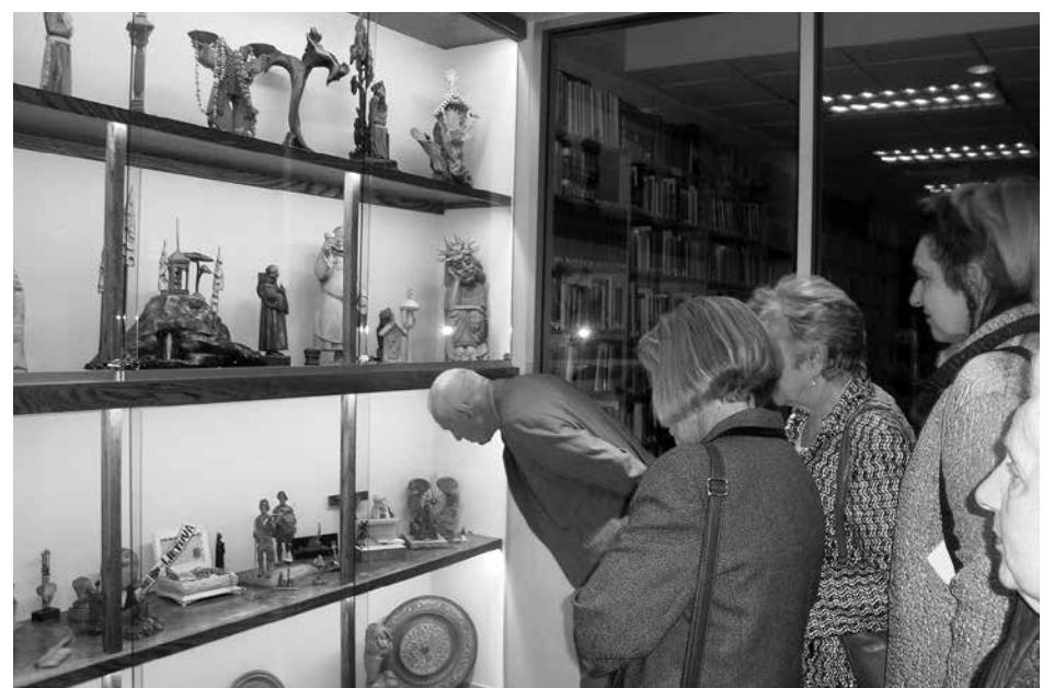
Parodoje – parapijiečių dovanos: medžio skulptūrėlės ir gintaro dirbiniai