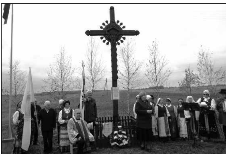
Nuotraukoje kryžius Žiūronių kaime

Spalio 3 d. Krokialaukio šventovėje kun. Gintautas Steponaitis aukojo Mišias už žuvusius ir mirusius partizanus,