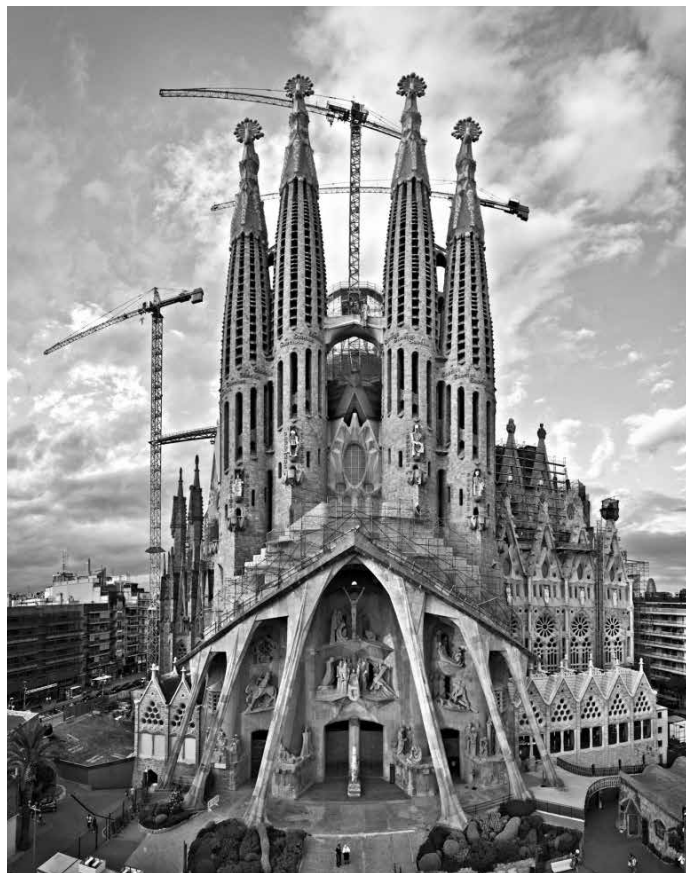
Architekto A. Gaudi „Šventosios šeimos“ šventovė Barcelonoje

Dominikonų ordino puslapyje skelbia, kad jubiliejinių metų proga popiežius Pranciškus suteikė galimybę gauti visuotinius atlaidus tikintiesiems, dalyvausiantiems jubiliejaus šventimo renginiuose, pamaldose, piligrimystėse į dominikonų šventoves ir koplyčias.