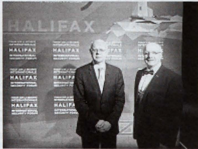
Krašto apsaugos ministeris Juozas Olekas su Kanados pareigūnu Halifakse

Kanados kariai šių metų lapkričio 9-20 dienomis dalyvavo Lietuvoje vykstančiose tarptautinėse pratybose “Geležinis kardas” (angl. “Iron Sword”) ir “Maple Arch 2015” (liet. “Klevo skliautai 2015”). Kanada taip pat skyrė tris karininkus į Lietuvą įkurtą NATO štabą. 2014 metais Kanados naikintuvai sustiprino NATO oro policijos misiją Baltijos šalyse.