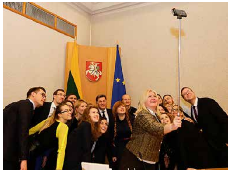
Vilniuje susirinkusios pasaulio lietuvių jaunimo grupės ir Lietuvos ministerio pirmininko A. Butkevičiaus asmenukė (Selfie) prisiminimui

Liepos ir rugpjūčio mėnesiais šeštadieniais uždaryta.