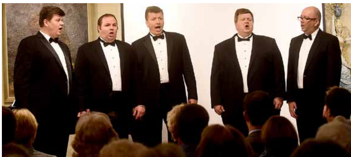
Dainuoja "Dainavos" vyrai

Dėkojame mūsų popietės svečiams, atlikėjams ir Lietuvių Fondui, parėmusiam renginį. Iki kitų mielų susitikimų!