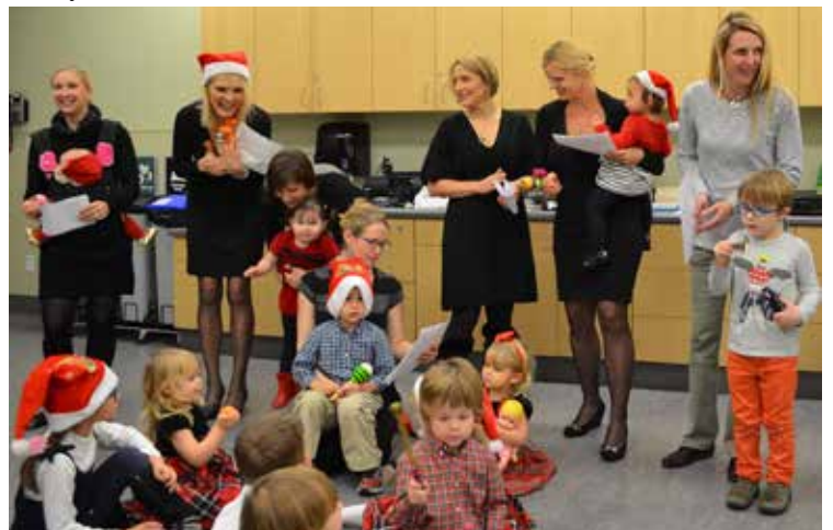
Vankuverio Kalėdos 2015

Linkime visiems džiaugsmingų šv. Kalėdų ir laimingų Naujųjų metų!