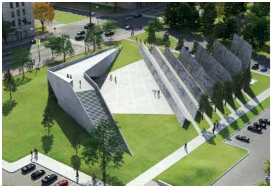
Būsimo paminklo komunizmo aukoms atminti Otavoje projektas

Tas pats su terminu „genocidas“, kuris pradinėse derybose dėl genocido konvencijos 1947 turėjo apimti ir masines neetninių ar religinių grupių, pavyzdžiui, inteligentijos, žudynes. Tačiau vėliau dėl Sovietų Sąjungos prieštaravimo šis apibrėžimas buvo susiaurintas. Komunistai turėjo prieštarauti – juk antraip jiems galėjo būti pareikšti kaltinimai genocidu dėl, pavyzdžiui, buožių. Be