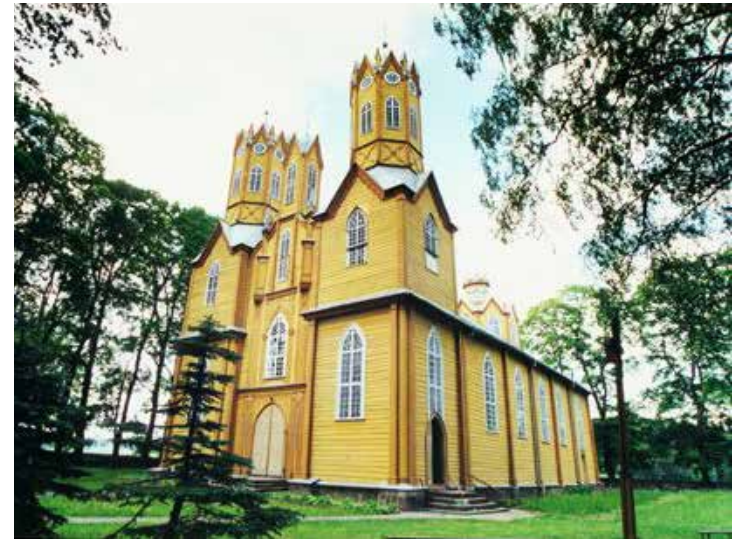
Medinė Nemajūnų šv. Apaštalų Petro ir Pauliaus šventovė

bert Schuman, D. Britanijos premjeras Winston S. Churchill, JAV prezidentas Bill Clinton, Čekijos humanistas ir šios šalies vadovas Vaclav Havel, Vokietijos kanclerė Angela Merkel, Olandijos karalienė Beatričė, Liuksemburgo ministeris pirmininkas Jean Claude Juncker. Šiemetinis Karolio Didžiojo apdovanojimas įteiktas Europos parlamento pirmininkui Martinui Schulzui už pastangas stiprinti demokratiją Europoje. Lietuvos prezidentė Dalia Grybauskaitė šį politikos „Oskaru“ vadinamą apdovanojimą gavo 2013 metais už Lietuvos indėlį, siekiant Europos sąjungos vienybės ir visos Europos ekonominio stabilumo. Inf.