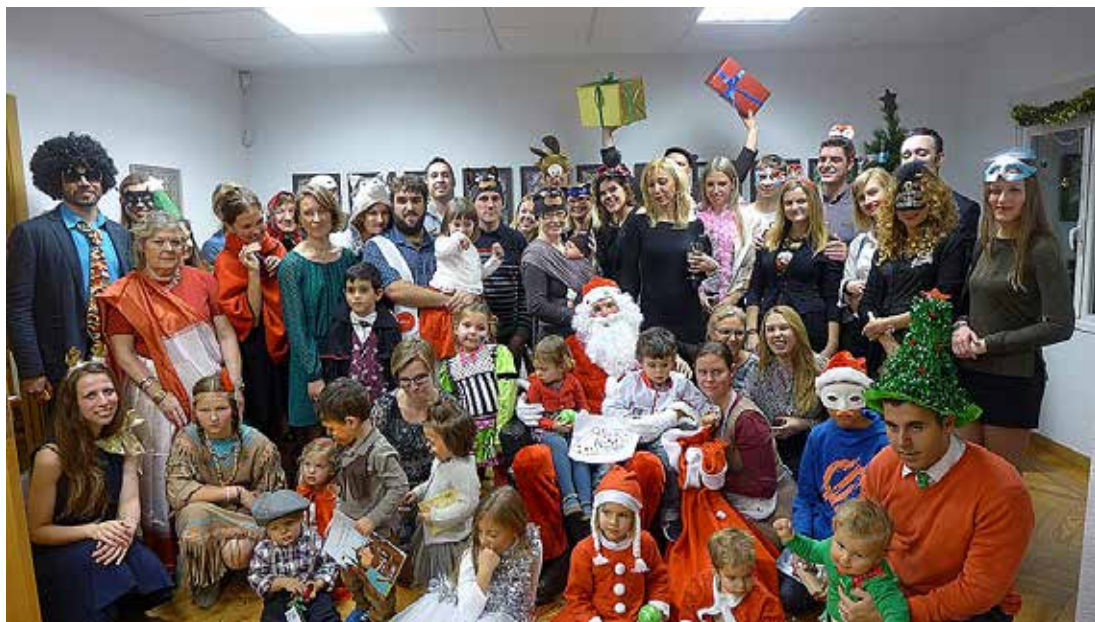
Kalėdos Madrido lietuvių bendruomenėje

Kinija. Kalėdinis vakaras buvo surengtas ir Lietuvos ambasadoje Pekine. Šventės metu mažieji sulaukė Kalėdų senelio, kuriam dainavo kalėdines dainas ir deklamavo lietuviškus eilėraščius.