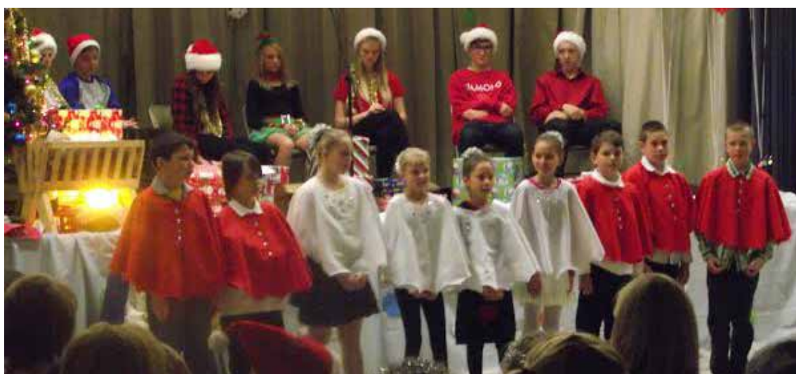
Džiaugsmingų šventų Kalėdų linki Maironio mokyklos pentokai