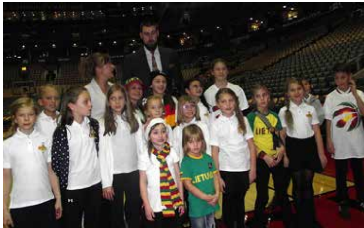
Anapilio parapijos vaikų choras "Gintarėliai" su krepšinininku Jonu Valančiūnu

užduotį atliko be priekaištų ir todėl, baigus himnus, žiūrovai juos įvertino gausiais plojimais. Šiais metais "Gintarėliai" gavo leidimą įrašyti savo giedojimą, tad bet kas gali pasiklausyti jų įrašo YouTube.