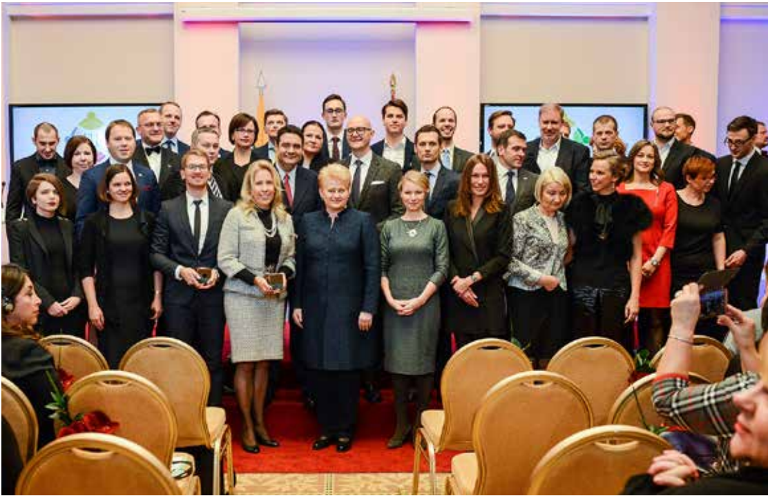
“Globalios Lietuvos” programos laimėtojai su Lietuvos prezidente D. Grybauskaite