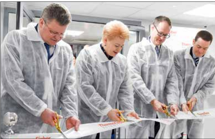
Naujosios “Thermo Fisher Scientific” laboratorijos atidarymas - kerpama juosta

Gruodžio 7 d. Vilniuje iškilmingai atidaryta nauja “Thermo Fisher Scientific” laboratorija. Joje gaminamos magnetinės dalelės turėtų tapti rimtu priešnuodžiu kovoje su onkologinėmis ligomis ir ŽIV. Lietuva – pirmoji ir kol kas vienintelė pasaulyje valstybė, pradanti gaminti tokio lygio technologinius produktus.