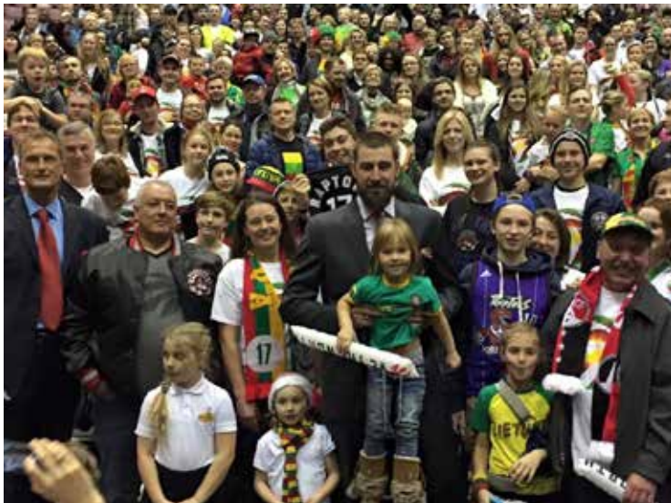
Lietuvių diena Air Canada centre – Raptors krepšininkas Jonas Valančiūnas su tautiečiais