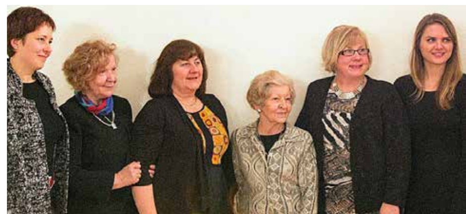
Dabartinė „Tėviškės žiburių“ redakcija