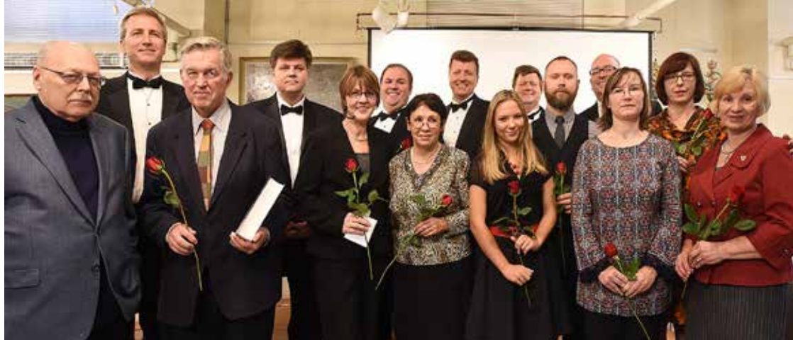
Po knygos pristatymo – visi kartu