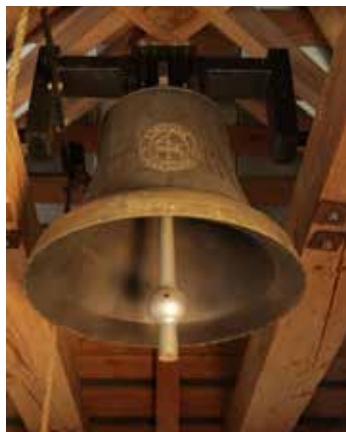
Lietuvos šventovių varpai, tarp jų ir Rumšiškių, skambės vasario 16-ąją

1918 metų vasario 16 dieną Lietuvos Taryba Vilniuje pasirašė dokumentą, kad „skelbia atstatanti nepriklausomą