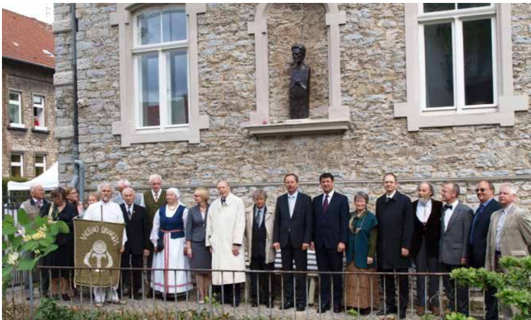
Paminklo Vydūnui atidengimo iškilmės Detmold mieste (Vokietija)