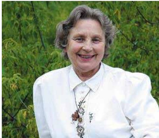
Laisvės premijos laureatė ses. Nijolė Sadūnaite

– Man visada labiausiai rūpi tiesa ir meilė. Nuo mažų dienų matytas tėvų pavyzdys gyventi tiesoje ir meilėje man ir buvo pats geriausias