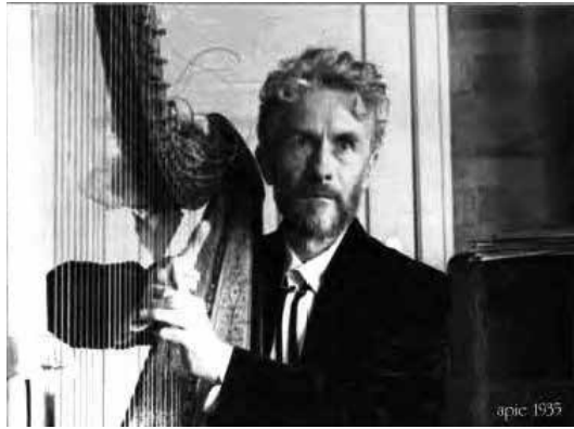
Vydūnas – Vilhelmas Storosta

Svečias pasakojo, kad iš laišku jis pažinęs Vydūną kaip Vokietijos pilietį – tuo atžvilgiu niekas nėra tyrinėjęs Vydūno, ir kaip humanistą. Daug apie Vydūną papasakojo ir jį pažinoję žmonės. Visiems jis palikęs didelį įspūdį