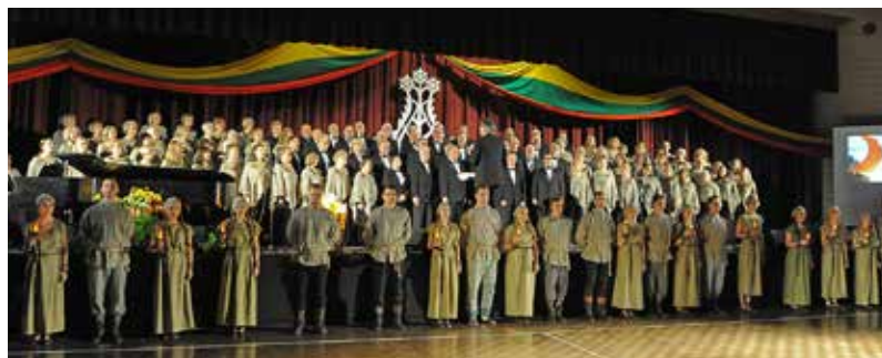
Giedami Kanados, JAV ir Lietuvos himnai