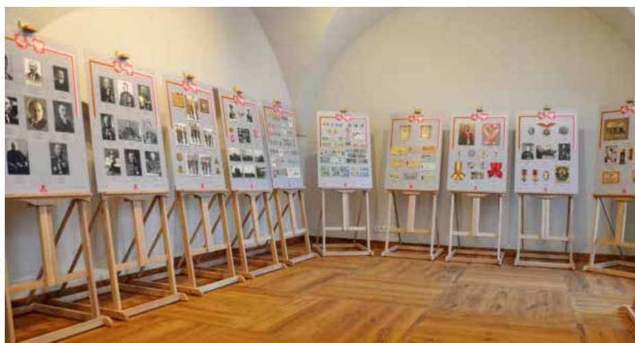
Paroda „Atkurta Lietuvai – 100”