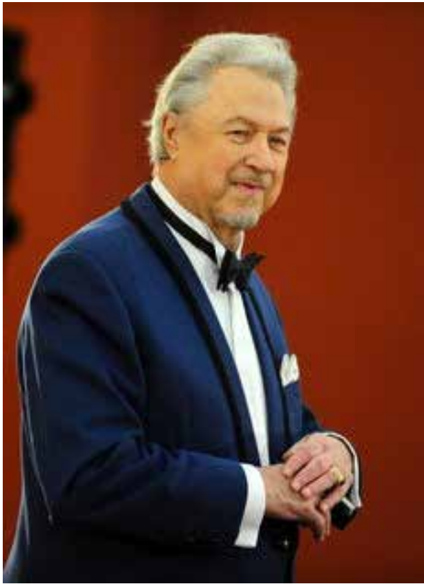
Maestro Virgilijus Noreika (1935. IX.22 – 2018.III. 3)

Ankstyvą kovo 3-iosios rytą netekome Maestro Virgilijaus Noreikos – legendinio lietuvių operos solisto, kurio meninės, kūrybinės ir pedagoginės veiklos pervertinti neįmanoma. Tai, ką šis žmogus sukūrė Lietuvos operos scenoje – tebežavi ir stulbina mus. Pirmąjį solinį koncertą padainavęs 1959 metais, V. Noreika per karjerą jų surengė daugiau per 800. Paskutinįjį Maestro dainavo 2017 m. Visur,