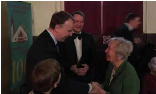
LR ambasadoriaus sveikinimas šimtmetei