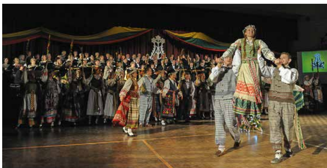
Lietuvos Nepriklausomybės 100-mečiui skirto jungtinio Kanados – Montrelio, Toronto ir JAV Klyvlando lietuvių koncerto akimirkos