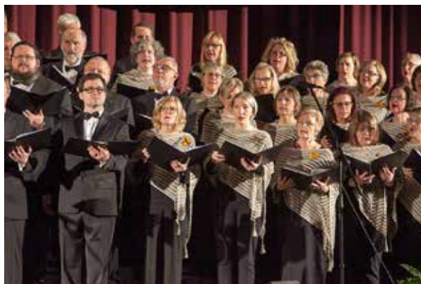
Dainavo beveik 100 dainininkų