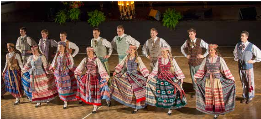
Jubiliejinėje dainų šventėje dalyvauti ruošiasi ir Toronto jaunimo šokių ansamblis „Gintaras“ (vad. R.Jonušonis) „Gintaro“ šokėjai kovo 3 d. koncerte Anapilyje

Bilietų į Dainų šventės renginius kaina svyruoja nuo 5 iki 80 eurų. Vaikai iki trejų metų bus įleidžiami nemokamai ( neužimant papildomos sėdimos vietos ). Renginių laikas skelbiamas Lietuvos laiku.