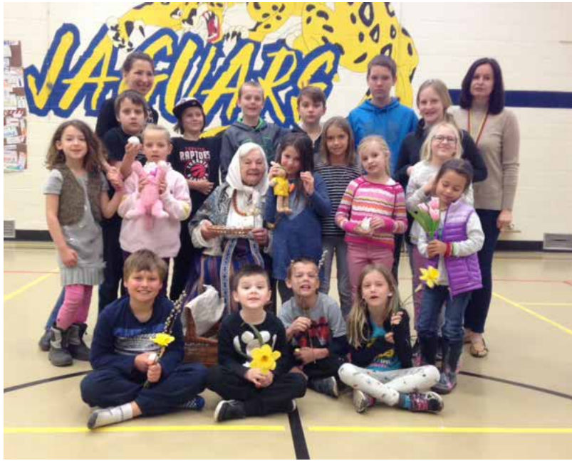
Margučių šventei pasibaigus mūsų bendra nuotrauka

Kovo 17 d. Hamiltono vysk. M.Valančiaus mokyklos mokiniai smagiai praleido šeštadienio rytą. Pagal tradiciją, savaitę prieš Velykas mus aplankė Velykų Bobutė, kuri ne tik smagiai pabendraavo su mokiniais ir mokytojais, bet dar ir atnešė "zuikio" lauktuvių. Po to vaikai margino kiaušinius, dalyvavo margučių ieškojimo bei margučių ridenimo varžybose. Nuoširdžiai dėkoju visiems prisidėjusiems