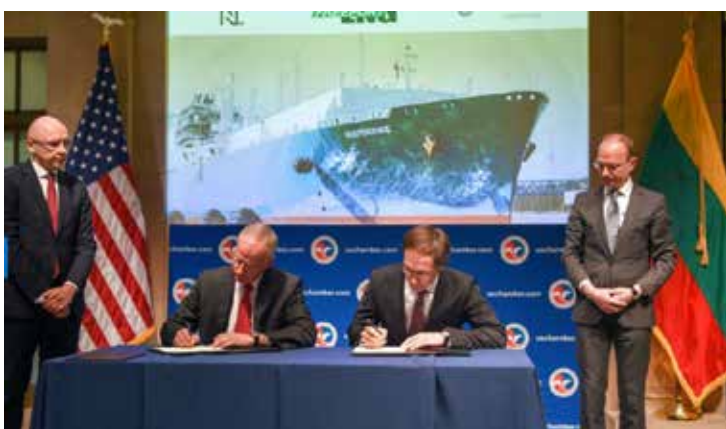
Pasirašoma JAV - Lietuvos bendradarbiavimo sutartis dėl dujų prekybos

Auga ir Amerikos investuotojų Lietuvoje skaičius.