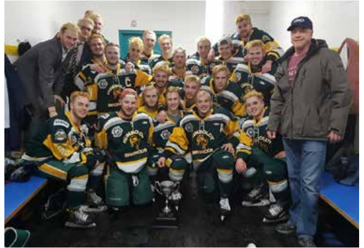
24 Bronco žaidėjų amžius – nuo 16 to 21 metų

Balandžio 6 d. apie 38 km į šiaurę nuo Tisdale, Saskatchewan, žuvo 15 Humboldt Bronco ledo ritulio jaunių komandos žaidėjų, autobusui, kuriuo jie važiavo, susidūrus su vilkiku, pakeliui į Saskatchewan ledo ritulio jaunių lygos (SJHL) atkrentamąsias rungtynes su Nipavin Hawks komanda. Dar 14 žmonių buvo sužeista. Jauniausiam Bronco žaidėjui 16 metų, vyriausiam – 20. Kanados premjeras Jus-