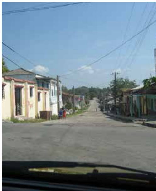
Gatvė prie Neovitas šventovės

bazėje. Pastatai sovietinio stiliaus su betoninėmis sienomis. Pajūryje matosi apšviesti ir baigiantys sugriūti šulinio graižų formos bunkeriai, kuriuose dabar pripilta smėlio, su likusiomis stebėjimo angomis virš žemės paviršiaus. Tokie bunkeriai prie jūros yra maždaug kas šimtas metrų. Kurortas įrengtas kariuomenės štabo pastatuose, o toliau krūmynuose matosi apšviestos ir baigiančios sugriūti buvusios kareivinės.