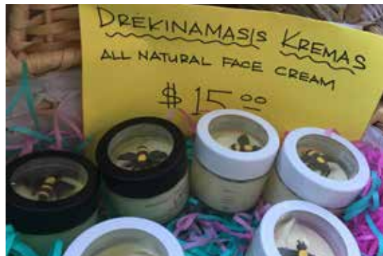
Savanorių pagamintas kremas

Šį pavasarį prekiausime Prisikėlimo parapijoje – balandžio 29 d., gegužės 3 ir 10 d., aukos skiriamos jaunimo ir vaikų chorui. Kremo, pagaminto su specialiu „Gintaro“ aliejumi, galėsite įsigyti per „Gintaro“ (gegužės 5 d.) ir „Gintarėlių“