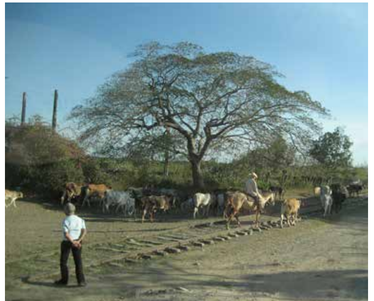
Piemens varomi galvijai