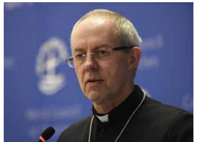
Justin Welby, Kenterberio arkivyskupas, anglikonų Bažnyčios primas