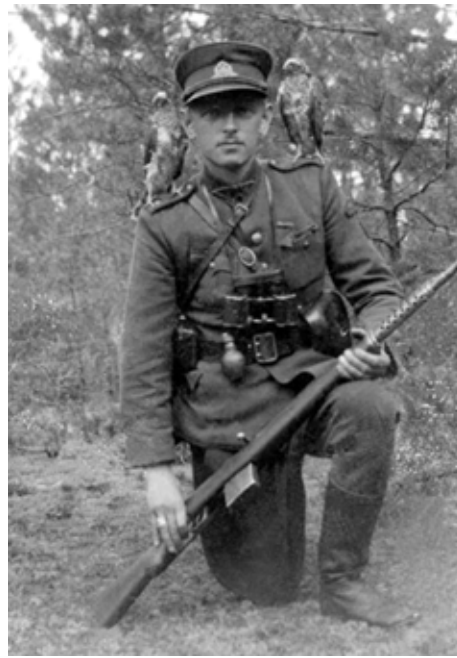
A. Ramanauskas-Vanagas, pedagogas, žurnalistas, karininkas, partizaninio judėjimo dalyvis, generolas