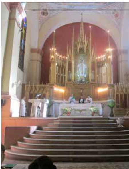
Camaguey šventovės altorius

Vienas kurortas įrengtas buvusioje rusų kariuomenės