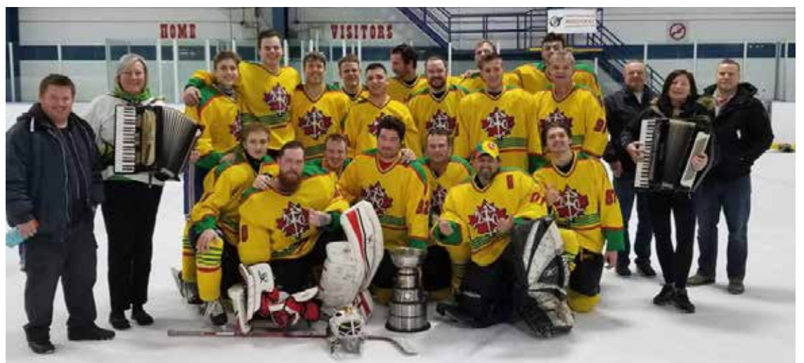
Po sekmadieninių baigminių kovų su latvių komanda ledo aikštėje Toronto lietuvių „Klevo lapų“ ledo ritulininkai, nugalėję varžovus rezultatu 5-2, laimėjo Baltijos taurę 2018 (Baltic Cup 2018)