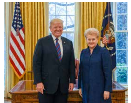
JAV prezidentas D.Trump ir LR prezidentė D.Grybauskaitė susitinka Vašingtone

Keturių valstybių vadovai priėmė bendrą politinę deklaraciją, kuria įtvirtino nepalaužiamą visų keturių valstybių įsi-