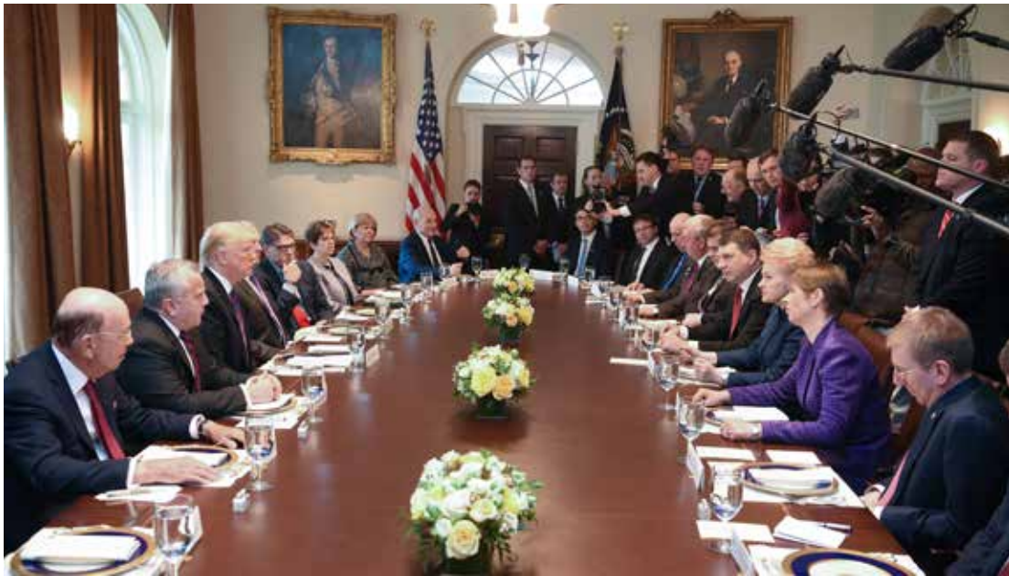
Susitikime Vašingtone JAV vyriausybės vadovai ir trijų Baltijos valstybių prezidentai