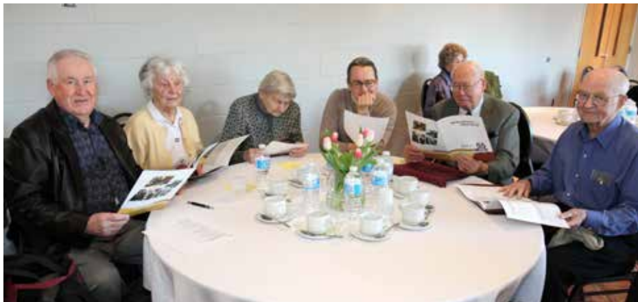
Priskėlimo kredito kooperatyvo nariai metiniame susirinkime domisi finansine ataskaita

bei elektroninės sąskaitų išsklaidinės. 2017 metais kooperatyvas įrengė prie įvažiavimo į aikštę skaitmeninę informacinę lentą, kurioje skelbiamos ne tik kooperatyvo, bet ir „Labdaros“ slaugos namų bei Priskėlimo parapijos naujienos. Pagrindiniame skyriuje buvo specialiai įrengta prieiga neįgaliesiems, kad iš slaugos namų ir automobilių stovėjimo aikštelės būtų lengviau nariams įeiti į skyrių.