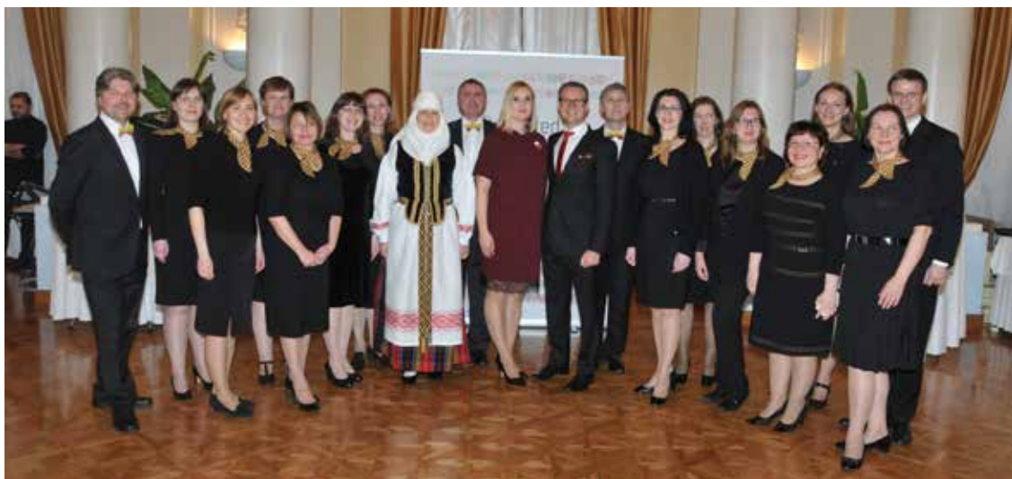
Atėnuose, Graikijos Karininkų rūmuose, vykusiame Lietuvos nepriklausomybės 100-mečio minėjime Lietuvos diplomatų choras visus sudomino lietuviškomis dainomis. Bendra rengėjų ir svečių nuotrauka