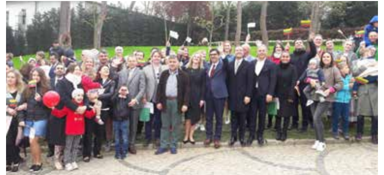
(Viršuje) LR ir Stambulo atstovai kerpa tradicinę juostą, dalyvaujant gausiam lietuvių ir turkų būriui (d., žemiau)