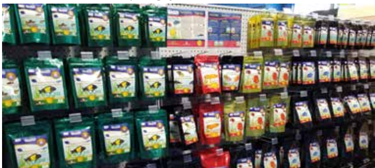
NorhFin produktai Finatics Aquariums parduotuvėje Mississaugoje

Fin prekinis ženklas buvo užregistruotas 2011 m. rugsėjo mėnesį. Po to pradėjome kurti savo gaminius. 2013 m. NorthFin pirmą kartą dalyvavo National Pet Industry Show (PIJAC) Toronte. Po kelerių metų mūsų gaminius jau platino keturi didžiausi Kanados daugmeninės prekybos platinotojai – sakė NorthFin savininkas.