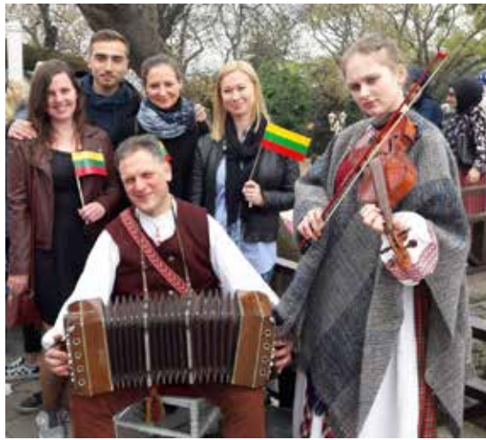
Atidarymo iškilmeje parke: (k.) koncertuoja „Raskilos“ ansamblis (Lietuva)