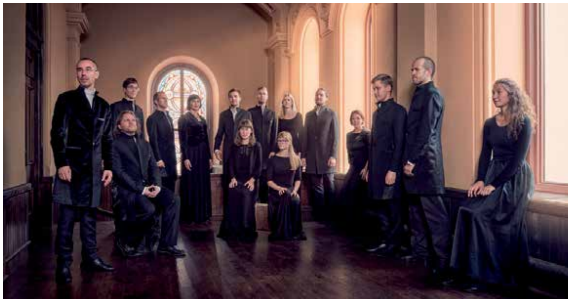
“Vox Clamantis” - the early and contemporary music vocal ensemble from Estonia