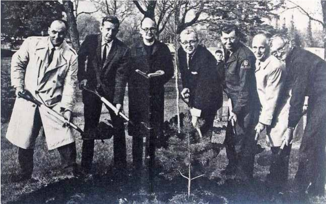
The planting of the Baltic Circle in May 1967. Participants' names are unknown.

Heritage conservation in Canada is mostly concerned with monumental buildings, nationally-known leaders and special character neighbourhoods. The more modest structures built by immigrant communities, such as churches and cultural halls, often do not receive the same recognition, as the properties are eventually sold to new owners and the original connection to the former community is lost. In Winnipeg, the Lithuanian community erected and worshipped in St. Casimir's Church. After the death of its pastor, it was closed and sold. Similarly, the much older Lithuania Club building is now owned by an Asian faith-based institution. Other sites which were built by Lithuanian immigrants at the beginning of the 20 th century – businesses or meeting places – are not recorded as places of cultural significance.