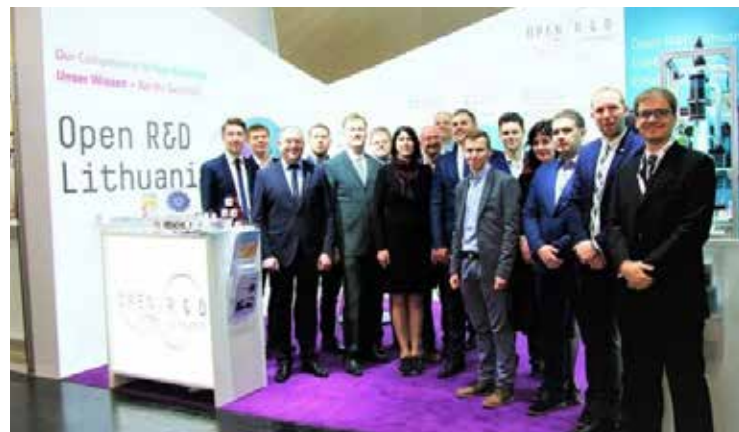
Lietuvos delegacija dalyvauja pasaulinėje pramonės technologijų parodoje „Hannover Messe“

sensorių, GPS sekimo įrenginį bei temperatūrinį sensorių. Fizinių ir technologijos mokslų centras supažindina su elektrinių takelių gamybos būdu, panaudojant lazerines ir chemines technologijas ant polimerų ir stiklo. Ši technologija plačiai naudojama elektronikos pramonėje ir sulaukė ypač didelio lankytojų dėmesio. Kitos pristato-