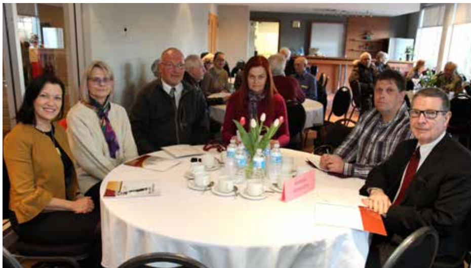
Susirinkimo svečiai - „Paramos“ ir „Talkos“ (Hamilton) kredito kooperatyvų atstovai

Gen. direktorė L. Moroz savo pranešime patvirtino, kad nuo 2018 m. sausio 1 d. narių indėlių draudimas padidėjo nuo $100,000 iki $250,000, o registruoti planai yra draudžiami neribotai. Taip pat įdiegtos naujos paslaugos – nuotolinis čekių įdėjimas, bekontaktės debito kortelės (nenaudojant PIN)