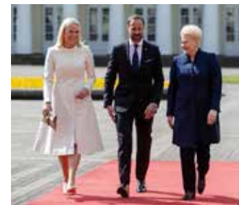
Lietuvos prezidentė D.Grybauskaitė sutinka (d.) Norvegijos kronprinca Haakon ir jo žmoną kronprincesę Mette-Marit (k.)

Teisingumo ministerija parengė pataisas, kurios leistų užsieniečiams Lietuvoje steigti partijas, palengvintų sąlygas tapti jų nariais. Pataisos parengtos po Europos komisijos pastabų, kad Lietuvoje esama padėtis nesuderinama su Europos sąjungos teise. Dabar norėdami stoti į partiją Lietuvoje gyvenantys kitų ES šalių piliečiai turi be pertraukos pragyventi Lietuvoje pen-