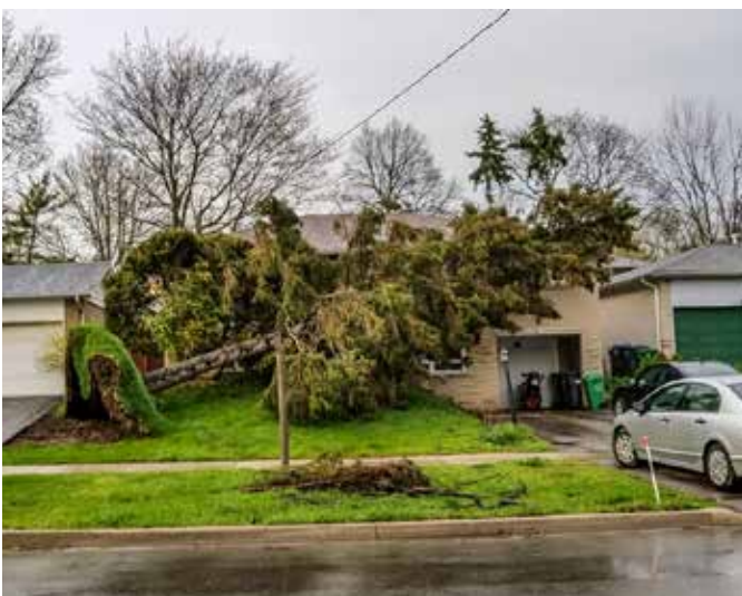
Audros išversta eglė Mississaugoje, Credit Woodlands rajone

Gegužės 4-ąją dieną netikėta pavasario audra nusiaubė pietinę ir centrinę Ontario provincijos dalį. Griaustinis, vėjo gūšiai iki 110 km/val. ardė namų stogus, griovė medžius ir stulpus, palikdami 160,000 gyventojų be elektros. Pearson oro uoste dėl stipraus vėjo buvo atidėti skrydžiai; Toronto gatves ir šaligatvius užtvėrė nulaužtos medžių šakos, nuplėšti reklaminiai skydai ir kitokios nuolaužos. Patirta ir didesnių nelaimių. Miltone medis užgriuvo du darbininkus, juos mirtinai sužalojo. Hamiltone, vėjui numetus ant žemės elektros laidus, žuvo vienas gyventojas.