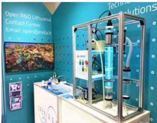
Jungtinis stendas, skirtas Lietuvos mokslininkų naujovėms

Šioje parodoje sukurtas technologijas, perspektyviausius išradimus ir teikiamas paslaugas verslui pristato aktyviausiai su verslu dirbančios net 9 Lietuvos mokslo įstaigos jungtiniame Lietuvos stende. Kauno technologijos universitetas parodoje pristato keletą naujovių: pažangios oksidacijos kompleksinę nuotekų valymo technologiją, kuri skirta sunkiai skaidomiems organiniams teršalams šalinti, taip pat kartu su verslininkais sukurtą ultragarsinį parkingo