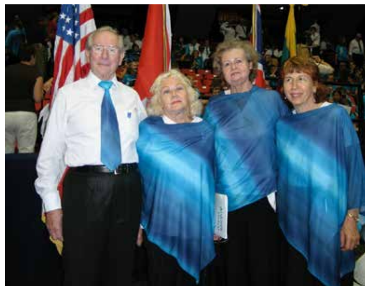
"Pašvaistės" choro likučio "narsuoliai" Š. Amerikos lietuvių VIII dainų šventėje Čikagoje (2006)