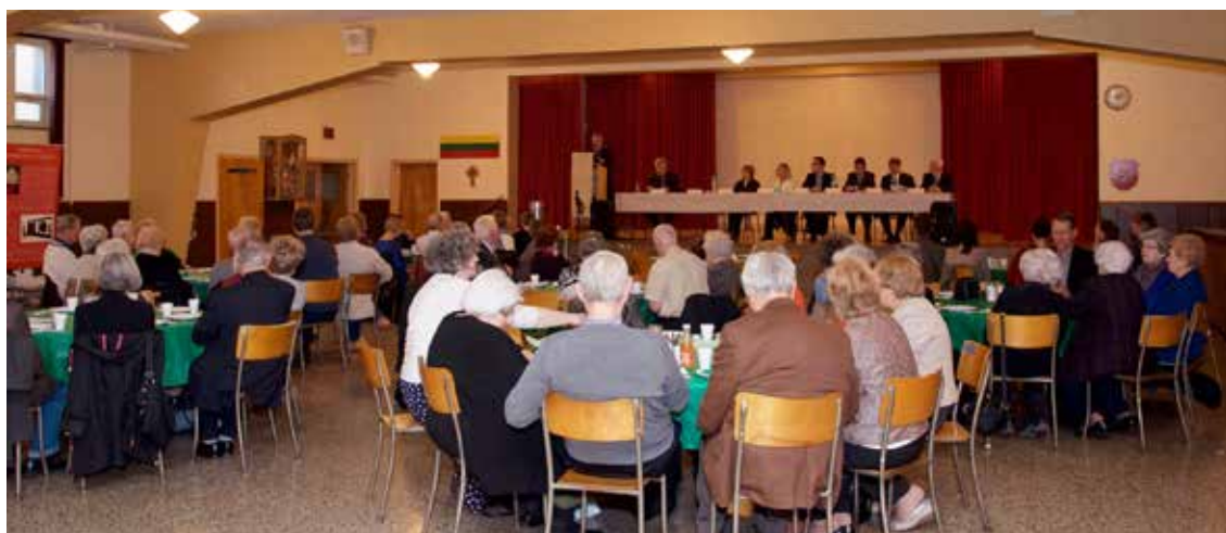
„Lito“ valdyba, nariai ir svečiai susirinkime 2018 m. balandžio 22 d.