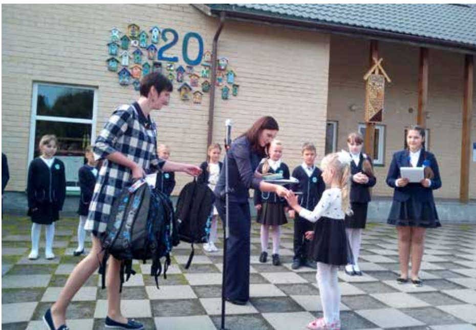
„Globos“ atstovai visada laukiami mokyklose

Lietuvos vaikų šalpos fondo „Globa“ reikalų vedėja, Etninės kultūros globos tarybos narė, „Vilnijos“ draugijos pirmininko pavaduotoja