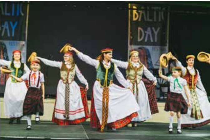
Portlaoise lietuvių bendruomenės šokių grupė "Raskila" sveikina dalyvius su "Kepurine"