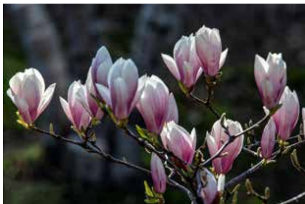
Vėlyvo pavasario vaizdai: (viršuje) žydi japoniškos vyšnios Toronto High parke; žemiau (k.): ir aš turiu savo namelį..., (d.) neilgai savo grožiu mus džiugina magnolijų žiedai K.Poškaus (Vasaga) ntrs.