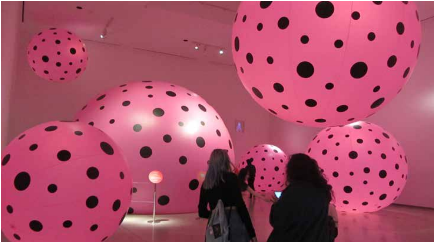
(k.) Dideliais taškais išmarginti paviršiai - Kusamos stiliaus ženklas; (d.) Neįprastos formos skulptūra