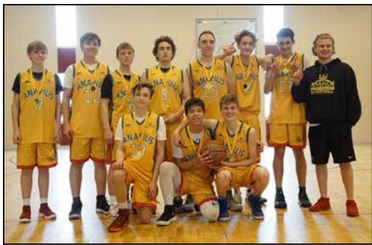
Berniukų iki 16 m. amžiaus grupės komanda – aukso medalių laimėtoja