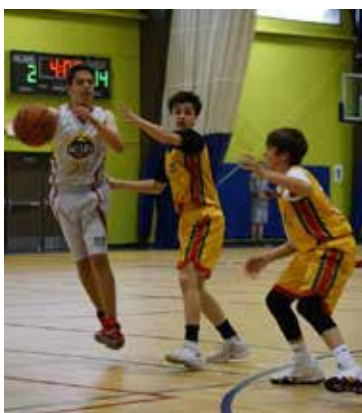
Varžosi Anapilio ir "Aušros" berniukų iki 14 m. komandos