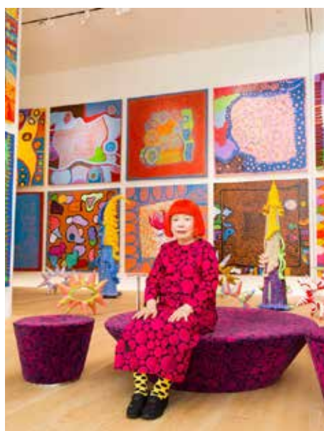
(d.) Japonijos dailininkė Yayoi Kusama; (k.) Veidrodžių kaleidoskopas