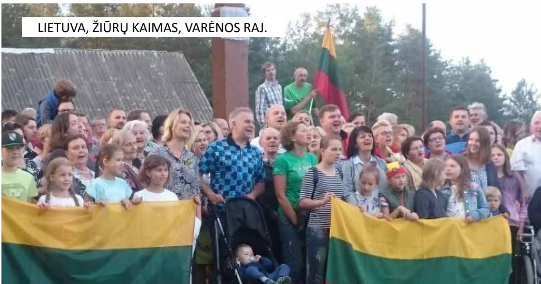
LIETUVA, ŽIŪRŲ KAIMAS, VARĖNOS RAJ.

Liepos 6-ąją Vasagos gyventojai ir poilsiautojai susirinko kartu ir giedodami Tautiška giesmė paminėjo Valstybės dieną ir jos nepriklausomybės atkūrimo 100-metį