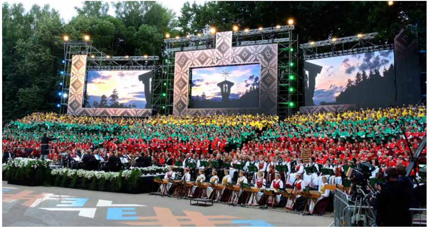
(K.) Dainų šventės ženklas Vilniaus katedros aikštėje; (d.) Dainų dienos Kaune atlikėjai