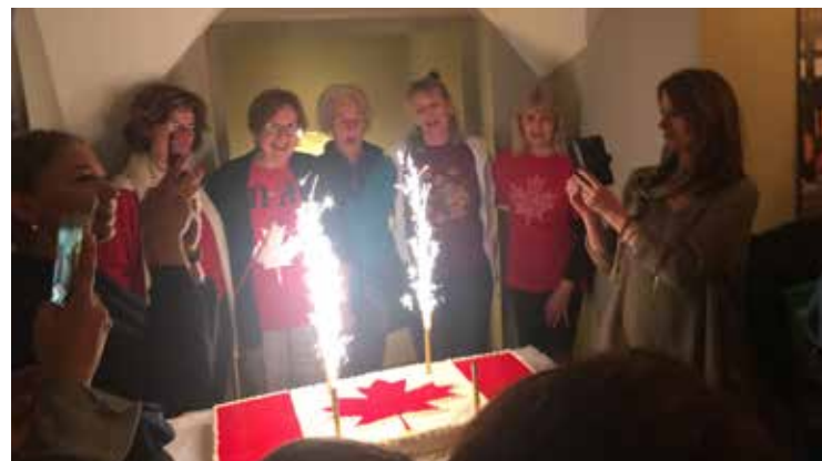
Kanados gimtadienis buvo švenčiamas ir Vilniuje

palydėti į rudeniškai apsiniaukusių dangų kylančius balionus, ir šventė tęsėsi toliau. Susitikimai, pokalbiai vyko palapinėse prie stendų ar albumų, leidinių, vaišių stalų.