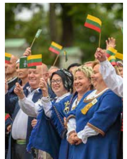
„Laisvės kario“ skulptūra Kaune, Santakos parke; (d.) šventės dalyviai