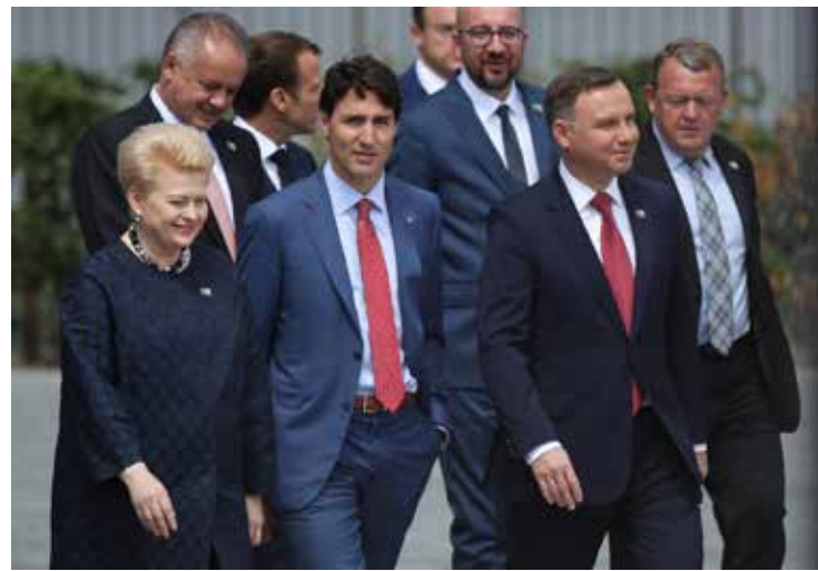
Iš kairės: Lietuvos prezidentė Dalia Grybauskaitė, Kanados premjeras Justin Trudeau, Lenkijos prezidentas Andrzej Duda su kitais NATO susitikimo dalyviais Briuselyje

mokymo misijai Irake, o 250 Kanados karių bus nusiųsti į Mali. Liepos 10 d. Rygoje J. Trudeau teigė, kad tiki NATO stiprybe, vienybe ir solidarumu, tačiau neturi abejonių, kad reikės daugiau investuoti į gynybos išlaidas. Kanada taip pat paskirs $26.7 mln. dolerių, kad pagerintų moterų ir mergaičių pragyvenimo šaltinius Irake ir Sirijoje. Helsinkyje J.Trudeau pabrėžė, kad Kanada tebėra tvirtai nusiteikusi prieš daugybę Rusijos veiksmų, įskaitant Krymo aneksiją, paramą Sirijos prezidentui Bashar Al Assad bei sukilėliams Rytų Ukrainoje, taip pat nuodingųjų medžiagų panaudojimą D.Britanijoje.