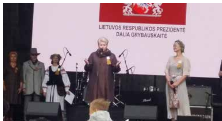
Lietuvos prezidentė D.Grybauskaitė pradeda iškilmes

Trumpai akimirka visi buvo pakviesti į sulėktuves (Flashmob) drauge nusifilmuoti,