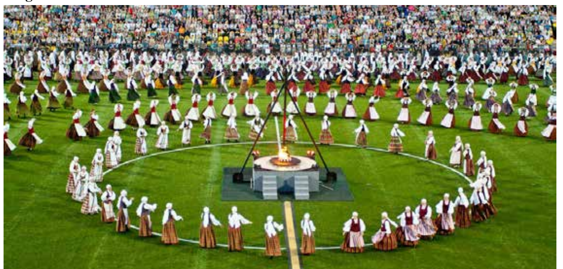
Šokių diena „Saulės rato ritimai“