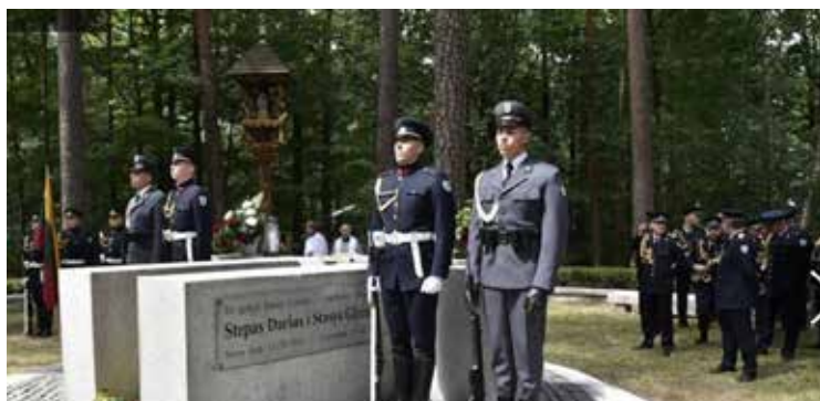
Dariaus ir Girėno skrydžio minėjimas Pščelnike, Lenkijoje

Lenkijoje, Pščelniko miške, netoli Myslibužo, surengtame minėjime dalyvavo Lietuvos užsienio rei-