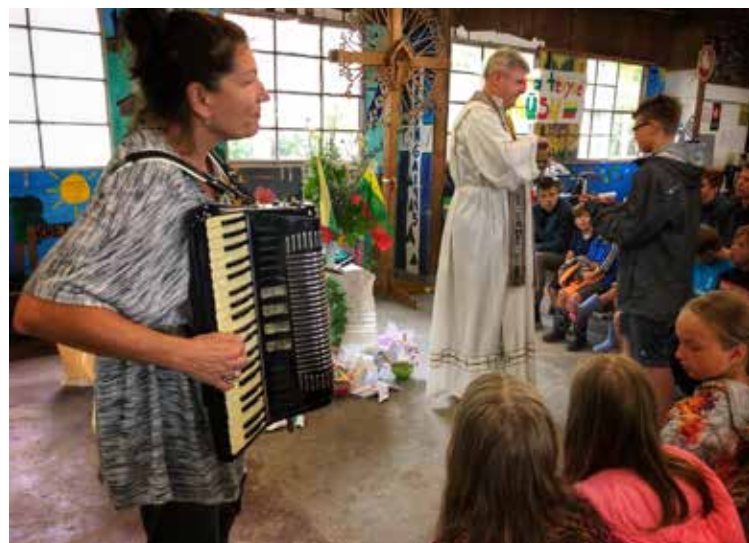
Mišios „Kretingos“ vasaros stovykloje