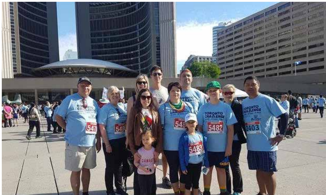
Toronto savivaldybės aikštėje lietuviai – „Toronto Challenge“ eitynių dalyviai. Šiame eitynių renginyje, kurios vyko birželio mėn., dalyvavo 12 mūsų bendruomenės atstovų, norėjusių