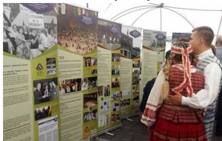
Kanados lietuvių istorija, išdėstyta patraukliuose plakatuose, sulaukė susidomėjimo