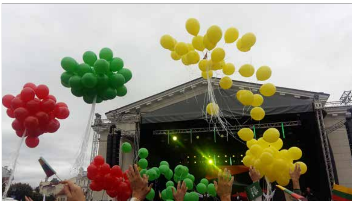
Pasaulio lietuvių ir Lietuvos tautinių mažumų dienos atidarymo iškilmė Vilniuje, Rotušės aikštėje

Renginiu „Šimtas Lietuvos veidų – sujunkime Lietuvą“ Pasaulio lietuvių bendruomenė ir Tautinių mažumų departamentas prie Lietuvos vyriausybės paskatino susitikti Vilniuje viso pasaulio lietuvius ir čia gyvenančias tautines bendruomenes.