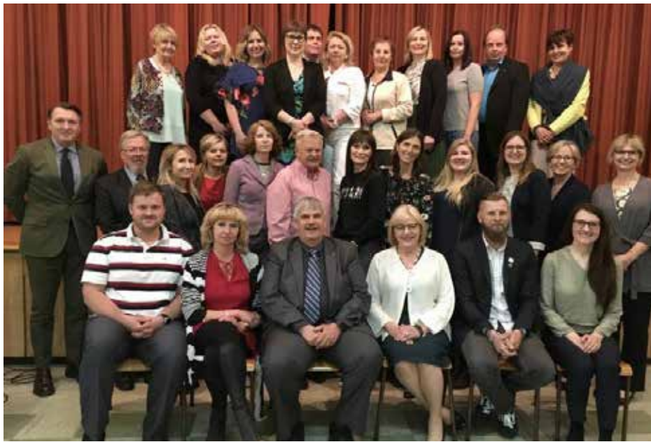
KLB suvažiavimo dalyviai ir LR ambasados Kanadoje atstovai po susitikimo Montrealyje

Mokyklų atstovų susirinkime aptarėme skirtingų mokyklų – didesnių ir mažesnių – veiklą ir poreikius bei pasidalinome įvairiais pasiūlymais, kaip pakviesti į mokyklas daugiau jaunųjų lietuvių, sudominti juos lietuvių kalbos mokymusi bei skatinti bendruomeniškumo principus. Buvo