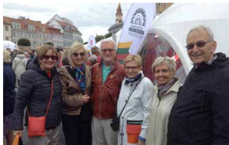
Toronto lietuviai Rotušės aikštėje, Vilniuje