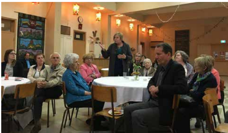
Suvažiavimo metu vyko daug pokalbių apie lietuviškos veiklos kasdienybę ir planus