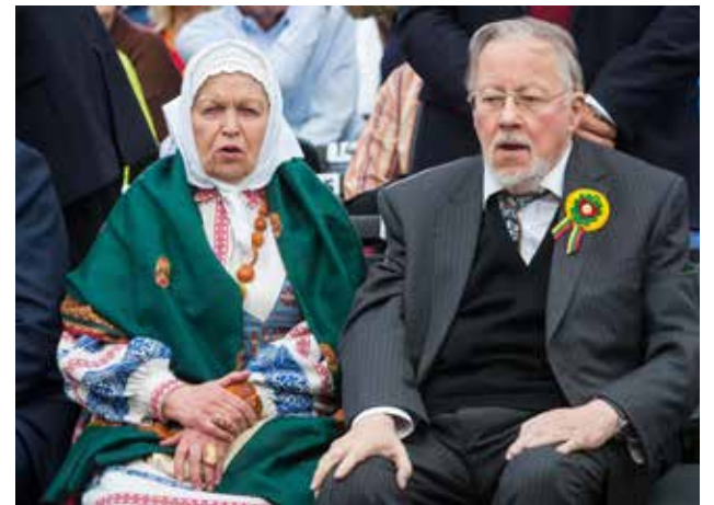
(K.) Su Valstybės diena sveikina Lietuvos prezidentė D.Grybauskaitė; (d.) G. ir V. Landsbergiai