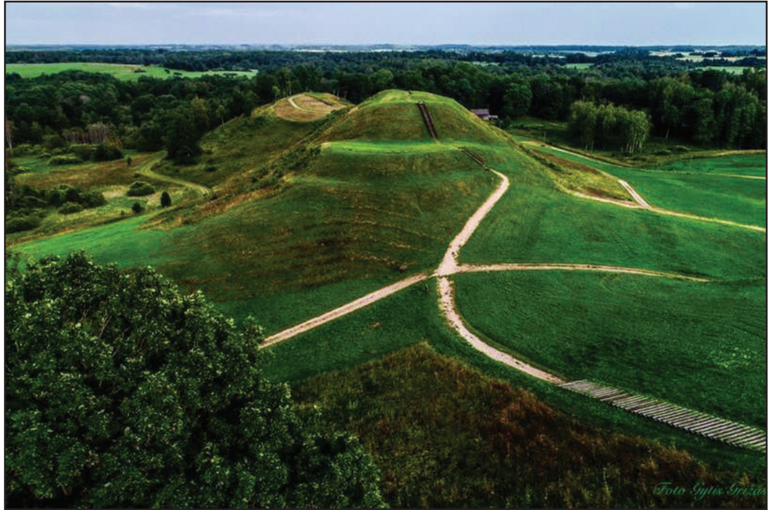
Medvegalio piliakalnis iš paukščio skrydžio