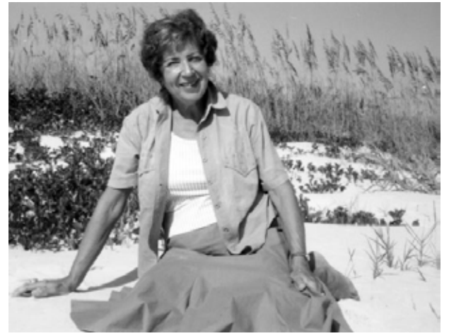
Rašytoja, dramaturgė, poetė Birutė Pūkelevičiūtė (1923–2007)

Taip, daugelis to meto kritikų tvirtino eiles pasirodžius per anksti, kai kuriems užkliuvo poetės asmeninio gyvenimo pasirinkimai. Gana uždaroje tautinėje bendruomenėje gyvavo konservatyvi katalikiškoji pasaulėžiūra, vengianti kalbėti apie asmeniškąs potyrius, netelpančius į viešajame gyvenime ir kūryboje „leistinas“ temas. Buvo priimta apie jausmus ir kūniškumą kalbėti tik abstrakčiai, romantizuotai arba išaukštintai, maironiškai. Jaunoji poetė šių tradicijų nepaisė, savo eilėmis ji nupiešė gaivališką moters, kartu su pavasariu nesustabdomai pabundančios natūraliems troškimams – meilei ir motinystei, kaip pačios gamtos užkoduotai jos paskirčiai, paveikslą. Sodrūs gamtos vaizdai, metaforos, talpi jausmui ir vaizdui netaisyklingos eilėdaros