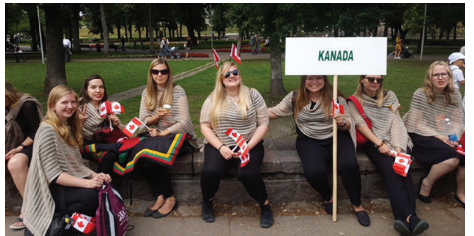
Toronto jaunimo choro dalyvės poilsiauja prieš eitynes