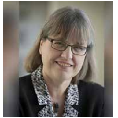
Mokslininkė Donna Strickland, 2018 m. Nobelio premijos laureatė fizikos srityje

Donna Strickland, Waterloo (ON) universiteto profesorė, paskelbta šių metų Nobelio premijos laureate fizikos srityje. Švedijos Karališkoji mokslų akademija pranešė, kad šiemetinė fizikams skirtą premiją pasidalija trys mokslininkai. Pusė premijos sumos atitenka Arthur Ashkin, 96, (New Jersey, JAV), kitą pusę pasidalija Donna Strickland ir Gerard Mourou. D.Strickland, 59, ir Mourou, 74, atrado itin trumpus ir stiprius lazerio pulsavimus, kurie plačiai pritaikomi pramonėje ir medicinoje. Kanadietė D.Strickland – pirmoji moteris