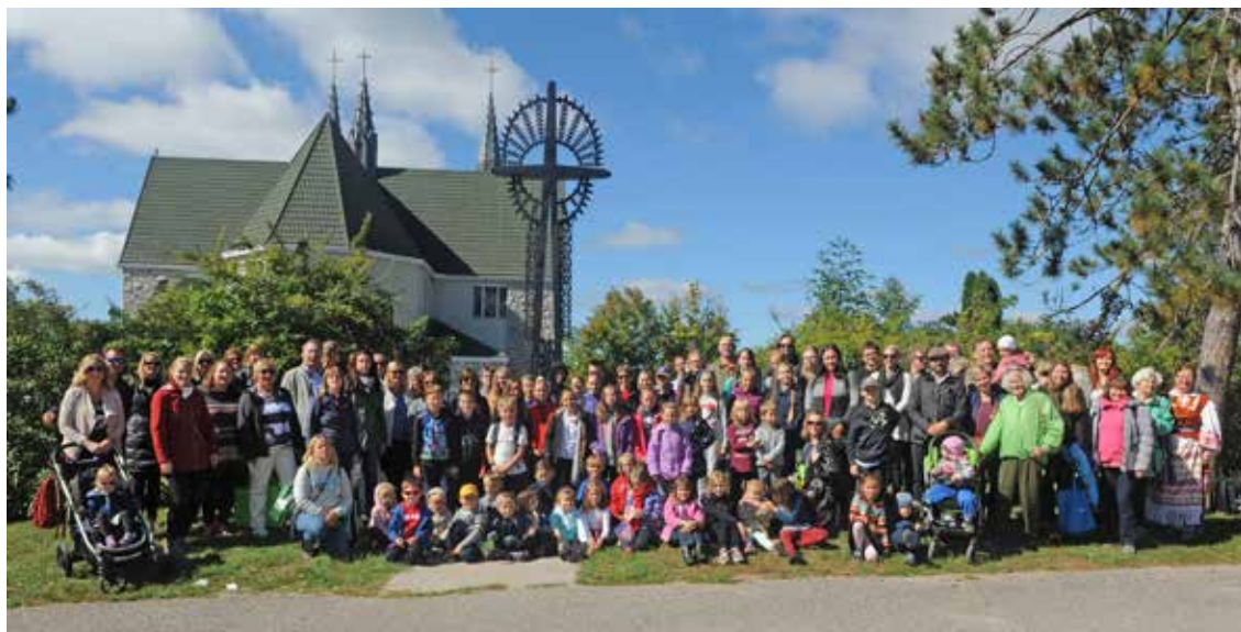
Toronto ir Hamiltono mokyklų mokiniai su mokytojais ir tėveliais prie lietuvių pastatyto kryžiaus