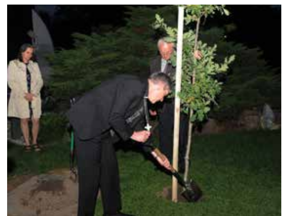
Kun.P.Ažubalio atminimui sodinamas ažuoliukas