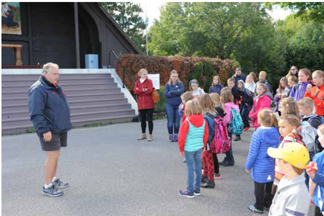
Toronto ir Hamiltono lietuvių mokyklų mokiniai ir jų tėveliai klausosi pasakojimo apie Midlande apsilankiusį šventuoju paskelbtą popiežių Joną Paulių II-ąjį