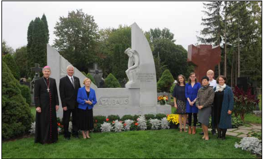
Šv. Jono lietuvių kapinėse prie kun. P.Ažubalio kapo artimieji ir svečiai, arkivysk. L.Virbalas (1 iš.k.)