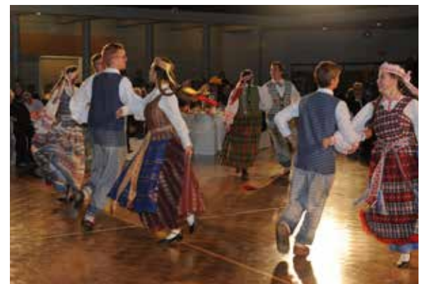
Šoka Toronto „Gintaras“