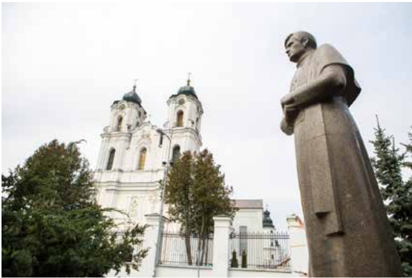
Paminklas vysk. A.Baranauskui Seinuose

Rugsėjo 1-2 d.d. vyko iškilmingas Seinų vyskupijos įsteigimo 200 metų jubiliejaus minėjimas. Pačiuose Seinuose vykusioje dviejų dienų programoje dalyvavo būrys svečių iš įvairių Lenkijos bei Lietuvos vietų.