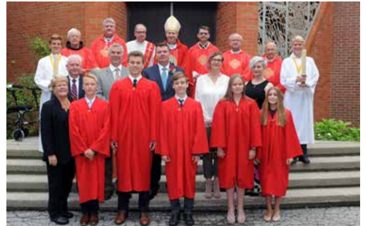
Priėmusieji Sutvirtinimo sakramentą su dvasininkais ir tėvais