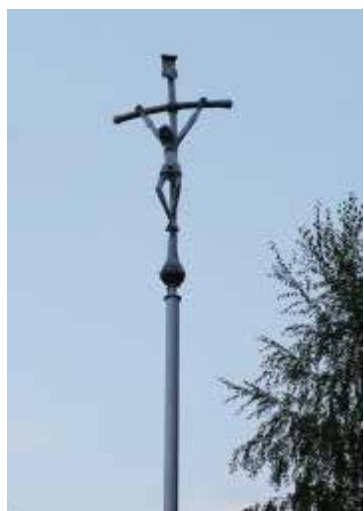
Vilniaus arkivysk. G.Grušas šventina būsimos Šv. Jono Pauliaus II šventovės vietą ir ją žymintį kryžių