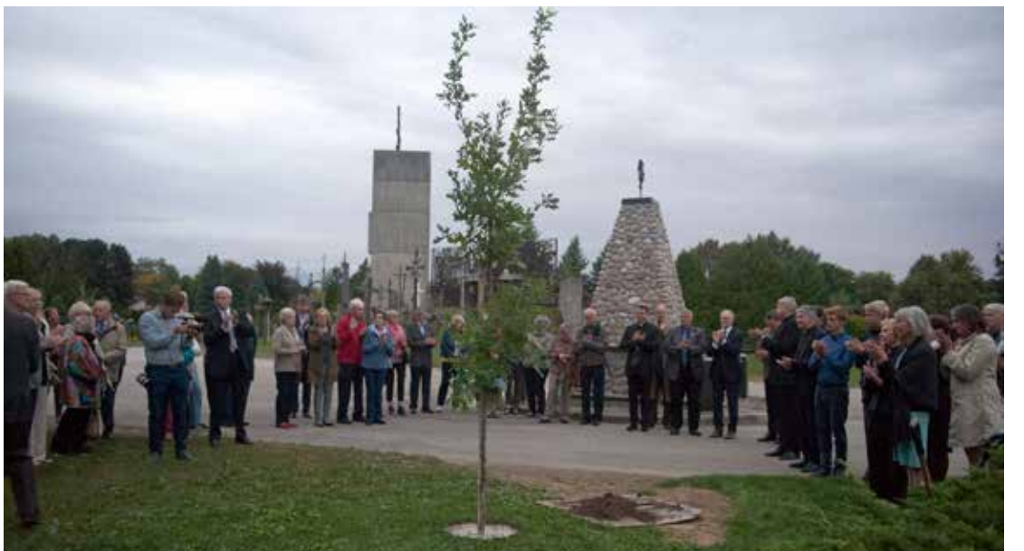
Prie pasodinto medelio renginio dalyviai