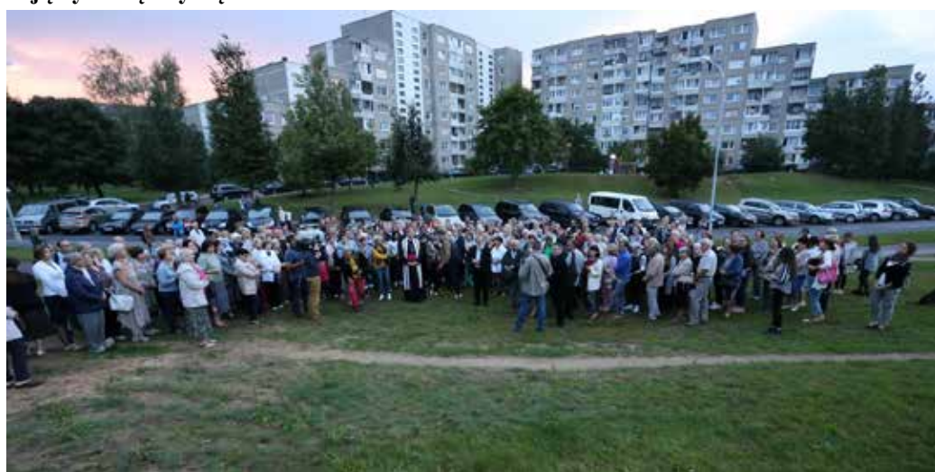
Iškilmėje būsimieji Šv. Jono Pauliaus parapijos parapijiečiai