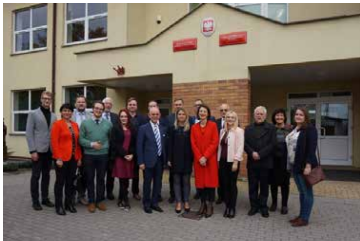
Svečiai iš Vilniaus prie Kovo 11-osios licėjaus Punkske