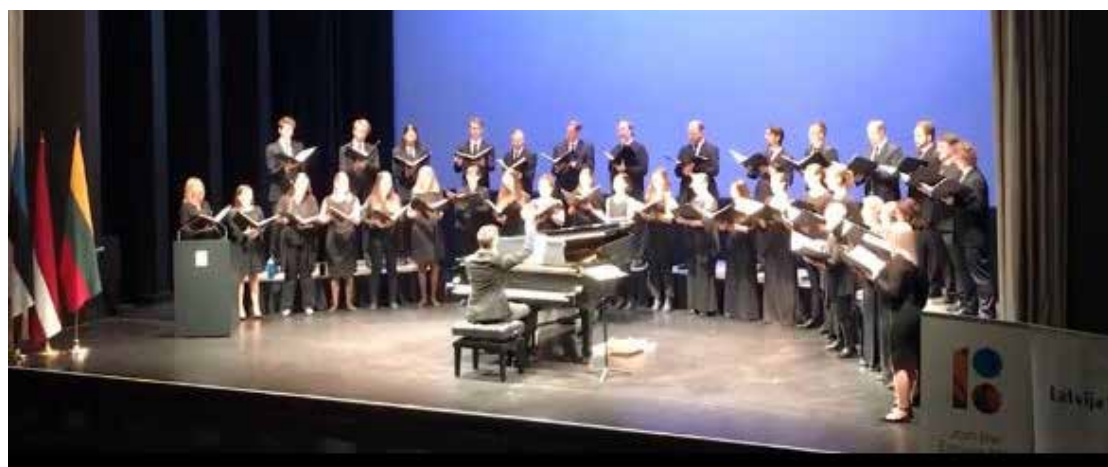
Otavos kamerinis choras („Capital Chamber choir“) dainuoja V. Kernagio dainą „Baltas paukštis“