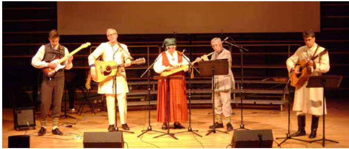
Groja Montrealio latvių ansamblis "Tervetes Trubadūri"