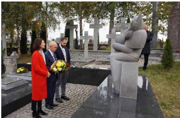
PLB ir Lietuvos seimo bendros komisijos vadovai deda gėles prie vysk. A.Baranausko paminklo

„Nors tarpusavio supratimo memorandumai ir nėra teisiškai įpareigojantys dokumentai bei neturi jokių teisinių pasekmių juos pasirašiusiems pusėms, mes labai džiaugėmės, kad po gana ilgo bei sudėtingo kelio šis dokumentas pasirašytas, ir jis atkartoja PLB XVI Seime priimtos direktyvos dvasią! PLB išaugo bei subrendo pradėti platesnį, tarptautinį bendradarbiavimą. Mums didelė garbė būti savotiškais pradininkais, sakyčiau, švyturiais šiame diasporų tarptautinio bendradarbiavimo kelyje. Lietuvai kaip niekada reikalingi patikimi partneriai ir drau-