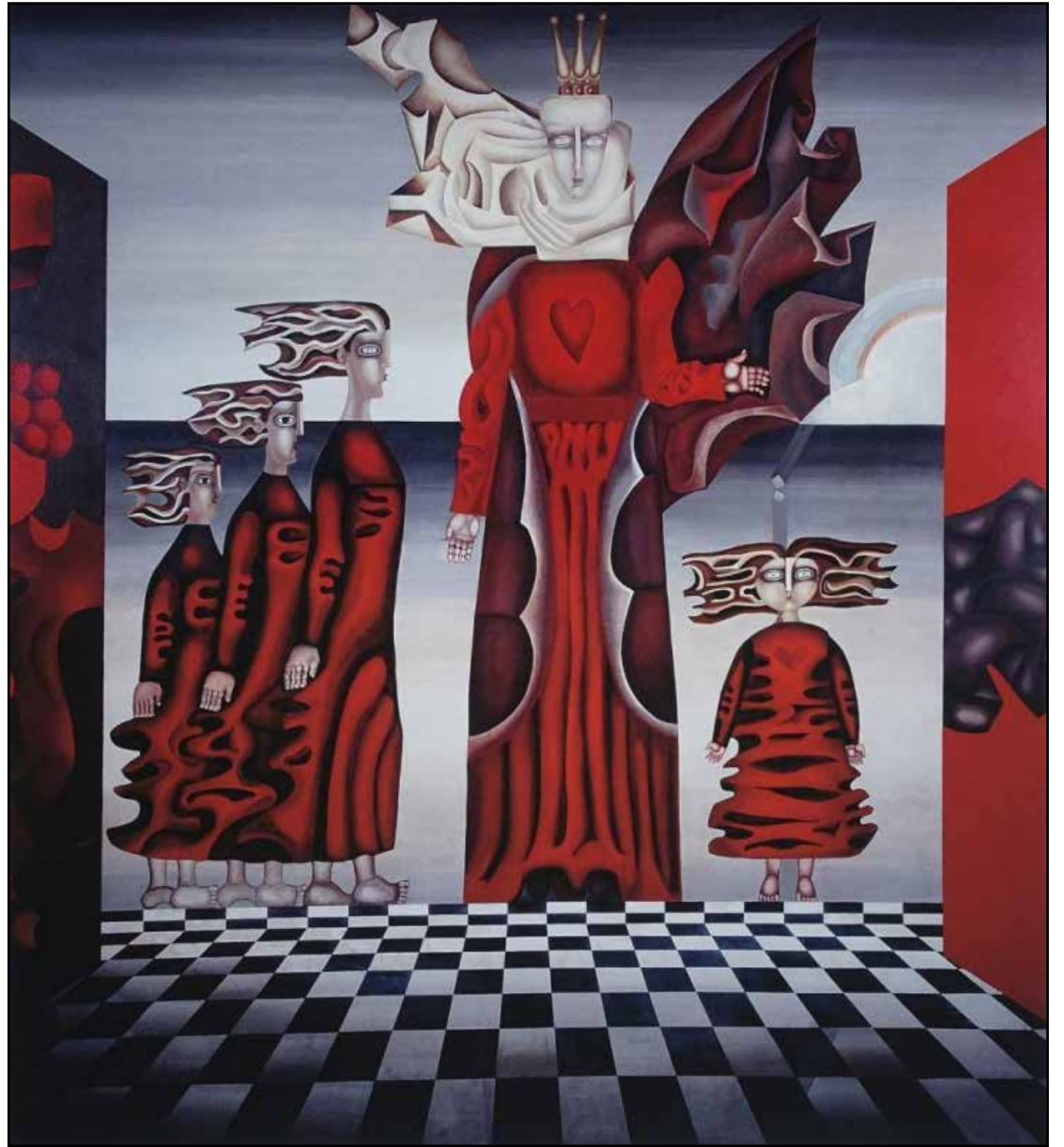
Eglė – žalčių karalienė. Dail. B.Žilytės ir A.Steponavičiaus sienų tapyba buvusioje sanatorijoje „Pušėlė“ Valkininkuose (atkurta skaitmeniniu būdu)