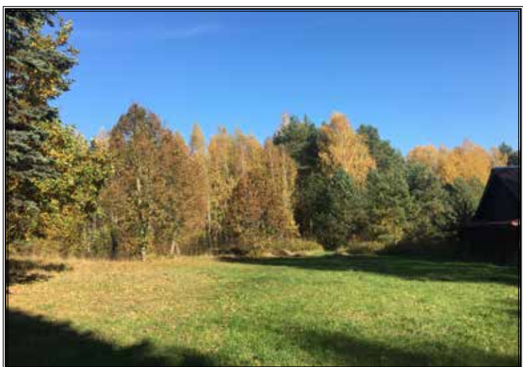
Ruduo Lietuvoje. (Vilnius)