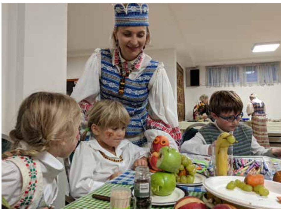
Derliaus dovanos tinka ir maistui, ir kūrybai