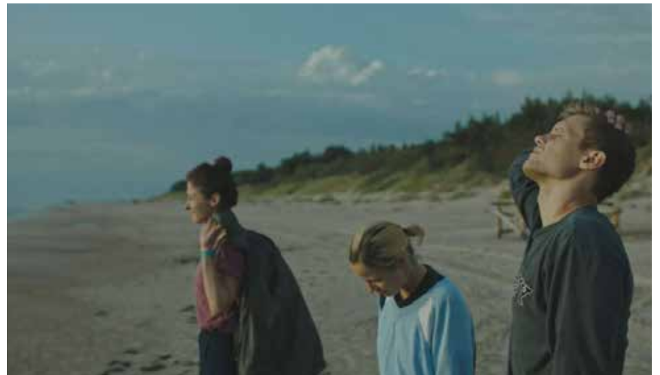
Kadras iš kino filmo "Summer Survivors" ( Išgyventi vasarą)