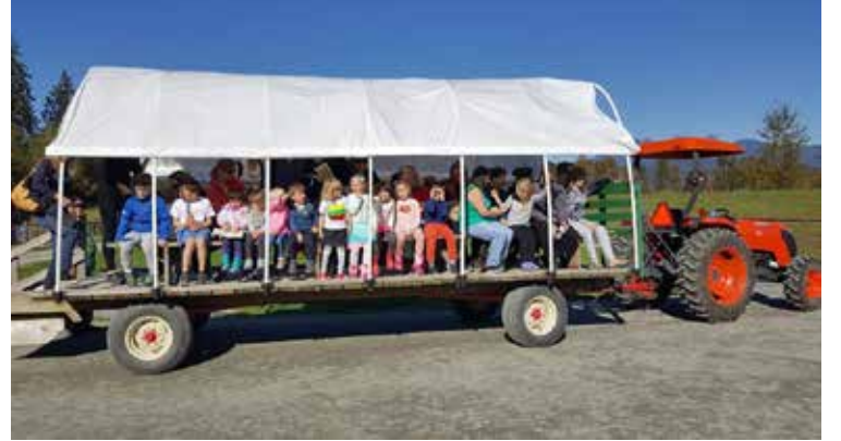
Įsimintinas pasivažinėjimas traktoriaus priekaboje