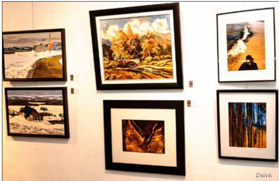
Parodoje G. Vazalinsko ir D. Blynas kūriniai