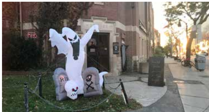
„Halloween“ papuošimai prie Lietuvių Namų