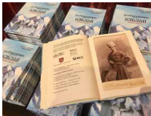
A. Vienuolio knyga Užkeiktieji vienuoliai , išspausdinta kartvelų kalba

Antanas Vienuolis-Žukauskas (1882-1957) – Lietuvos rašytojas prozininkas, farmacininkas, dramaturgas, muziejininkas, visuomenininkas. Bėgdamas nuo caro valdžios persekiojimų,