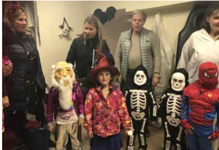
Nuotraukoje „Halloween“ šventės Lietuvių Namuose organizatoriai ir lankytojai

• „Halloween“ dienos proga Lietuvių Namai keturioms dienoms buvo paversti vaiduoklių būstine. Ją aplankė nemažai Maironio lietuvių mokyklos moksleivių, jų tėvelių ir kitų lankytojų.