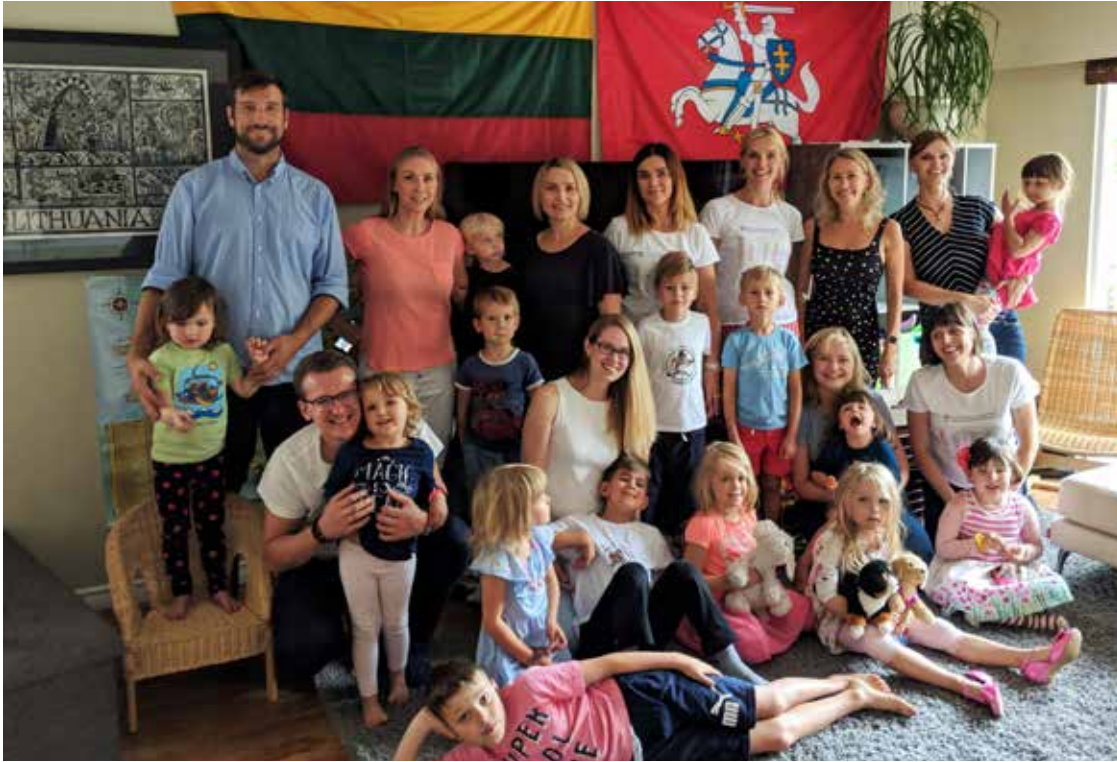
Naujiems mokykliniams metams pasirengę mažieji, jų tėveliai ir mokytojai