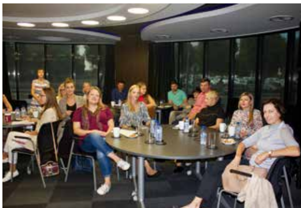
Kipro lietuviai steigiamajame susirinkime