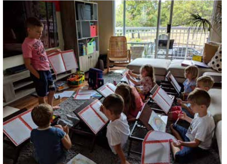
Pamokos jau prasidėjo

ir pramogų – važinėjomės po laukus traktoriais, klaidžiojome po kukurūzų labirintą, lankėme žinomus herojus „Pasakų miške“ bei vaišinėjomės suneštinėmis vaisėmis pačiame moliūgų lauke.