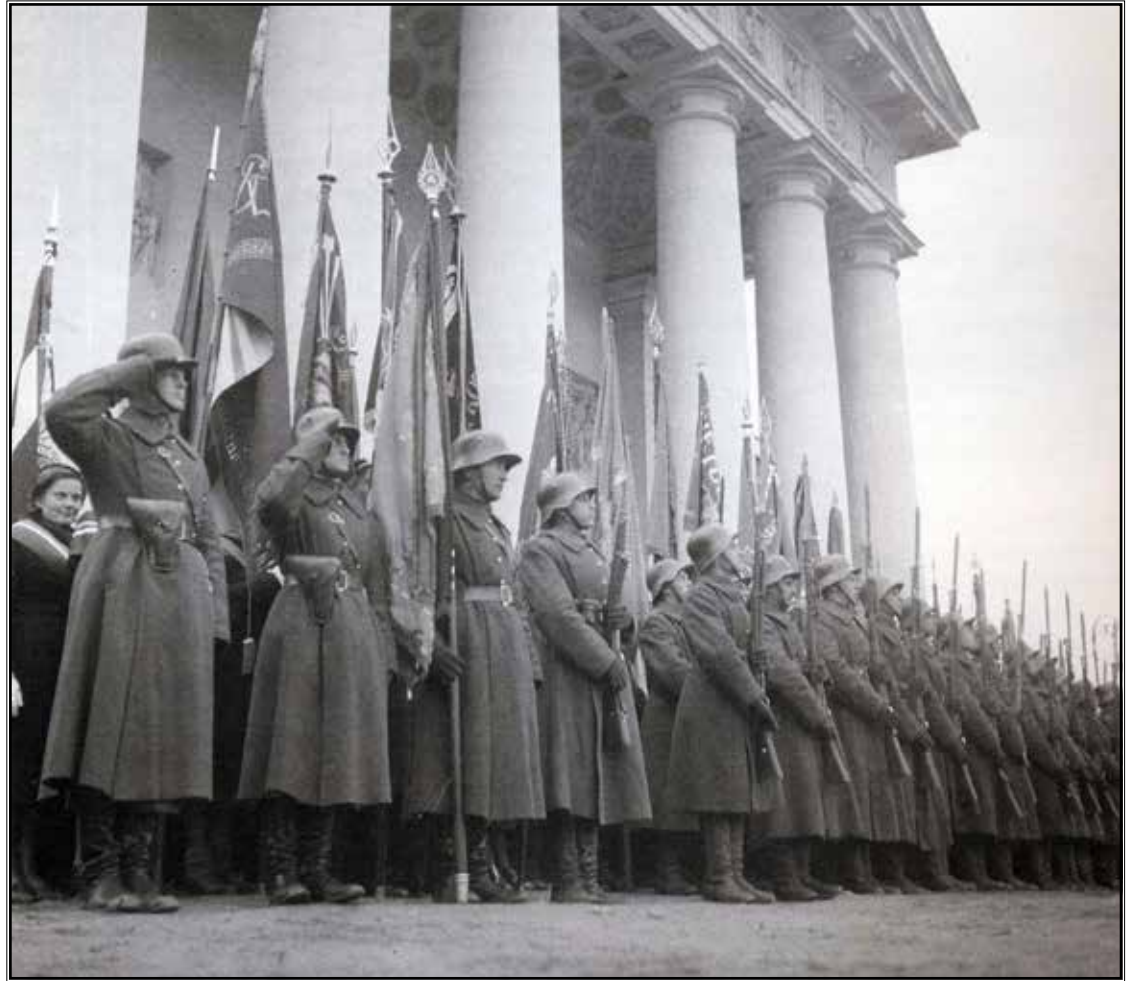
Arch. nuotraukoje – Lietuvos kariai 1939-aisiais metais prie Vilniaus Katedros

1918 m. lapkričio 23 d. tuometis Lietuvos vyriausybės ministeris pirmininkas ir einantis krašto apsaugos ministerio pareigas prof. Augustinas Voldemaras pasirašė įsakymą Nr. 1