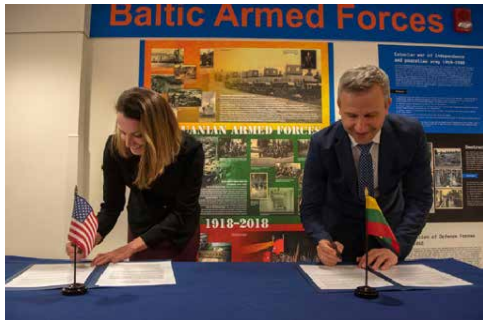
Pasirašomas ilgalaikis JAV ir Lietuvos URM tarpusavio bendradarbiavimo planas saugumo ir gynybos srityje