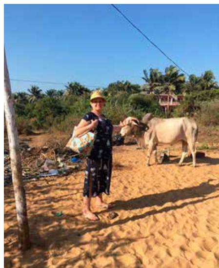
Šventos karvės vaikščioja visur – gatvėse, paplūdimiuose

Atspėti per kiek laiko nuvažiuosi numatytą atstumą – neįmanoma. Gali būti, kad 50 kilometrų gali važiuoti valandą, dvi, gal net tris – niekas nežino ir nespėlioja. Gatvėje – šaligatviai prasti, duobėti, nėra pėsčiųjų perėjų, šviesoforų, todėl pirmomis dienomis pereiti gatvę mums buvo tolygu iššūkiui. O vietinių