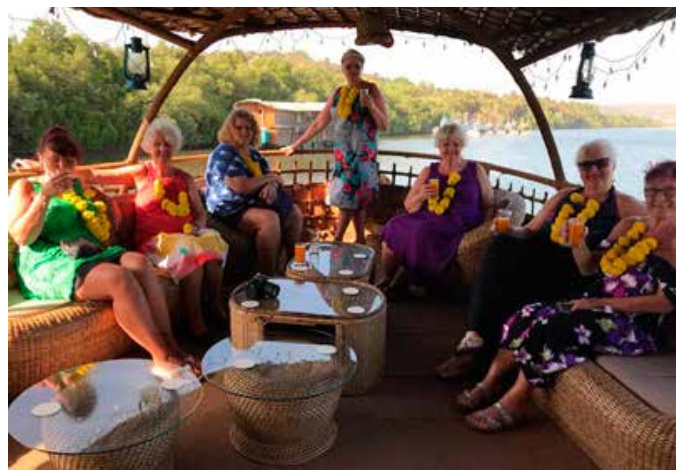
Dengtame laivo denyje jautėmės labai patogiai

Mums pačioms dabar sunku patikėti, kad plaukėme su šiuo laivu ir stebėjome upės pakraščiuose dumblyne besiraistančius krokodilus. O laivas, nors ir traškantis, bet