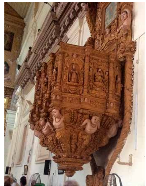
Jėzaus gimimo bazilika, statyta 1605 m.

ramybė – stebėtina. Chaotiškas eismas jiems – kasdienybė, vietiniai sugeba išlikti ramūs ir nesikarščiuodami kas keletą sekundžių spaudyti – „pyp“. Atrodė, kad svarbiausia automobiliuose – veikiantis signalas.