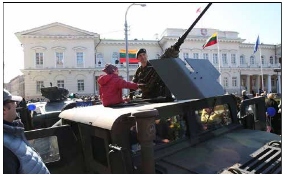
Lietuva mini savo 15 metų narystės NATO sukaktį

pastangos toliau vystyti savo nacionalinę gynybą“, pranešė JAV Gynybos departamentas. Dokumente Lietuvos krašto apsaugos ministerija įsipareigoja suteikti visą reikalingą paramą