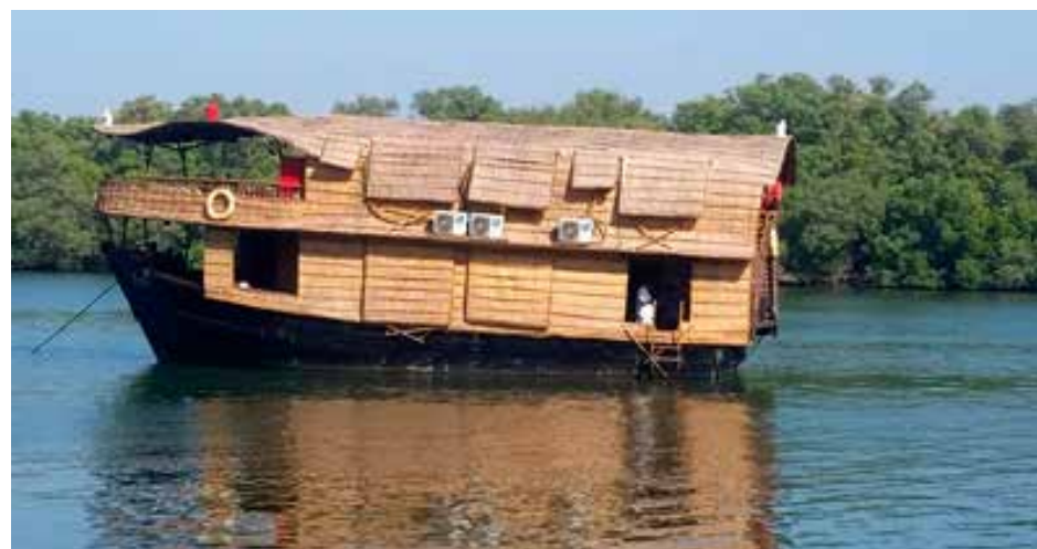
Neįprastas laivas, kuriuo plaukėme