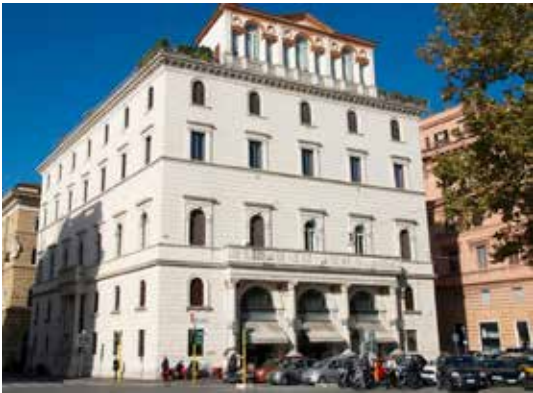
Naujoji ambasada istoriniuose Blumenstihl rūmuose ir (d.) prarastoji „Villa Lituania“

Beveik 9 mln. eurų vertės patalpos Lietuvai 2013 metais perleistos 99 metams neatlygintinai naudotis su galimybe 2112 metais šį laikotarpį pratęsti. Ambasada įsikūrė Italijos sostinės centre esančių „Blumenstihl“ rūmų ketvirtajame aukšte, 640 kv. m patalpose. Pastatas yra saugomas architektūros paminklas. Įžymaus italų architekto Luca Carimini XIX šimtmečio