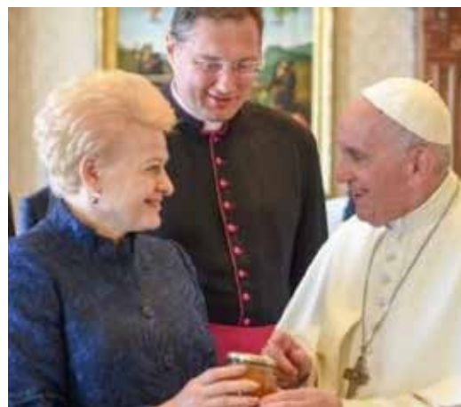
LR prezidentė popiežiui Pranciškui dovanoja medų iš savo bityno