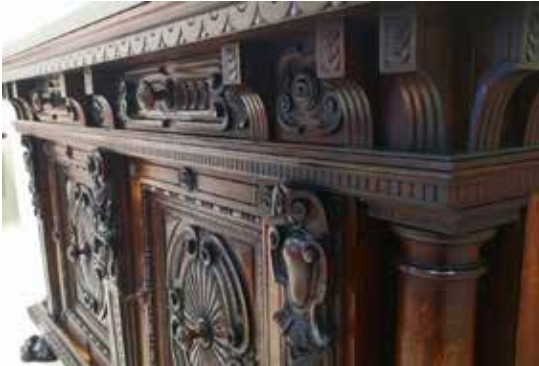
Naujoje ambasadoje yra baldų iš „Villa Lituania“