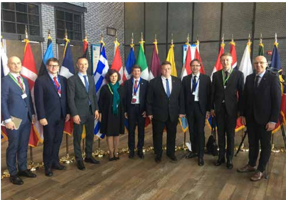
Lietuvos atstovai Vašingtone NATO 70-mečio minėjime

JAV karių tarnybai Lietuvoje. NATO 70-mečio ir Lietuvos narystės 15 metų sukaktys buvo paminėtos Šiauliuose (žr. 12 psl.), Palangoje, Klaipėdoje, Alytuje ir kituose Lietuvos miestuose. Inf.