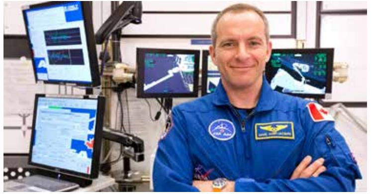
Kanados astronautas David Saint-Jacques

Kanadietis David Saint-Jacques balandžio 1 d. tapo ketvirtuoju kanadiečiu, sėkmingai vaikščiojusi erdvėje ir atlikusiu keletą užduočių kartu su NASA astronute Anne McClain. Jiedu grįžo į tarptautinę erdvės stotį, išbuvę "ekskursijoje" šešias su puse valandų. Vienintelis trukdis buvo garso aparatūros silpnumas – vaikščiojantiems astronautams ir kolegoms erdvėlaivio viduje buvo sunku girdėti vieni kitų