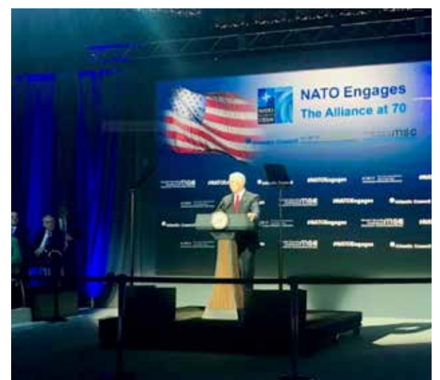
NATO 70-mečio minėjimas Vašingtone