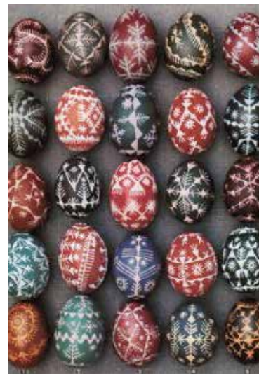
Velykiniai margučiai

Po trumpos oficialios dalies vyks paskaita ir riešinių mezgimo pamoka, kurią ves