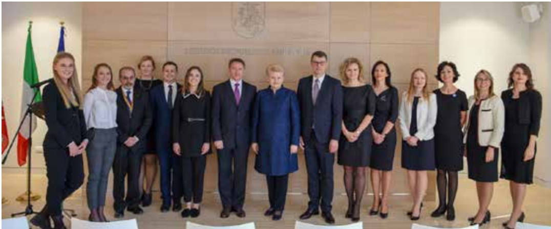
Atidarymo dieną D.Grybauskaitė (centre) su LR garbės konsulais Italijoje ir lietuvių bendruomenės atstovais