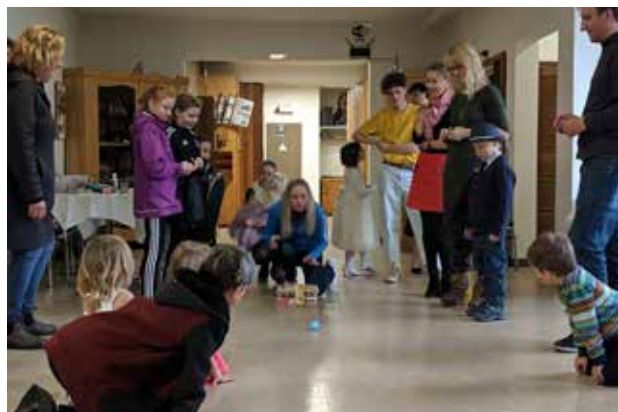
Kantriai kiaušinius margino mažieji; (d.) visi kartu – ir maži, ir suaugusieji ridena kiaušinius