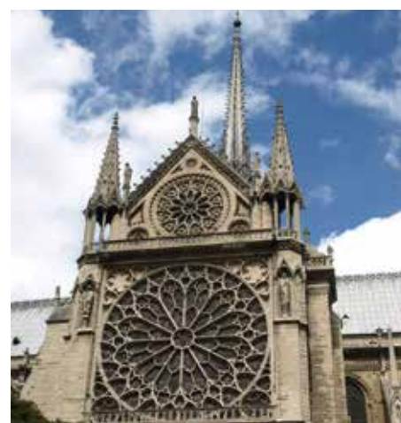
Prieš gaisrą: (iš k.) katedros bokštai; katedros skliautuose – vertingi vitražai

kinti. XIX šimtmečiuje karalius Louis Philippe užsakė katedros restauravimo darbus. Būtent tada pastatyta ir per gaisrą griuvusi katedros smailė. Gotikinių katedrų konstrukcijos ypač palankios gaisrams, nes pasižymi milžiniškomis, deguonies gausiomis pastogės erdvėmis, kurias laiko itin sausos medinės konstrukcijos. Nepaisant to, Dievo Motinos katedros išgyventas gaisras kartu yra gotikos architektų meistriškumo įrodymas.