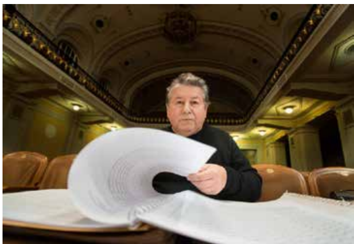
Muzikas Vilniaus filharmonijos salėje repeticijoje

styginių kvartetui (1978) – atskleidžia ypatingą kompozitoriaus jautrumą poetiniam žodžiui, panteistinei pasaulėvokai ir išskirtinę lietuviškos dvasios pajautą. Itin svarbi A. Šenderovo kūryboje buvo žydų kultūros tema. A. Šenderovo muzika nuolat skamba įvairiose Europos valstybėse, JAV, Kanadoje, Brazilijoje, Japonijoje, Pietų Afrikoje, Izraelyje, Australijoje, N. Zelandijoje, Pietų Korėjoje, Kinijoje ir kitur. 1994 metais už kūrinių „Mikalojaus Konstantino Čiurlionio eskizai“ įvertintas garbės diplomu tarptautiniame W. Lutosławski kompozicijos konkurse Kilyje (Švedijoje), 1996 m. kompozitorius buvo apdovanotas Lietuvos didžiojo kunigaikščio Gedimino ordinu (Riterio kryžiumi). 1997 m. jam paskirta Lietuvos valstybinė kultūros