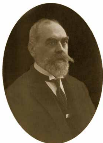
Juozas Naujalis 1869.IV.9 - 1934.IX.9

Ižymiojo lietuvių kompozitoriaus gimtinėje, Raudondvaryje, balandžio mėnesį vyko trys dideli renginiai, skirti 1869 metų balandžio 9 d. gimusiam lietuvių kompozitoriui, vargonininkui, choro dirigentui, pedagogui, pirmosios Lietuvos dainų šventės rengėjui.