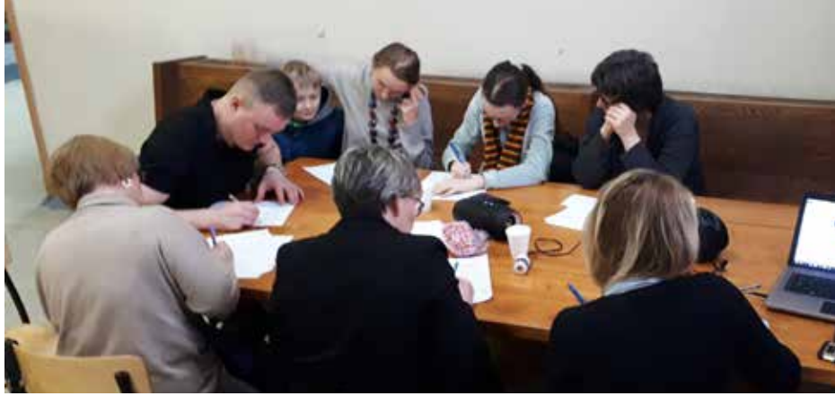
Montrealio lietuviai rašo valstybinį diktantą

Džiugu, kad Lietuvoje didelis dėmesys skiriamas lietuvių kalbai, jos rašybai. Kovo 8 dieną jau dvyliktą kartą vyko valstybinis diktantas (I ratas) – tarptautinis suaugusiųjų ir moksleivių raštingumą skatinantis konkursas, kuris buvo perduodamas per LRT radiją ir internetu. Organizatorių tikslas – paskatinti žmones didžiuotis savąja lietuvių kalba, kalbėti ir rašyti ja taisyklingai. Konkurso dalyviai varžysis raštingiausio moksleivio, raštingiausio suaugusiojo bei raštingiausio užsienio lietuvių kategorijose. Baigiamasis renginys vyko balandžio 13 dieną. Raštingiausieji yra apdovanojami prezidentūroje. Prie kon-