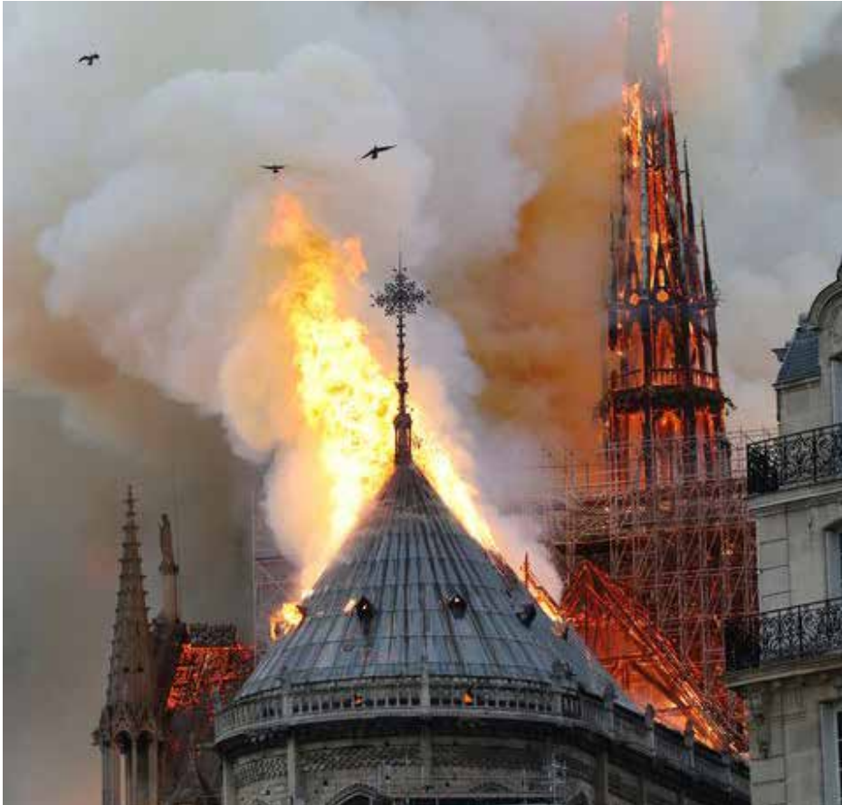
Liepsnojanti Dievo Motinos katedra Paryžiuje

Apie ne vien Paryžiaus, ne vien Prancūzijos, bet ir visos Europos, plačiai žinomo visame pasaulyje simbolio gaisrą pranešta Didžiosios savaitės pirmadienio pavakare. Gaisro gesinimui mesta apie penkis šimtus gaisrininkų, tačiau jie negalėjo liepsnų numaldyti, tik jas apribojo.