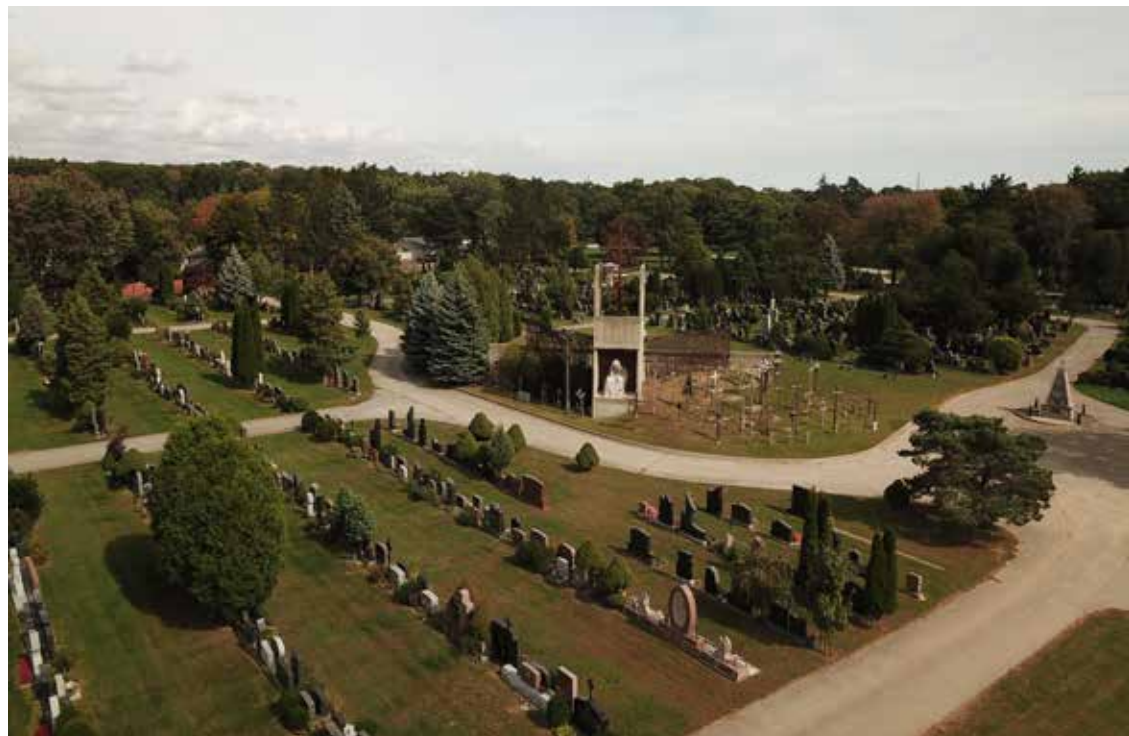
Dalis lietuviškų kapinių su šalia koplyčios kryžių kalneliu