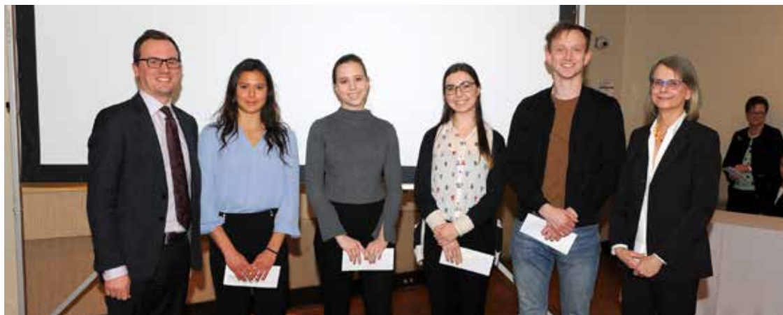
„Paramos“ valdybos pirmininkė su stipendijas gavusiais studentais

Linkime „Paramai“ ir toliau išlikti finansiškai stipriai, nepriklausomai nuo ekonominių pokyčių, gyvybingai ir visapusiškai sėkmingai.