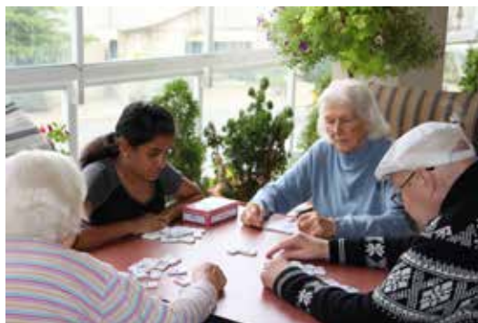
„Labdaros“ gyventojų laisvalaikis