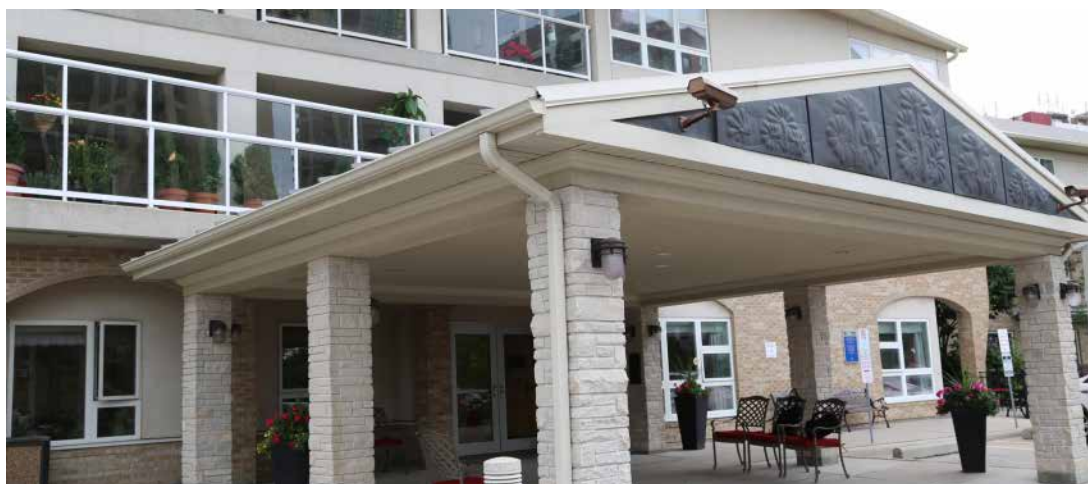
„Labdaros“ slaugos namai