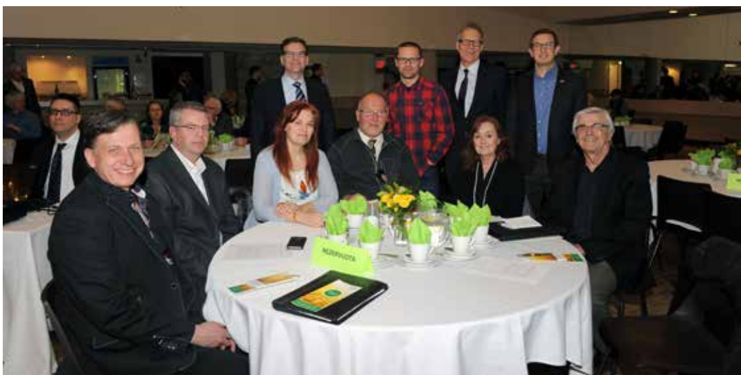
„Paramos“ metinio susirinkimo svečiai