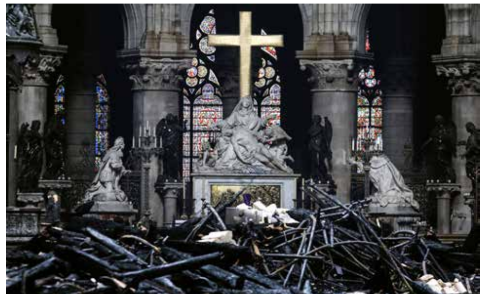
Gaisro nusiaubtoje katedros salėje išliko liepsnos nepalietas kryžius – kaip vilties simbolis