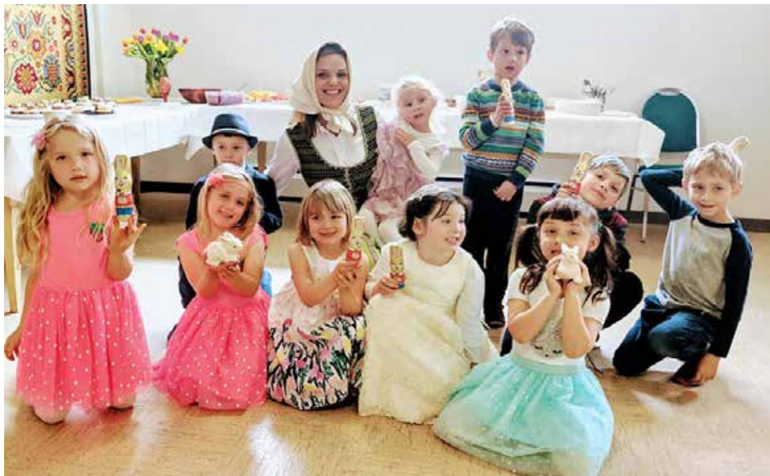
Vankuverio „Pelėdžiukų klubo“ mažieji su Velykų bobute