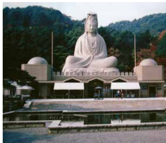
Paminklas - šventovė visiems žuvusiems II Pasaulinio karo kariams

Pastatas labai ilgas (118 m). Jame gražiai išrikiuota 1001 deivės Kannon statula – viena didesnė (3.3 m aukščio), visos kitos perpus mažesnės ir ne taip detalios išdrožinės. Kiekviena deivė Kannon turi vienuoliką veidų ir 1,000 rankų (21 pora matosi, o kitos nematomos 40 porų atstovauja 1000-čiui, nes kiekviena pora gelbsti 25 pasaulius – neprašykite paaiškinti plačiau, nes aš ir pats to nesuprantu). Visos statulos išdrožtos iš medžio ir padengtos auksu. Kai įeini į pastato vidų, prieblandoje pamatai 1001 auksu