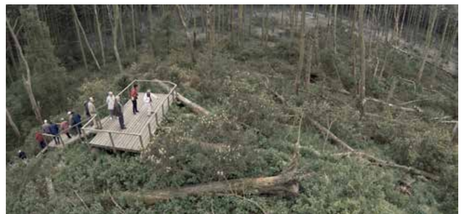
A moment from the movie Acid Forest

ed landscape and the thriving aquatic avians is stark, but not unrelated phenomena, for it's quickly revealed in the film that the trees are dying because the bird feces is so acidic that it burns away their roots. When nature calls in this