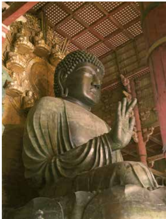
Didžiausia pasaulyje bronzinė Buda (Nara)

Keliaudamas po pasaulį, pamatai ir jau pažįstamų dalykų, ir keistų naujovių. Prieš 30 metų pasinaudojau proga nukeliauti į Japoniją. Išskridau iš Toronto penktadienį, trylikta mėnesio dieną. Lėktuvas buvo pustūštis. Bet aš ir galvojau, kad taip bus, nebent skristų vien tik japonai, kuriems nei penktadienis, nei 13 nieko ypatingo nereiškia.