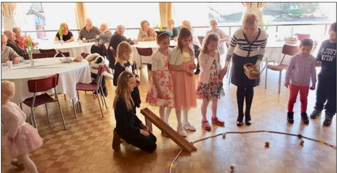
Smagi atvelykio šventė