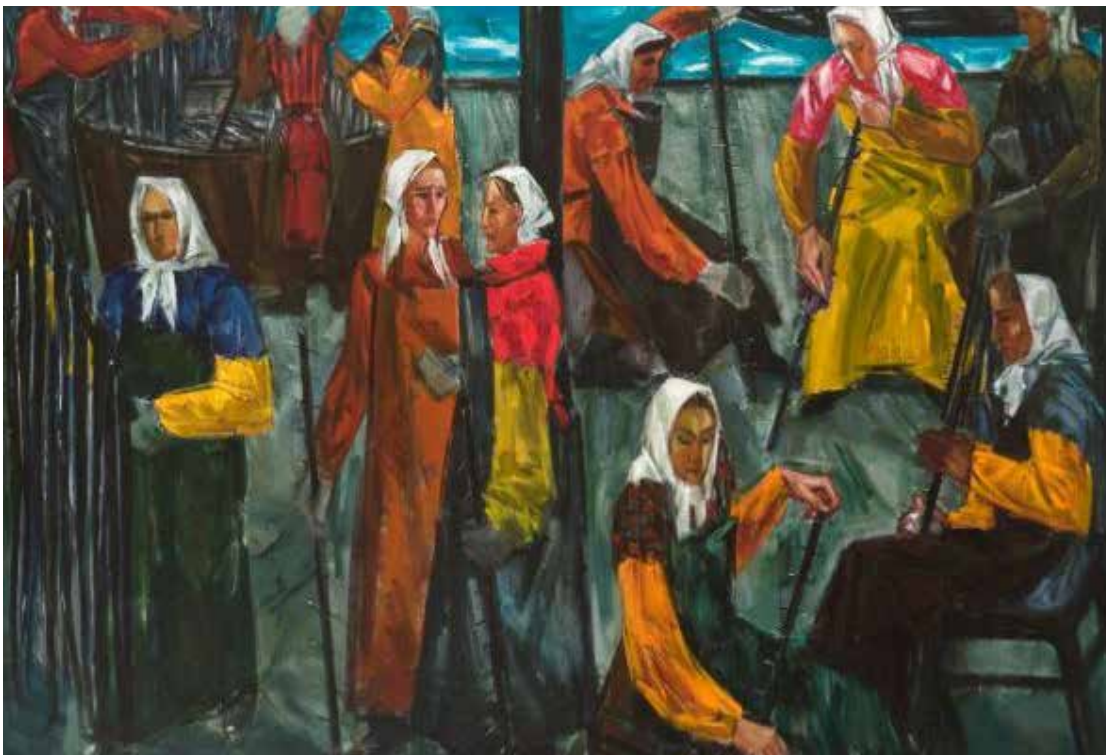
Kuršių marių moterys, 1977