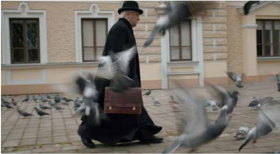
Kadras iš filmo „Vaižganto kodas“

Kanados lietuvių muziejaus-archyvo parodų salonas balandžio 30 ir gegužės 1-ąją dviems vakarams pavirto maža kino sale. Čia, šalia rengiamos KLMA 30-mečiui skirtos parodos „Bendruomenė ir paveldas“ plakatų, žiūrovai buvo pakviesti į lietuviškų dokumentinių filmų vakarus.