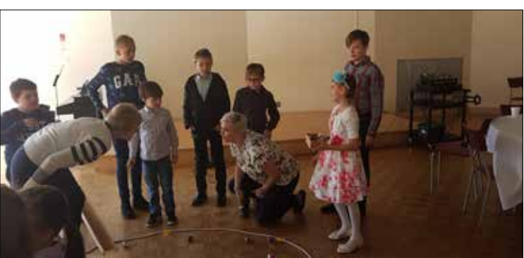
Vertintojai ir žaidėjai stebi, kam pasiseks