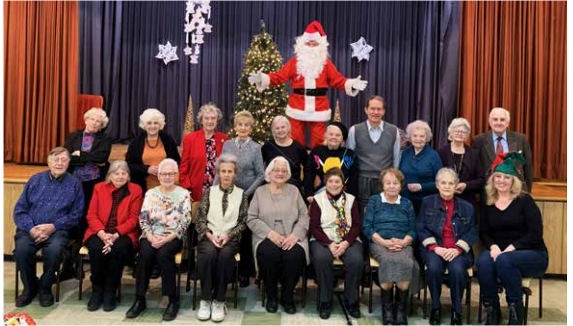
„Rūtos“ klubo nariai Kalėdų šventėje