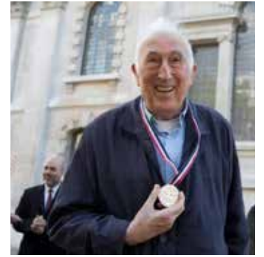
Jean Vanier, “Arkos” bendruomenių steigėjas, po apdovanojimo Templeton premija 2015 m. Londone, D.Br.

perdavęs vadovybę kitam asmeniui, pats buvo apsigyvenęs pačioje pirmojoje “Arkos” bendruomenėje prie Paryžiaus, ten gyvendamas ir mirė.