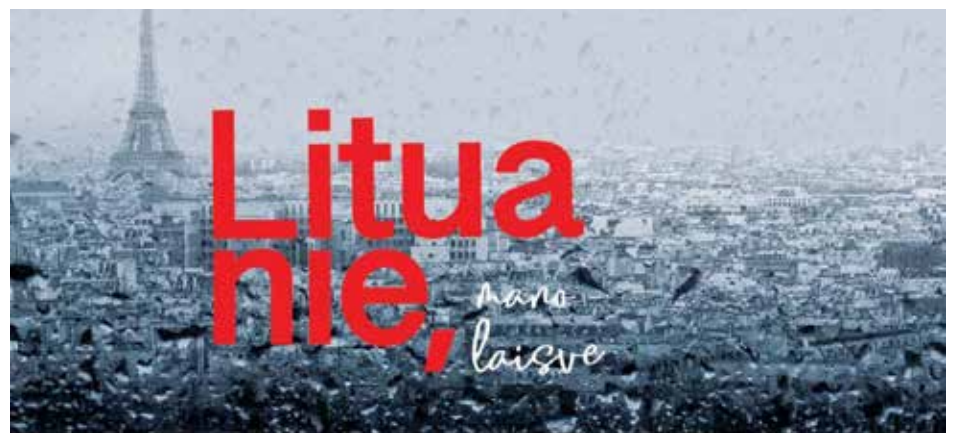
Filmo titulinis kadras