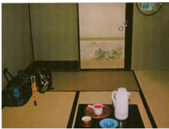
Mano kambarėlis Kyoto Ryokane

Paskutinę naktį Kyoto mieste nutariau praleisti tradiciniame japoniškame viešbutyje – ryokan . Vėlyvą popietę su lagaminėliu atėjau į tylią šalutinę gatvelę, kurios gale ir buvo mano užsakytas ryokan . Vienaaukštis medinis namukas su slankiojamomis durimis. Jas pastūmėjęs, atsiradau mažame prieškambarėje, kur mane pamačiusi vedėja (o gal ir savininkė) angliškai paprašė nusiauti batus, užsiauti ten rastas šliures ir ateiti į jos įstaigą. Ten sumokėjau už nakvynę, man paaiškino visas taisykles ir nuvedė į man skirtą kambarį. Prie kambario durų palikome šliures ir tik su kojineis įėjau į kambarį.