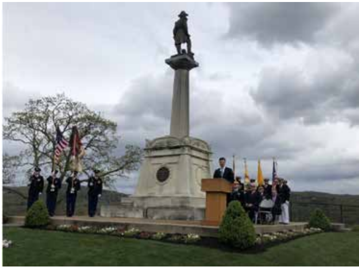
Iškilmė prie paminklo T.Kosciuškai