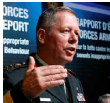
Gen. J.H.Vance, Kanados ginkluotųjų pajėgų vadas

Lietuvoje gegužės 2-3 d.d. su oficialiu vizitu pirmą kartą lankėsi Kanados kariuomenės vadas (Gynybos štabo viršininkas) generolas Jonathan H. Vance ir jį lydinti delegacija. Lietuvos kariuomenės atstovai svečių supažindino su šalies kariuomenės pajėgumais, planuojamomis tarptautinėmis karinėmis pratybomis ir informacinės erdvės stebėjimais. Lietuvos ir Kanados kariuomenių vadai lankėsi Antakalnio kapinėse, kur generolas J. H. Vance pagerbė žuvusių už Tėvynę Lietuvos karių atminimą. Vėliau gen. J. H. Vance apsilankė Vil-