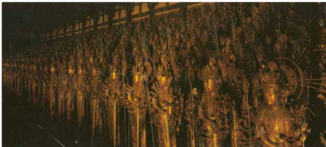
Gailestingumo deivės Kannon šventovė