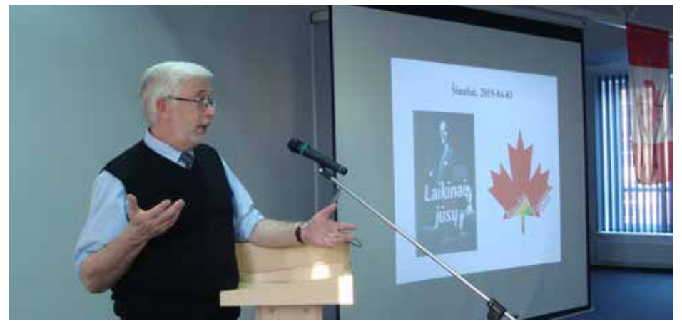
Romano Laikiniai jūsų pristatymas Šiaulių universiteto bibliotekoje (2019.04.03)

„Baltos lankos“. Kaip matyti, beveik kiekvieną iš lietuviškai pasirodžiusių knygų vertė kitas vertėjas.