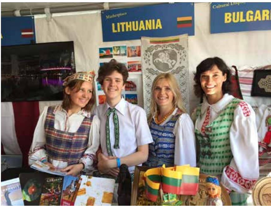
Europos festivalyje 2019 Vankuverio lietuviai pristato parodą apie Lietuvą