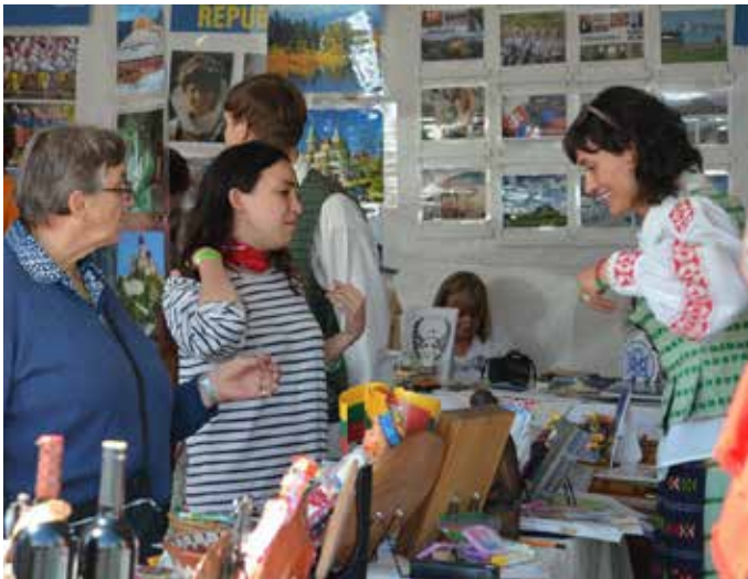
(K.) festivalyje – viskas apie Europą; (d.) lankytojų žvilgsnius traukia lietuviški suvenyrai