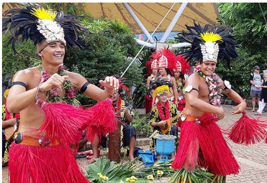
Prancūzijos Polinezijos Papeete saloje šoka čiabuviai taitiečiai

Ketvirtadienį jau lipame laivan, kuriame gyvensime 18 dienų. Maistas puikus, pramoginės programos – geros. Visada galima lyginti su kitais laivais, kitomis kelionėmis, ir rasti, kas yra blogai, kaip girdėjome iš kitų keliautojų. Tačiau – kas gali būti smagiau, negu bendrauti