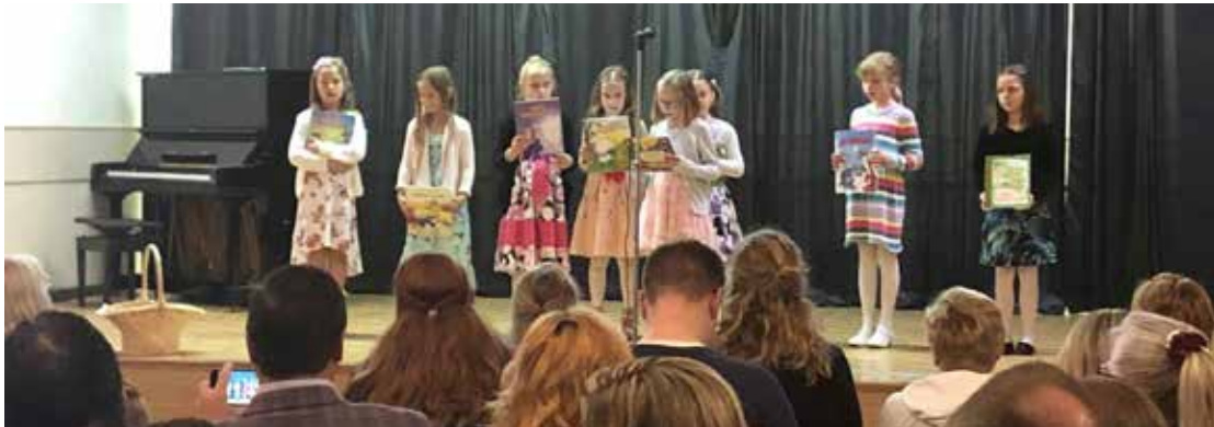
II klasės moksleiviams labiausiai patiko lietuvių liaudies pasakas