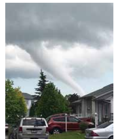
Viesulas Gatineau, netoli Otavos

Telefoninių įspėjimų sistemos vykdytoja Pelmorex įstaiiga aiškina, kad ne visi mobilieji telefonai gali priimti tokius įspėjimus. Jie turi būti tinkamai prijungti ir pakankamai „išmanūs“, kad norint priimtu