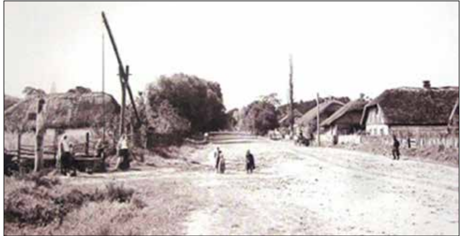
Pašilės kaimo vieškelis.