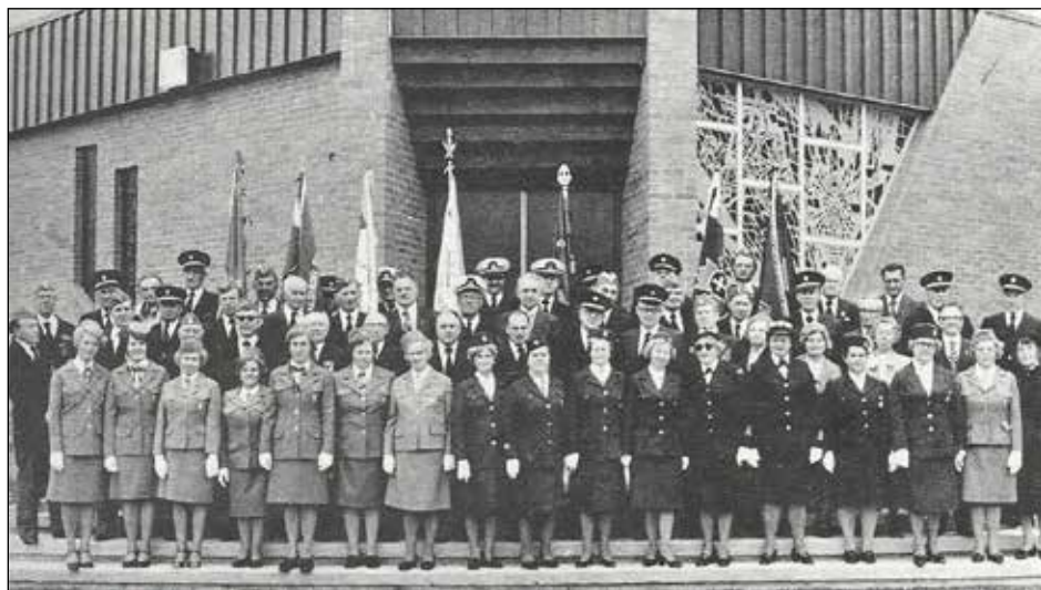
Toronto Vlado Pūtvio šaulių kuopos 25-čio minėjimas su kitų Kanados šaulių kuopų atstovais, prie Lietuvos kankinių šventovės

Pirmieji šauliai susibūrė Kanadoje, Toronto lietuvių telkinyje. 1954 metų kovo 7 dieną Toronte įsisteigė pirmasis šaulių vienetas, pasivadinęs šaulių klubu. Todėl ši data laikoma šaulių organizacijos atsikūrimo pradžia iševijoje. Vėliau steigėsi šaulių klubai JAV ir kituose Kanados lietuvių telkiniuose. Pradėjus vystyti šauliškai veiklai, buvo sušauktas pirmasis atstovų suvažiavimas, kurio metu išrinkta centro valdyba ir nuspręsta pasivadinti Lietuvos Šaulių sąjunga tremtyje. Daugelį metų veikusi tuo pavadinimu, organizacija vėlesniais metais per visuotinį atstovų suvažiavimą nutarė pakeisti pavadinimą į Lietuvos šaulių sąjungą iševijoje. Pačiais brandžiausiais organizacijos metais buvo 17 dalinių JAV, 8 kuopos ir vienas būrys Kanadoje ir dvi kuopos Australijoje. Kanados šaulių kuopos sudarė Kanados šaulių rinktinę „Vilnius“, JAV buvo dvi rinktinės. Didesniuose lietuvių telkiniuose steigėsi jūros šaulių kuopos, kurios bendradarbiavo su esančiomis šaulių kuopomis. Prasidėjus išsilaisvimo bangai, 1989 metais atsikūrė šaulių organizacija Lietuvoje. Pradžiai nebuvo lengva. Paskelbus Lietuvos Nepriklausomybės atstatymą, žlugus Sovietų Sąjungai, iš Lietuvos buvo išvesta okupacinė kariuomenė. Susikūrus gynybos sistemai, šaulių organizacija tapo pavaldi Krašto apsaugos ministerijai. Gynybos ministeris skiria Šaulių sąjungos vadą. Atstovų suvažiavimas patvirtina paskyrimą, tada vadas sudaro centro valdybą. Lietuvoje šaulių dali-