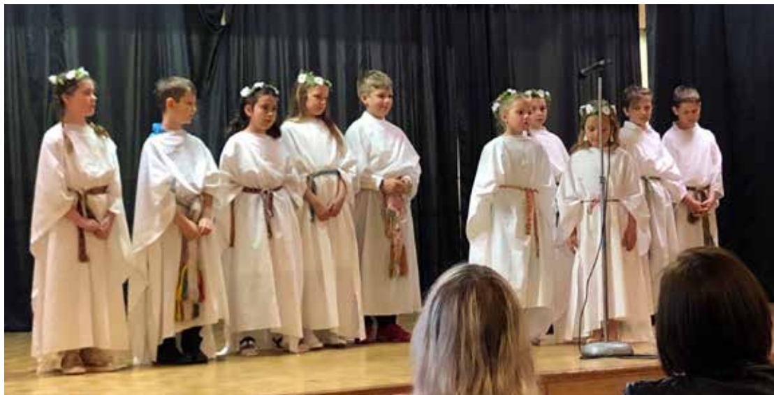
III ir IV klasės moksleiviai pasakoja Eglės, žalčių karalienės istoriją