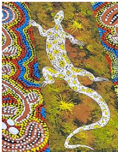
Australijos aborigenų menas