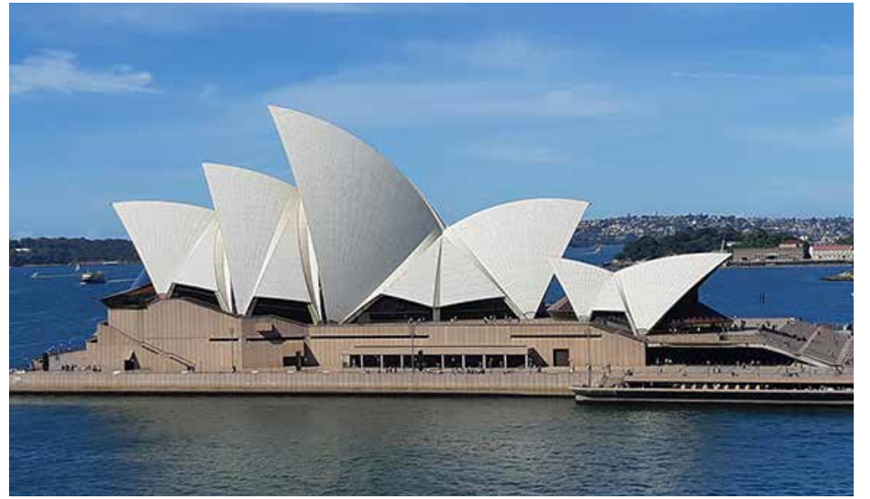
Australijos Sydney miesto įspūdingieji operos rūmai, suprojektuoti švedo Jörn Utzon