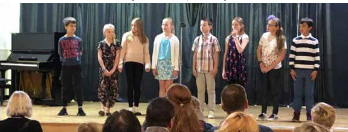
Penktaklasiai supažindina su J. Degutytės Spalvota knygele