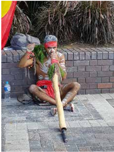
Australijos aborigenų muzika Sydney mieste, uosto pakraštyje

Skrydžio iš Toronto į San Francisco beveik nebeprisimenu. Nors tai, normaliai galvojant, netrumpas gabalas, po to laukė labiau bauginantis penkiolikos valandų sėdėjimas lėktuve iš San Francisco į Sydney. Ilgiau negu į kokią Romą ar Varšuvą! Prisikroviau mezgimo, knygą, kompiuterį-planšetę, migdančių vaistų, muzikos ir saldainių.