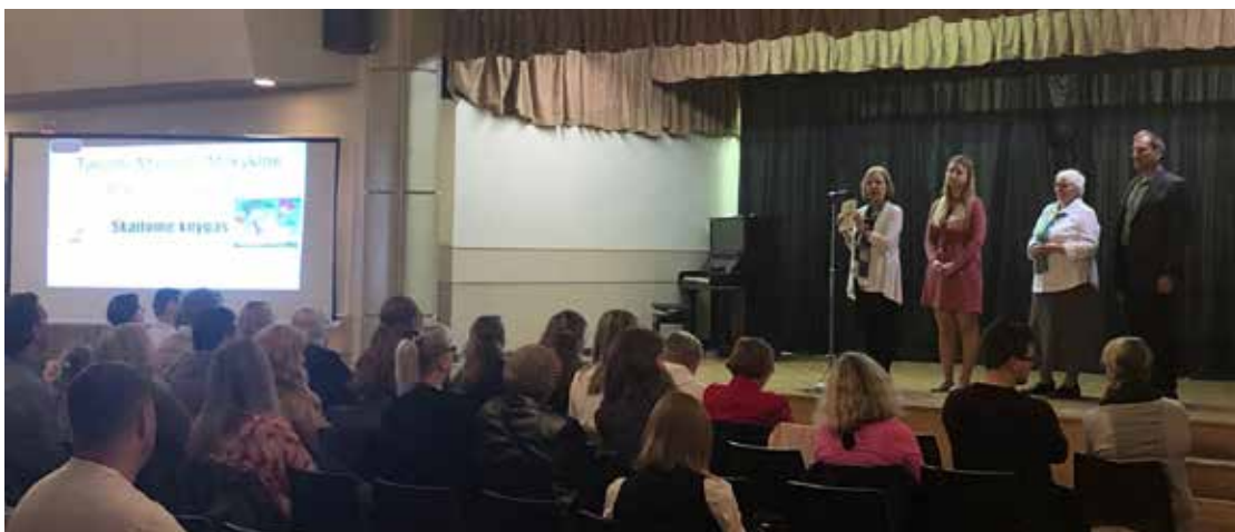
Pavasario šventėje pradamas pokalbis apie knygas