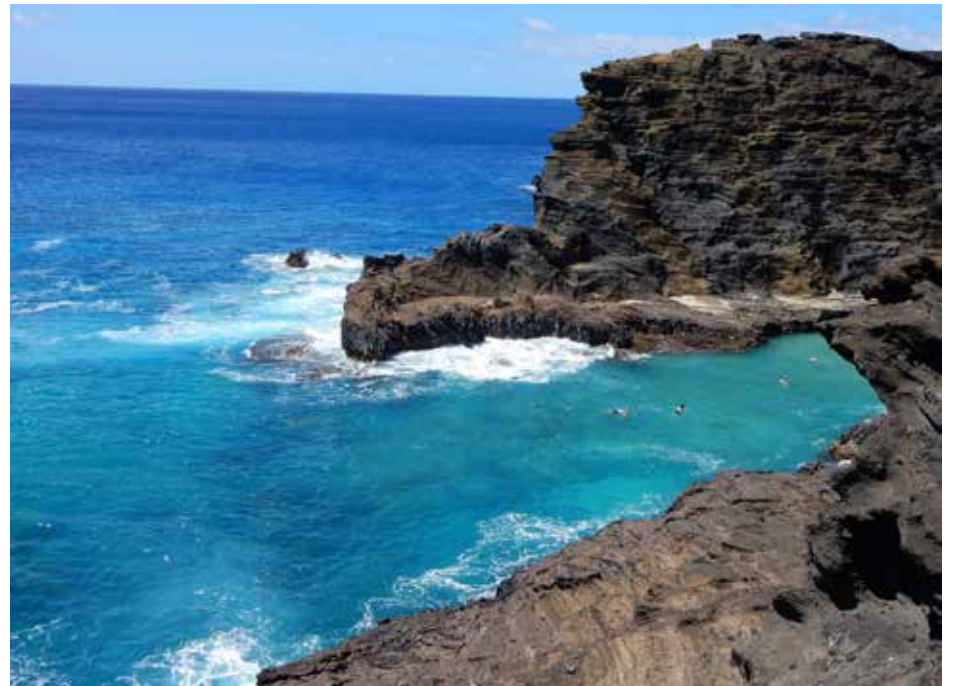
Tik vienas iš daugelio nepaprastų vaizdų Havajuose

su savais gražiam plaukiančiame viešbutyje. Tai yra kaip prabangi „stovykla“ suaugusiems.