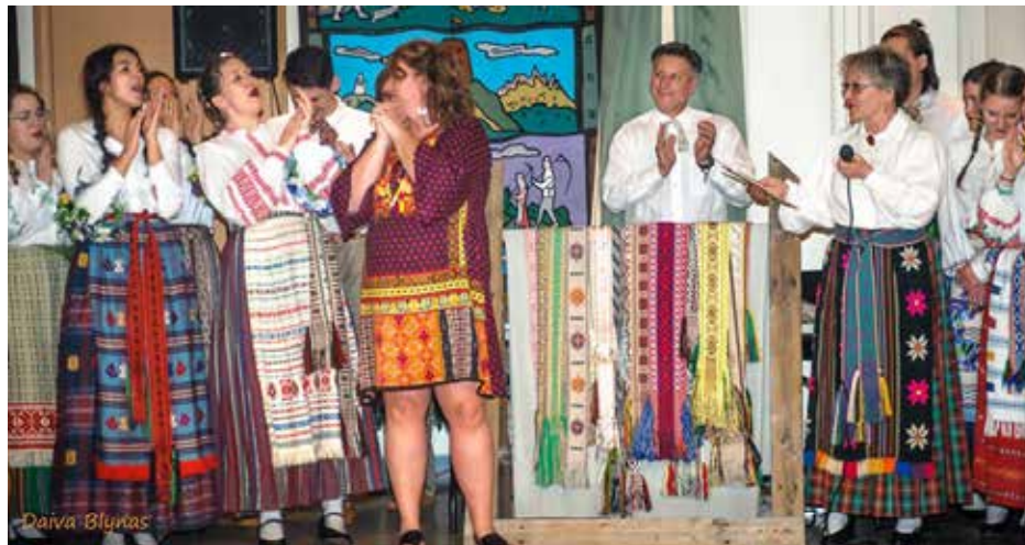
„Gintaro“ jaunimas ir vadovas

Nuoširdus ačiū „Gintaro“ vadovams ir visiems šokėjams, kurie organizavo šventę ir nepagalėjo jėgų ir laiko tam, kad būtų prisiminta viena įdomiausių vasaros švenčių – Joninės, Rasos, Kupolės.