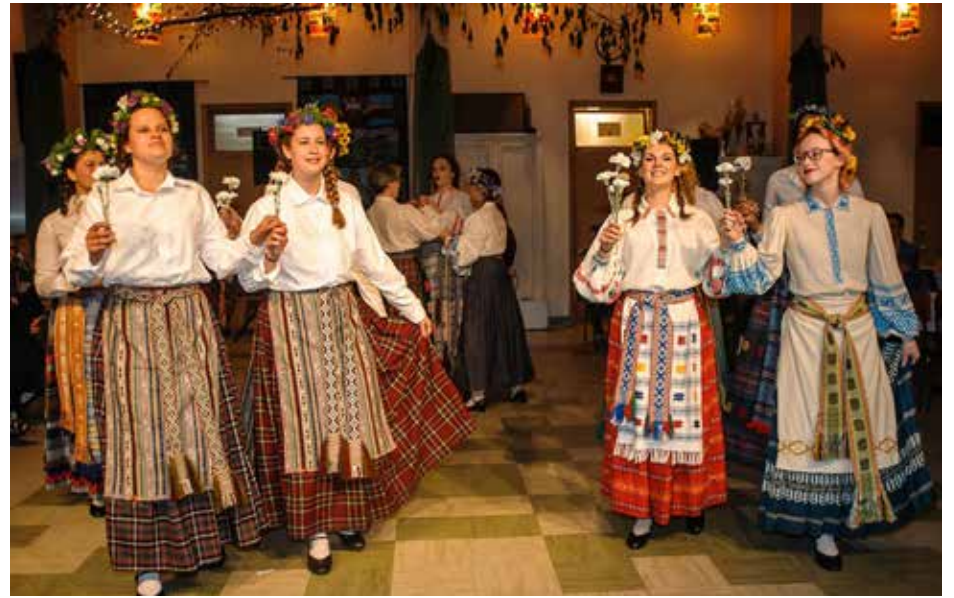
Šoka „Gintaro“ merginos

širdyje įžiebta meilė, o ši šventė, kuri kupina magijos, kaip tik apipinta meilės bei vestuvių burtais. Pagal tradiciją „Gintaro“ jaunimas meilės paieškas įprasmino šokyje „Joninių burtai“. Tuomet visi susipažįsta, kai kam ir širdelė stuksenti pradeda smarkiau pamačius ilgai lauktą mylimą žmogų... Kokia gi Kupolės šventė be kerų, paslapčių, visokių baisių! Vos saulei nusileidus, prasideda trumpiausios nakties tamsių jėgų veikla. Vienos pagrindinių stebuklingos nakties veikėjų – raganos. Tai senovės laikų žiniuonės, magijos veiksmų atlikėjos, kosmoso, žmonių ir gyvūnų tvarkytojos, nakties būtybės. Kaip tarpininkės tarp dievų ir žmonių sulaukta raganos ir mūsų šventėje. Ji baisi, sušivėlusiais plaukais, ilgais nagais bandė gąsdinti jaunuolius, tačiau ar meilė gali kas nugalėti?! Audringų svečių plojimų sulaukė kitas šokis, nes Joninių šventėje pasirodė jaunuoliai trankiai sušoko „Mikitą“. Kokia šventė be meilės flirto! Mergaičių lietuvaikių, pasidabinusių vainikėliais, „Lenciūgėlis“ labai viliojo vieną bernelį, kuris išsirinko sau išrinktąją. Labai gražiai šventę įprasmino mergvakario šokis „Sadutė“, kuris palietė jautriausią nuotakos ir mamos sielos giją, kai jaunąją dukrelę reikia atiduoti berneliui. Pagaliau lauktosios vestuvės ir puikus šokis „Rezginėlė“. O kokios vestuvės be polkos?! Į „Šelmių polkos“ ritmą įsitraukė ne tik šelmiai