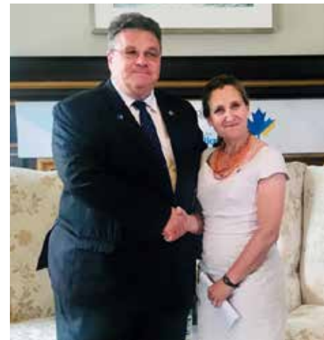
Toronto tarptautinėje konferencijoje du užsienio reikalų ministrai L. Linkevičius (Lietuva) ir Ch. Freeland (Kanada)

– Galiu atsakyti vienu žodžiu – neįkainojama. Sunku papasakoti apie visą patirtį, reikia laiko jai apmąstyti. Per tuos dešimtmečius būti dalyviu daugelyje įvykių ir permainų, Lietuvai siekiant ir žengiant svarbius politinius žingsnius – likimo dovana. Savo karjerą pradė-