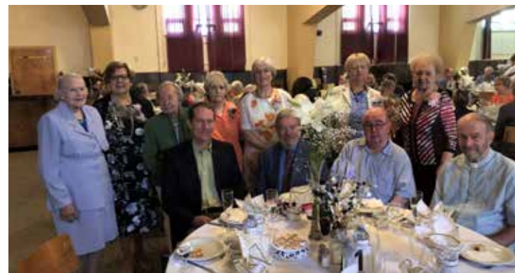
Šv. Elžbietos draugijos 100-mečio iškilmių garbės stalas