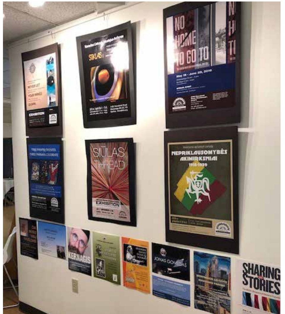
KLMA surengtų parodų reklaminiai plakatai

Man pačiai, bendruomenės gyvenimą ir veiklą pažįstančiai tik nuo 1991-ųjų, parodoje sukurtas bendruomenės veiklos vaizdas buvo įspūdingas savo