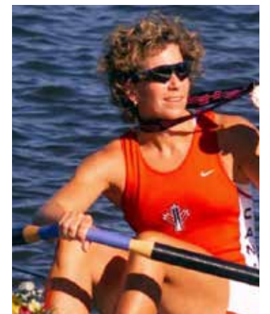
Marnie McBean - Kanados olimpiečių komandos atstovė būsimosiose 2020 Tokijo vasaros žaidynėse

Marnie McBean, vienos olimpinės žaidynės laimėjusi 3 aukso medalius, išrinkta Kanados olimpinės komandos viešųjų ryšių atstove 2020 metų Tokijo vasaros olimpiadoje. Sportininkei tai bus 10 olimpinės žaidynės: dviejose iš jų dalyvavo irklavimo rungtyse, kitose – kaip trenerė ir patarėja sportininkams. Marnie Mc Bean yra Kanados Garbės ordino narė, jos vardas įrašytas Kanados olimpinėje garbės sąrašė, už nuopelnus sportui ir tarptautinei veiklai yra apdovanota gen. gubernatoriaus ir Karalienės Elžbietos medaliais.