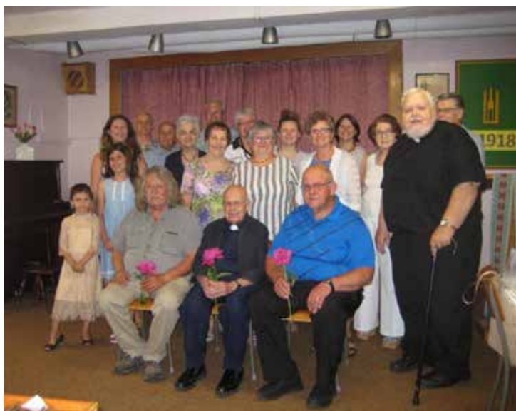
Joninių šventė Delhi ir Tillsonburg Šv. Kazimiero parapijoje