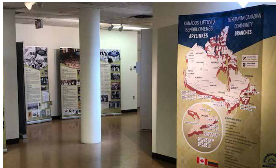
Parodos bendras vaizdas; stenduose - Kanados lietuvių bendruomenės istorija ir paveldas