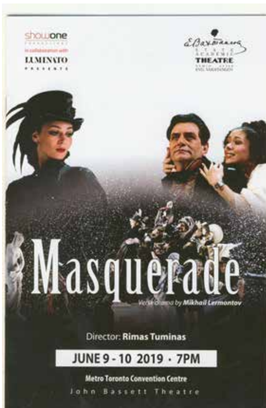
Toronte parodyto Maskvos Vakhtangovo teatro spektaklio „Maskaradas“ programa