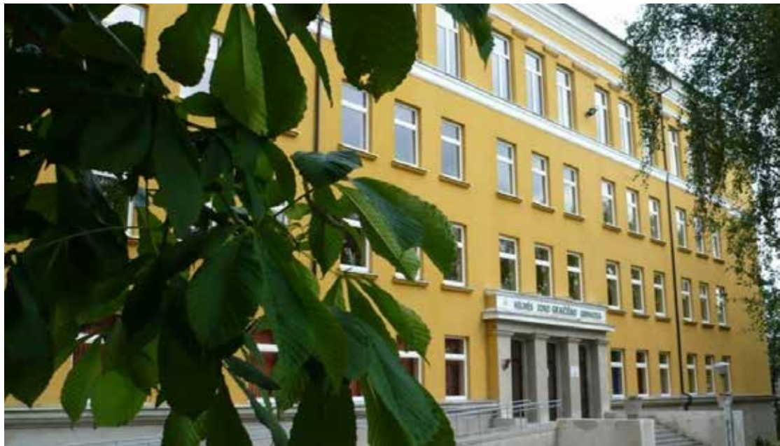
Kelmės J. Graičiūno gimnazijos pastatas