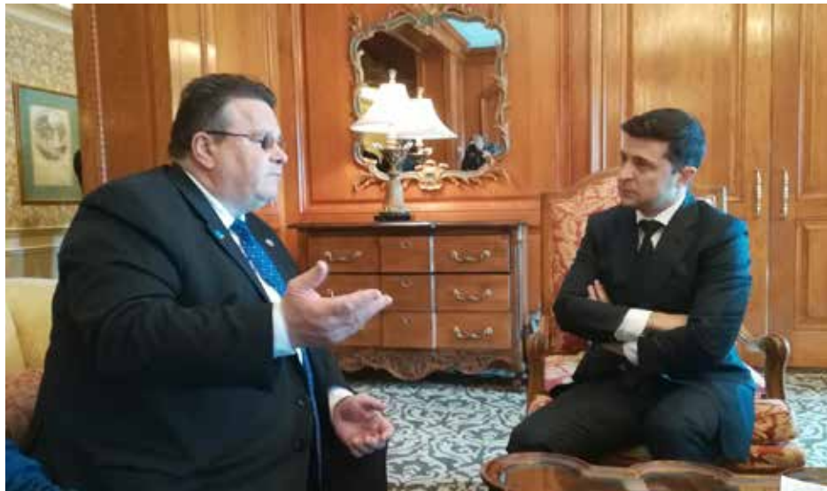
Lietuvos užsienio reikalų ministeris L. Linkevičius (k.) ir Ukrainos naujasis prezidentas V. Zelenski susitikime Toronte

daugiau, šiandien mes pasitikime savi. Bet negalime nusiraminti, nes tai, kas vyksta Ukrainoje ar prieš 20 metų vyko Sakartvelo (Gruzijos) valstybėje – atplėšta 20% teritorijos – visa tai vyksta Europoje, šalia mūsų. Gindami Ukrainą, mes giname Lietuvą, ir, galima sakyti, Europą ir apskritai Vakarų tarptautines