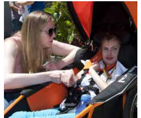
Tai kasmetinis sporto renginys, kuriame mielai dalyvauja įvairaus amžiaus žmonės – jaunimas, tėvai, seneliai ir net vaikai