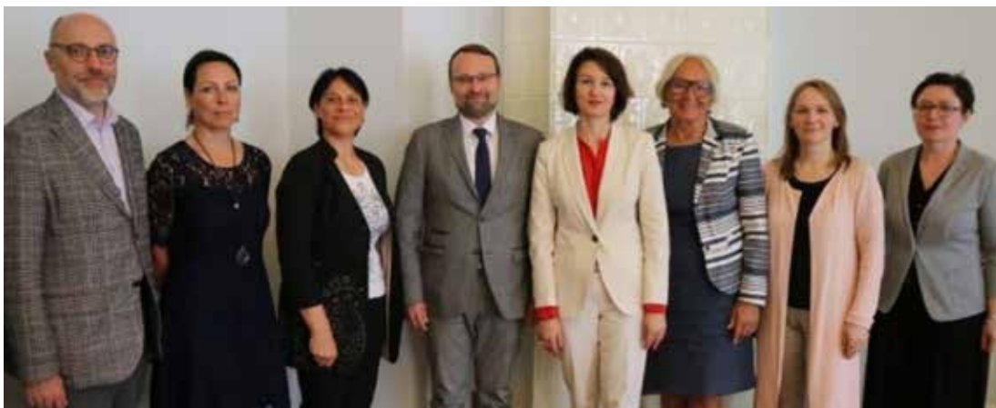
PLB atstovų ir Lietuvos kultūros atstovų susitikimas

Pasaulio lietuvių bendruomenė vienija 47 užsienyje susibūrusias mūsų šalies bendruomenes. Inf.