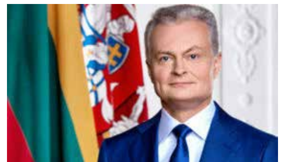
G.Nausėda, Lietuvos prezidentas

Semdamiesi jėgų iš Tautos istorijos ir didžiavyrių – nuo karaliaus Mindaugo iki Nepriklausomybės akto signatarų, nuo pirmųjų Lietuvos kariuomenės savanorių iki partizanų, tremtinių ir sovietmečio disidentų – nuo pamatų sukūrėme valstybę, tapusia Europos sąjungos šalių šeimos nare ir patikima Šiaurės Atlanto aljanso partnere.