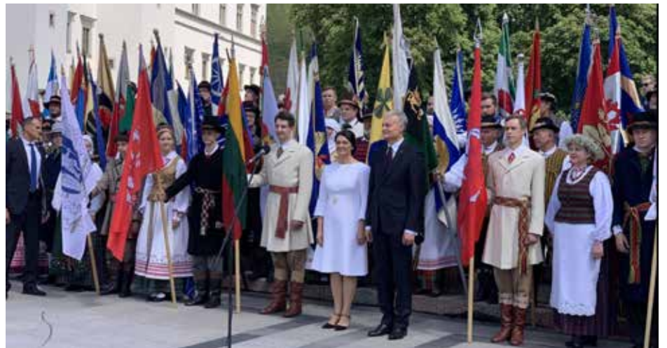
Katedros aikštėje Lietuvos miestų ir miestelių istorinių vėliavų pagerbimo iškilmėje dalyvavo ir išeivijos atstovai

valstybės pareigūno būtų reikalaujama asmeninės atsakomybės.