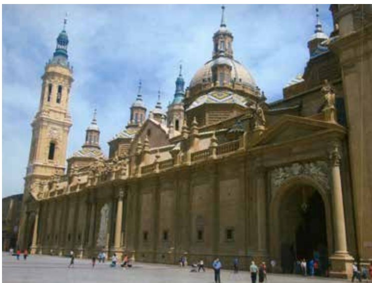
Įspūdinga katedra, kurios neaplenkia ir piligrimai

Mišios būna kasdien Santiago katedroje, bet penktadieniais atsitinka kažkas, mano nuomone, nepaprasto. Katedroje būna pakabinamas didžiulis smilkytuvas „Botafumeiro“, kuris sveria 80 kilogramų. Jį pakrauna 40-čiu kilogramų žarijų ir smilkaų, ir tada aštuoni raudonai apsivilkę vyrai, „firaboleiros“, įsupa tą smilkytuvą nuo lubų iki lubų, palikdami kvepiančių dūmų debesį įkandin smilkytuvo. Nemačiau to proceso, bet tai vienas dalykas, kurį norėčiau pamatyti.