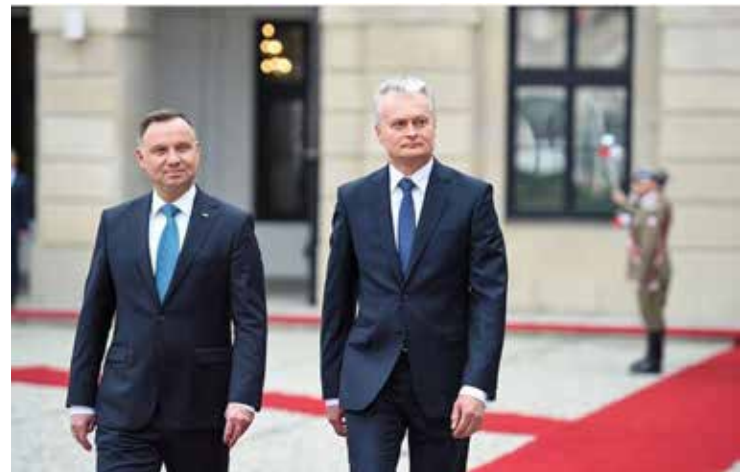
Lenkijos ir Lietuvos prezidentai A.Duda(k.) ir G.Nausėda(d.) susitikime Varšuvoje

Pirmoji naujojo prezidento G.Nausėdos kelionė į užsienį – į Lenkiją, liepos 16 d. buvo sėkminga. Susitikimuose su Lenkijos prezidentu A.Duda buvo surengti dvišaliai pokalbiai apie abiem valstybėms svarbias problemas – saugumą, energetikos nepriklausomybę, susisiekimo ir tolimesnio ekonominio bendradarbiavimo plėtrą. G.Nausėda pakvietė Lietuvoje steigti Lenkijos banką, kad didesnė bankų konkurencija tarnautų vartotojams, priminė, kad Lenkija pagal savo svarbą yra antroji Lietuvos eksporto partnerė. Tiesioginės Lenkijos investicijos Lietuvoje siekia daugiau nei bilijoną eurų, Lietuvos investicijos Lenkijoje – daugiau nei 433 mln. eurų. Be to, Lenkija