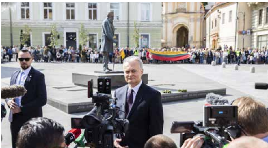
Priesaikos dieną G.Nausėda pagerbė J.Basanavičiaus atminimą