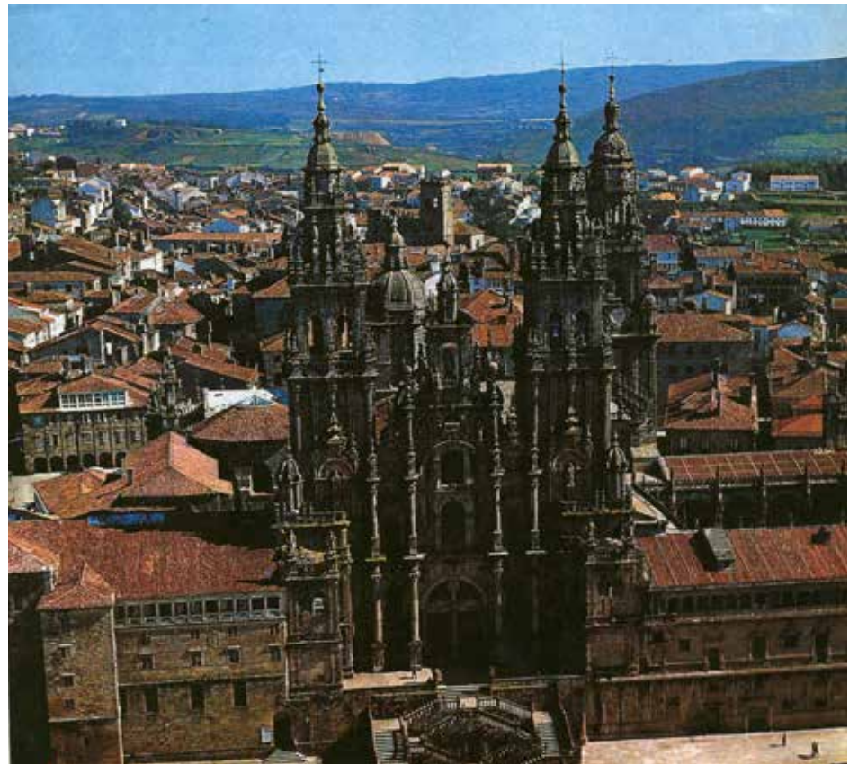
Santiago de Compostelo katedra

Pirmosios piligrimų grupės iš kitapus Pirenėjų kalnų į Campostelą keliavo X šimtmečiuje. Le Puy vyskupas, nukeliavęs į Campostelą 950 metais aprašė savo kelionės įspūdžius. Piligrimus saugodavo kartu keliaujantys ar samdyti kariai, vėliau ir Templierių ordino vienuoliai-kariai, o pakelės ligoninės ir viešbučiai dažnai aptarnaudavo įvairių ordinų vienuoliai. Piligrimų ypač padaugėjo, kai popiežius Calixtus II apie 1140 metus išleido penkias knygas, vadinamas Codex Calixtinus, kuriose aprašė šv. Jokūbo kelią, piligrimystės naudą, bei paskelbė Campostelos Šven-