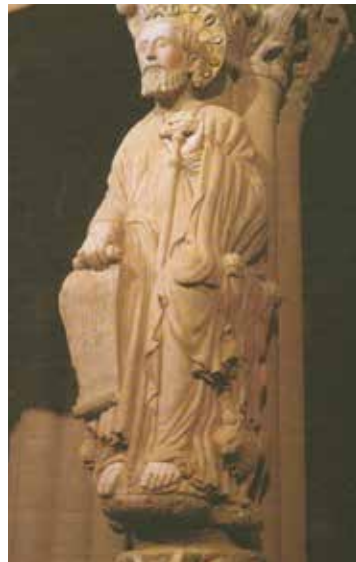
Šv. Jokūbo skulptūra katedroje

Santiago de Campostelo atsiradau vieną antradienio rytą ir praleidau gerą pusdienį apžiūrėdamas katedrą ir jos aplinką. Įdomu, gražu, įspūdinga, bet kai nebūni tikru piligrimu, nukeliavusiu bent dalį „camino“, nesijauti, kaip namie. Jautiesi svetimas, nors ir apkabini šv. Jokūbo statulą, užlindęs už altoriaus. Mano atmintyje „atvirukas iš Santiago“: maža mergaitė su ilgom kasytėmis, sudėsčiusi kriauklių ir spalvotų akmenukų ant namo laipto,