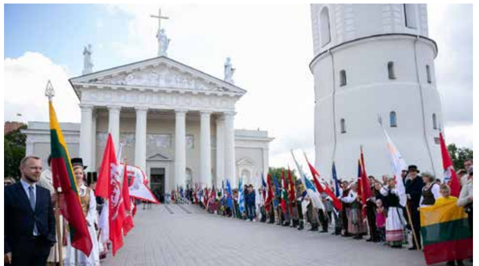
Vilniečiai prie Katedros laukia atvykstančio naujojo prezidento

Žmonių viltys, išsakytos per Prezidento rinkimus, parodė, kad Prezidento institucija pelno didžiausią piliečių pasitikėjimą. Prezidentas – tai žmonių atstovas, turintis tiesioginį Tautos mandatą. Todėl savo pareigas suprantu kaip įpareigojimą ryžtingai ginti ir atstovauti visų piliečių interesus.