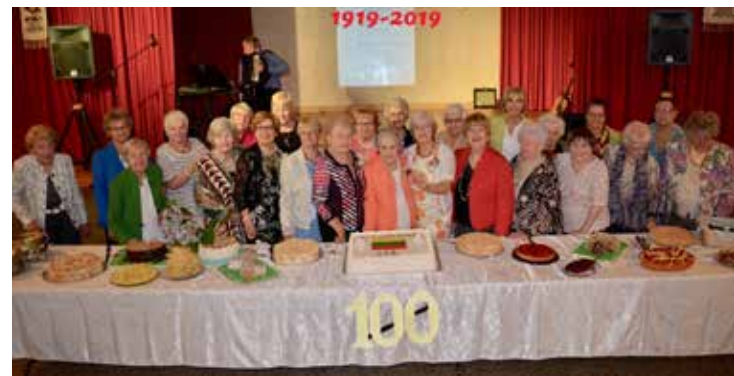
Birželio 9 d. mūsų parapijos Šv. Elžbietos draugija šventė draugijos įsteigimo 100-metį. Šv. Elžbietos draugijos narės prie 100-mečio iškilmės vaišių stalo

Rugpjūčio 4, sekmadienį , vyks Šv. Onos draugijos metinė šventė. Mišios 12 v.d., šilti pietūs salėje po Mišių. Kaina: narėms, kurios užsimokėjo šių metų mokesį, nemokamai; svečiams – $15. Komitetas kviečia visus dalyvauti. VL