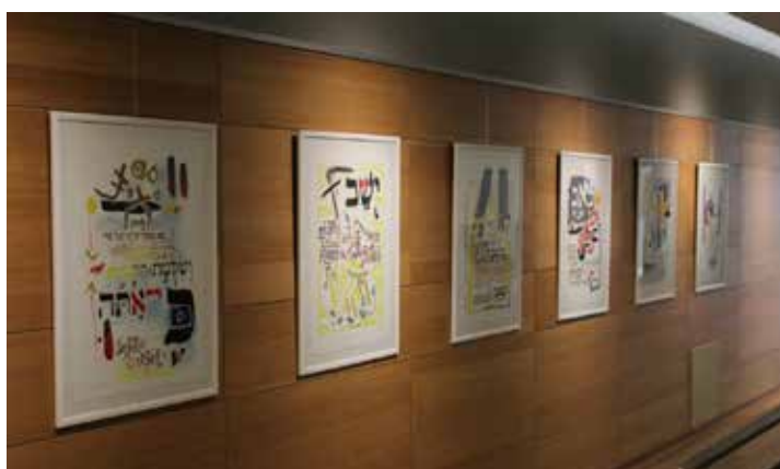
Išeivijos dailės paroda Užsienio reikalų ministerijos rūmuose

atidaryta Pasaulio lietuvių metams skirta vaizduojamojo meno paroda iš „Lewben Art Foundation“ ir Lietuvos