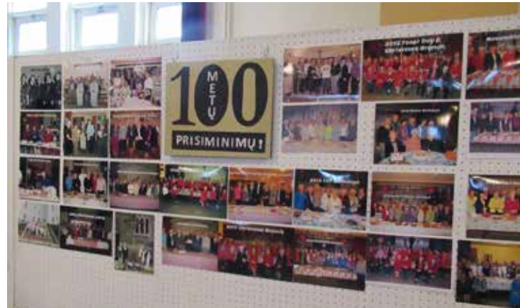
Atminimo lentos nuotraukose -- draugijos šimtmečio darbų, renginių istorija