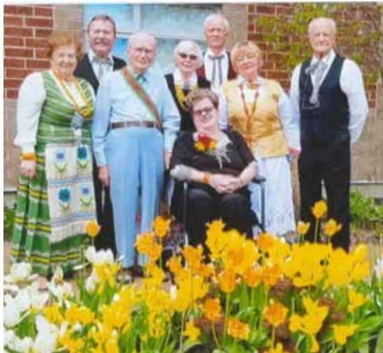
Gimtadienio šventėje – „Dainos“ choras