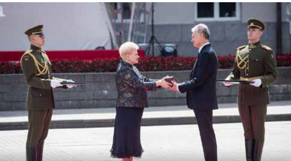
S.Daukanto aikštėje viešoje iškilmėje prezidentas G.Nausėda priėmė iš buvusios prezidentės valstybės valdymo ženklus – Didįjį antspaudą ir Konstituciją

stovyklas ir veda į akligatvį, kuriame neįmanoma susitarti nei dėl strateginių šalies tikslų, nei dėl priemonių jiems įgyvendinti.