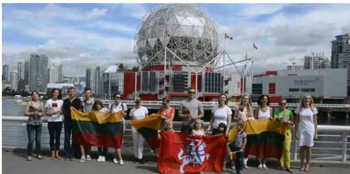
Vankuverio lietuviai liepos 6-ąją mini Lietuvos Valstybės dieną, giedodami Tautišką giesmę

Rugpjūčio 9 dieną Lietuvos ambasadoje Minske lankėsi Gudijos Rimdžiūnų vidurinės mokyklos vaikų vasaros stovyklos „Su Lietuva“ auklėtiniai. Net kelias pamainas per vasarą surenkančioje vaikų vasaros stovykloje Ašmenos, Gervėčių, Lydos ir visos Gardino apskrities vaikai mokosi lietuvių kalbos, kultūros ir istorijos, sportuoja bei aktyviai bendrauja