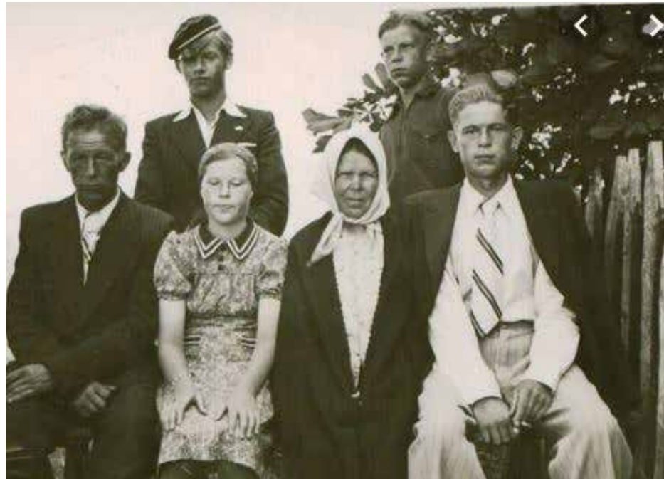
A. Nyka -Niliūnas su šeima dar Lietuvoje