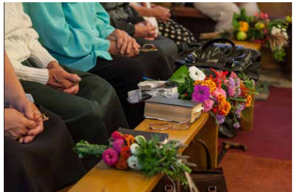
Žolinė Gudijoje, lietuviškose salose – Gervėčiuose ir Girių kaime

TĒVIŠKĒS ŽIBURIAI THE LIGHTS OF HOMELAND