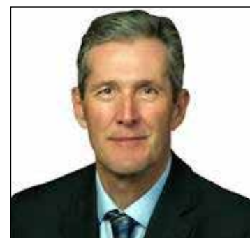
Manitobos premjeras Brian Pallister

Manitobos premjeras Brian Pallister rugpjūčio 12 d. paskelbė provincinių rinkimų vaju. Rinkimai vyks rugsėjo mėnesį, metais anksčiau negu buvo numatyta. Konservatorių vadovas jaučia, jog opozicija dabar yra silpna ir tikisi laimėti antrą terminą, pažadėdamas sumažinti mokesčius ir išlaidas. Trejus metus ėjęs šias pareigas, jis kartu su keliais kitais konservatoriais premjerai priešins ministerio pirmininko Justin Trudeau politikai, ypač klimato kaitos ir išmetamosios anglies klausimais. Savo įspūdinga pergale 2016 rinkimuose jis užbaigė Naujųjų demokratų partijos 17 metų valdymą