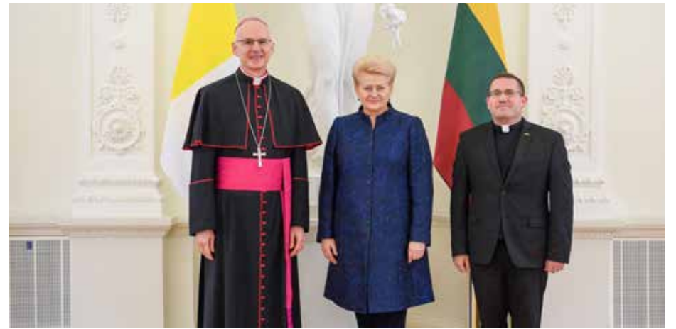
Tuometinė Lietuvos prezidentė D.Grybauskaitė priima popiežiaus pasiuntinį Lietuvai (k.)