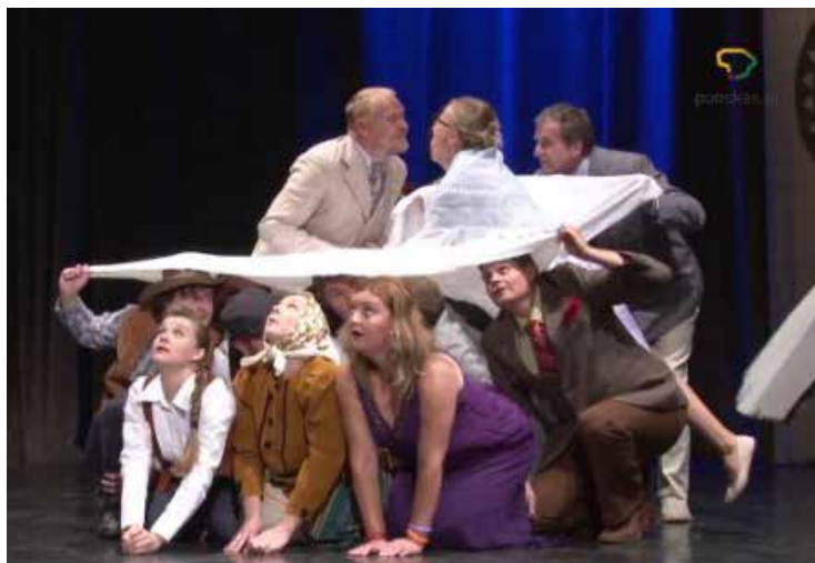
Scena iš Punsko klojimo teatro spektaklio 60-mečio minėjime