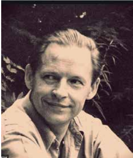
Adolfas Nyka-Niliūnas (Čipkus) (1919 -2015)

Pagaliau įtikėjau kažkieno tiesa, kad du svarbiausi dienos įvykiai <...> – yra, buvo ir bus saulės užtekėjimas ir nusileidimas, o visa kita – tik absoliučiai nereikšmingos smulkmenos.