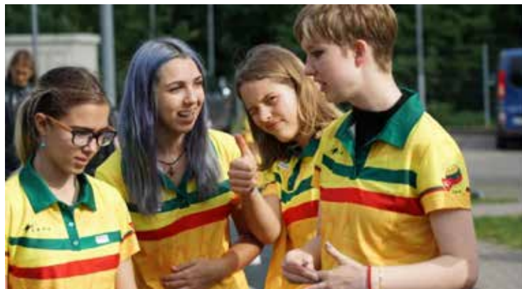
Naujos pažintys stovykloje tikriausiai taps draugyste

kaitė atidarymo iškilmeje pabrėžė: „Tai pirmoji tokia mūsų organizuojama stovykla ir nors didžioji dalis vaikų kalba lietuviškai, tačiau pati stovykla orientuota ne tik į kalbos puoselėjimą, bet ir į meninę raišką, lietuviybės bei