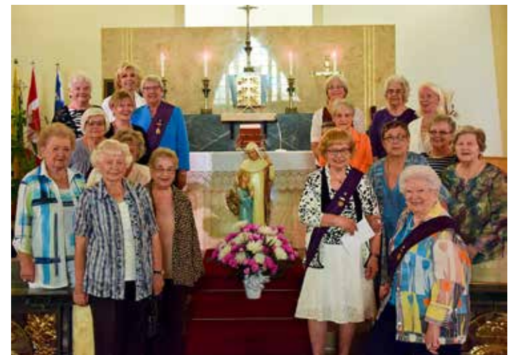
Dalis Šv. Onos draugijos narių šventovėje prie globėjos statulos