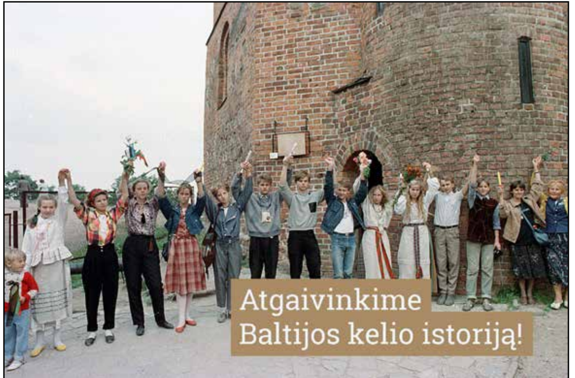
Baltijos kelio pati pradžia čia, Vilniuje, Gedimino pilies papėdėje