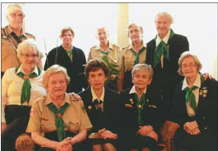
Hamiltono skaučių „Šatrijos ragana“ būrelis