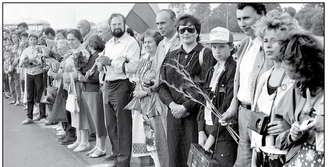
Lietuva Baltijos kelyje 1989-ųjų rugpjūčio 23 d.