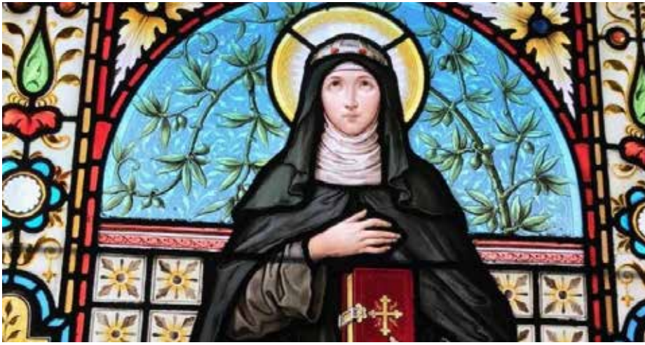
Šv. Barboros atvaizdas vitraže