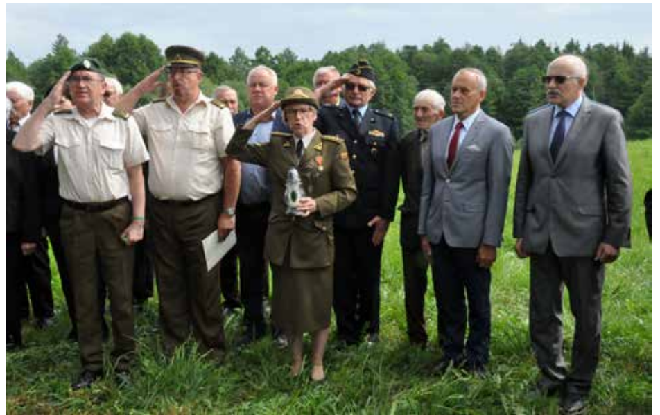
Koplytėlės Trumpališkių kaime atidengimas, giedamas himnas