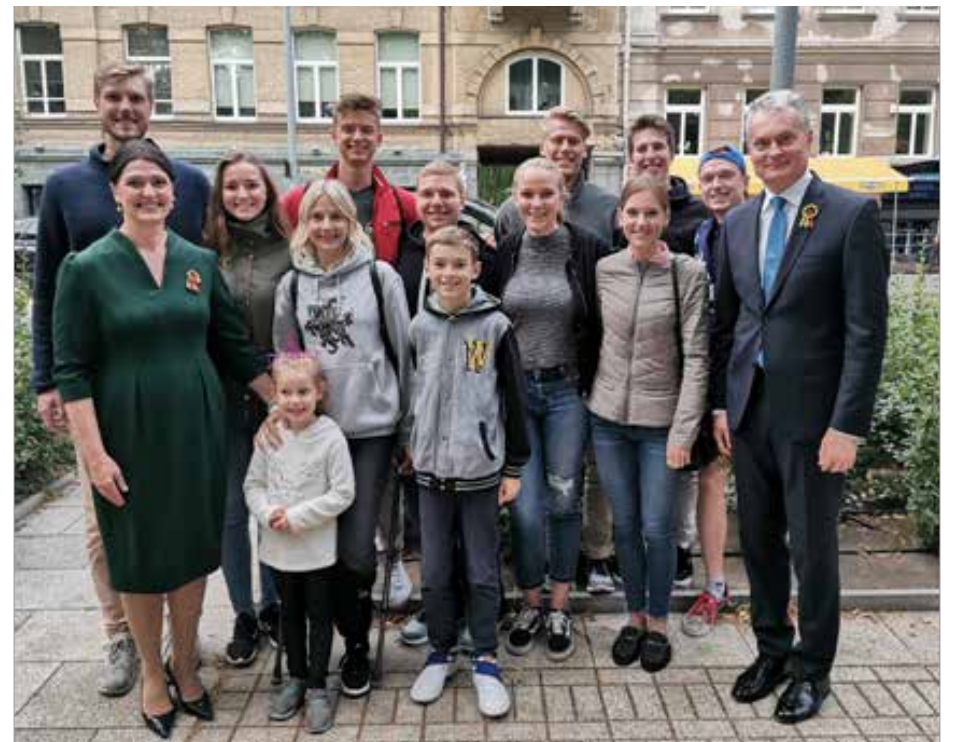
LISS programos dalyviai su prezidentu G. Nausėda ir jo žmona