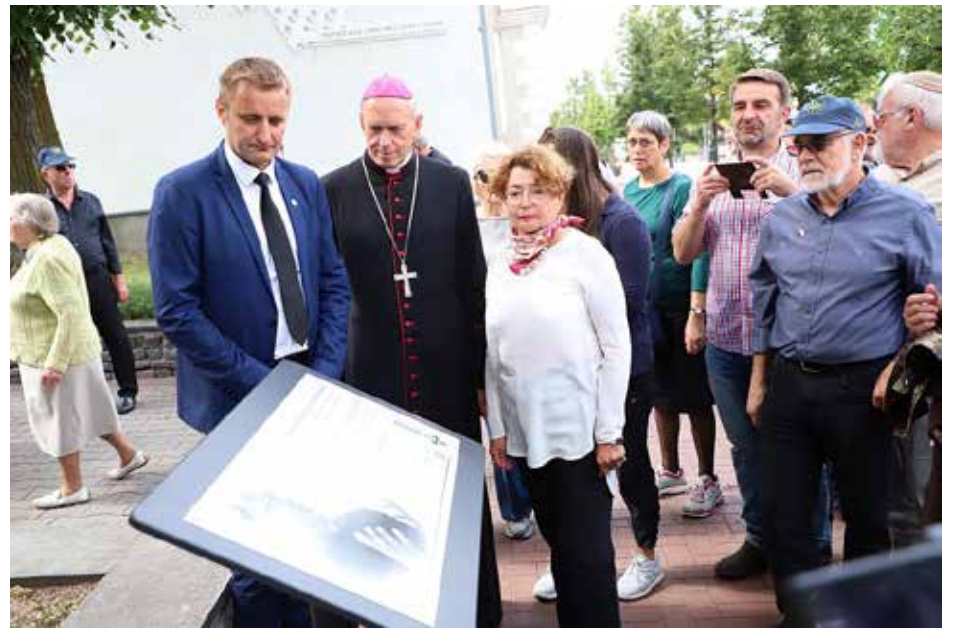
Atminimo lenta kun. J. Borevičiui Šiauliuose

„T.J. Paukštys kartu su t. J. Borevičiumi ir kitais žydų gelbėjimo komiteto