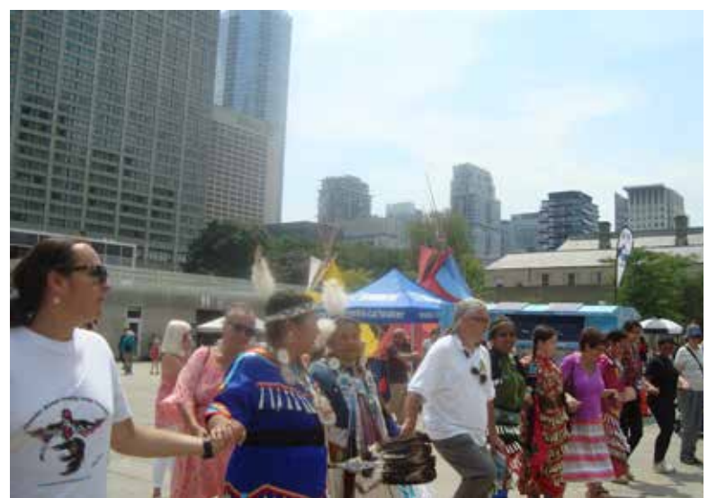
Kanados Pirmųjų tautų šventė Toronte – draugystės ratas

TĖVIŠKĖS ŽIBURIAI THE LIGHTS OF HOMELAND