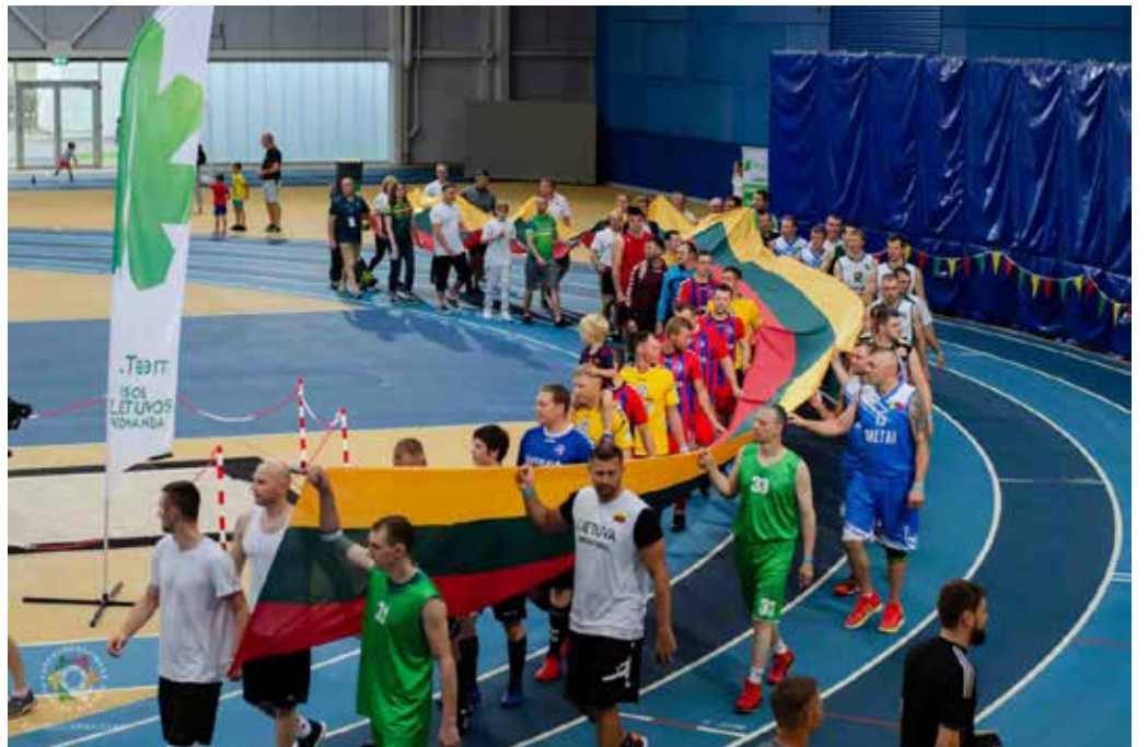
Sporto šventę pradeda eitynės su Lietuvos vėliava