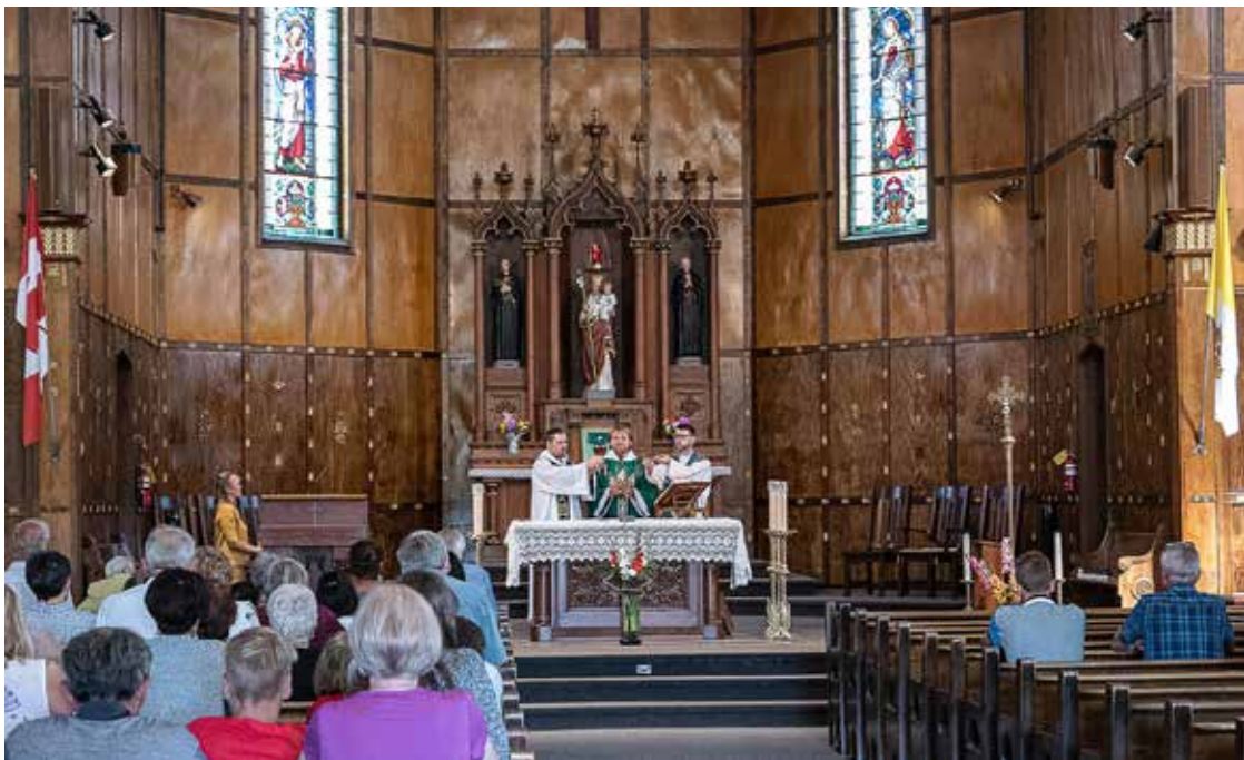
Midlando Kanados kankinių šventovėje pamaldos už Lietuvą