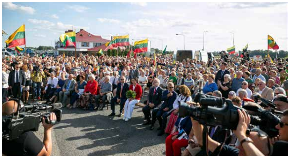
Latvijos ir Lietuvos prezidentų susitikimas Saločiuose

Daugiau nei 10,000 žmonių Vilniuje penktadienį susiki-