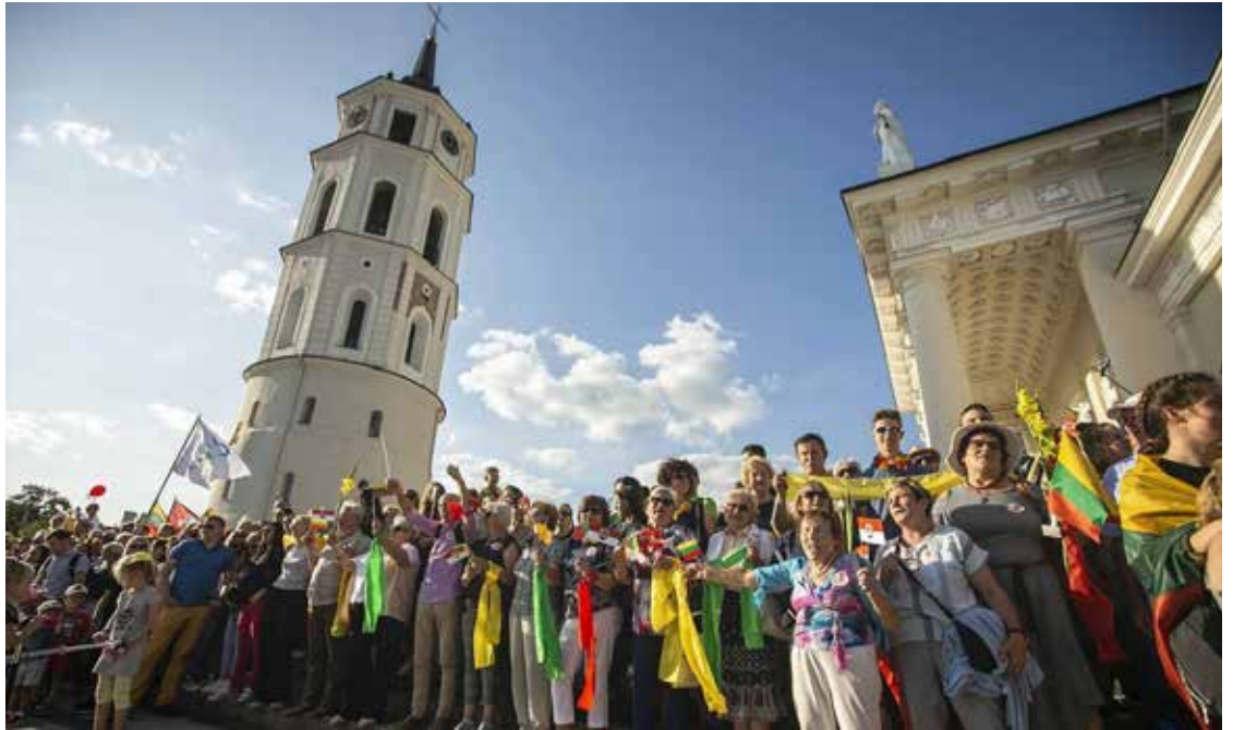
Baltijos kelio minėjimo akimirkos Vilniuje, Katedros aikštėje

Didžiausi ir svarbiausi 2019 metų rugpjūčio 23-osios, penktadienio, renginiai vyko sostinėje ir Lietuvos-Latvijos pasienyje.