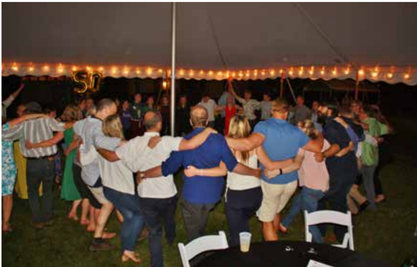
Šventės dalyviai nuotaikingai šoka po iškilmingos vakarienės