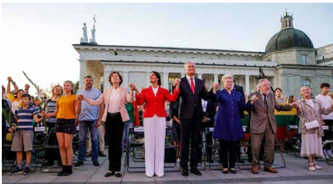
Katedros aikštėje bendroje grandinėje prezidentas G.Nausėda su žmona Diana, prezidentė D.Grybauskaitė, V.Landsbergis