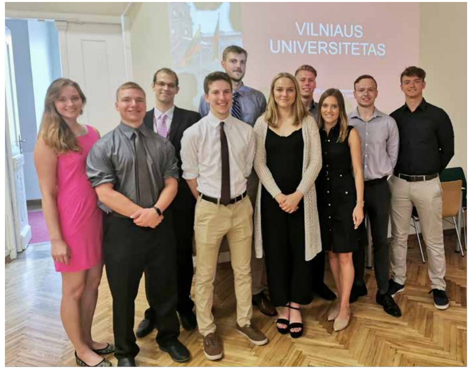
LISS programos dalyviai Vilniaus universiteto atidarymo renginyje

„Nors Lietuvos pažanga labai motyvuoja, aš suprantu, kad be LISS programos nebūčiau galėjęs visa tai pamatyti ir suprasti. Būvimas LISS programoje yra didelė laimė, kuri suteikia studentams galimybę dalyvauti daugelyje skirtingų renginių ir susitikimų, kas be programos nebūtų įmanoma. Įvairūs mokslo institutai, susitikimai su politikais ir rekreacinės veiklos, kuriose dalyvavo studentai, buvo neįkainojama patirtis, kurios nekeisčiau į nieką. Ypatingai aktyvi buvo ir LISS vadovybė, kuri užtikrina, kad kiekvienas programos dalyvis gautų vertingą ir individualiai specifinę darbo patirtį. Tokios įtraukiančios darbo stažuotės ir gerai suplanuotos kultūrinės programos derinys yra būtent tai, kas daro LISS išskirtiniu projektu“, – apibendrina