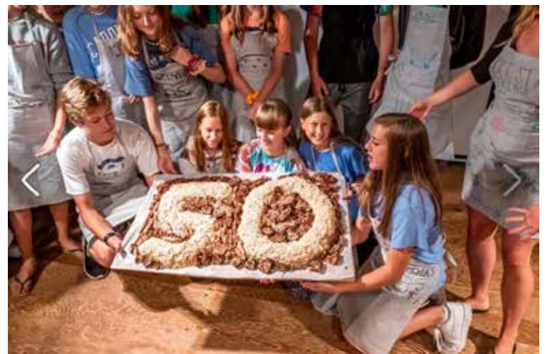
Šventė „Neringos“ vaikų stovykloje

Pirmadieniais, antradieniais, ketvirtadieniais - 9 v.r. - 5 v.p.p. Trečiadieniais - 9 v.r. - 1 v.p.p., Penktadieniais - 9 v.r. - 7 v.v. Šeštadieniais - 9 v.r. - 12 v.p.p.