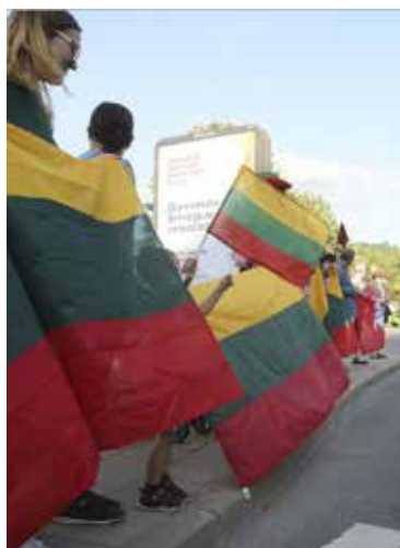
Simbolinio Baltijos kelio žmonių grandinės Vilniuje