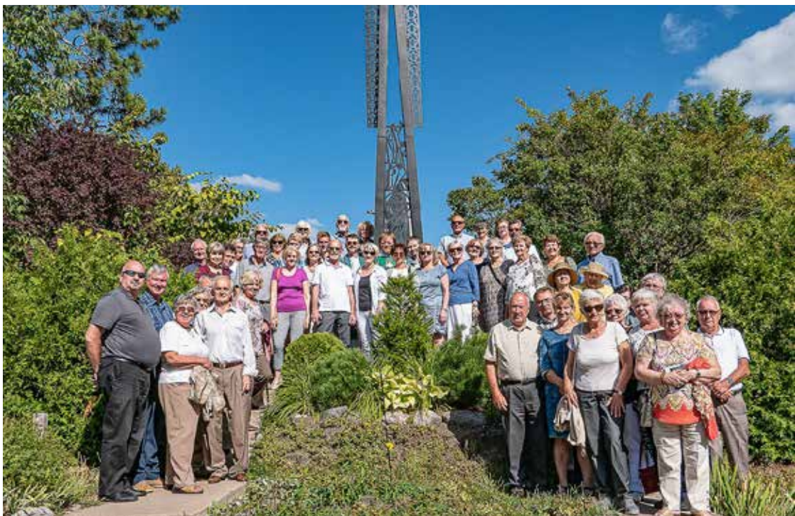
Maldininkai prie lietuviško kryžiaus Midlando Kanados kankinių šventovės šventoriuje