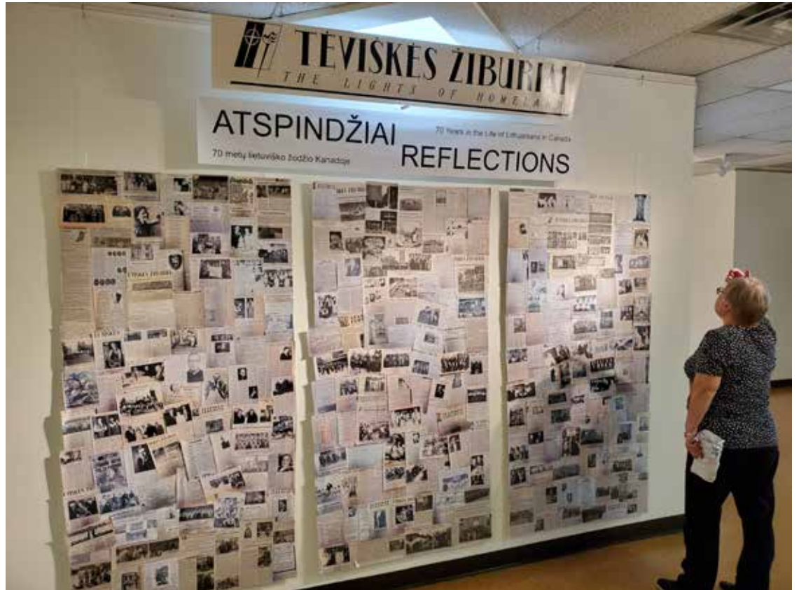
Tėviškės žiburių 70-mečiui skirtoje parodoje – straipsnių ir nuotraukų išskarpų rinkinys – tik maža laikraštyje spausdintų kūrinių dalis