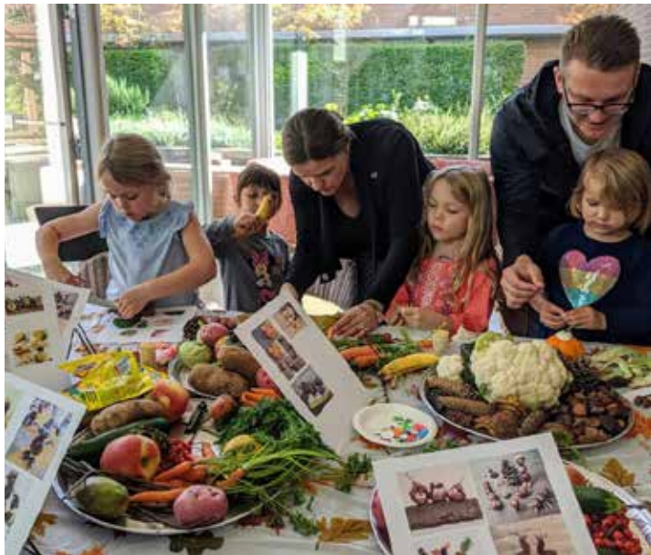
Štai mūsų kūriniai!