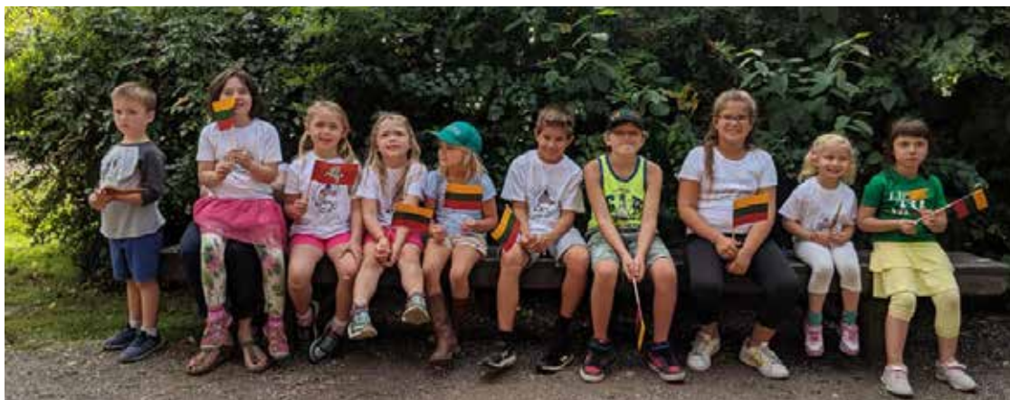
Derliaus šventėje buvo smagu