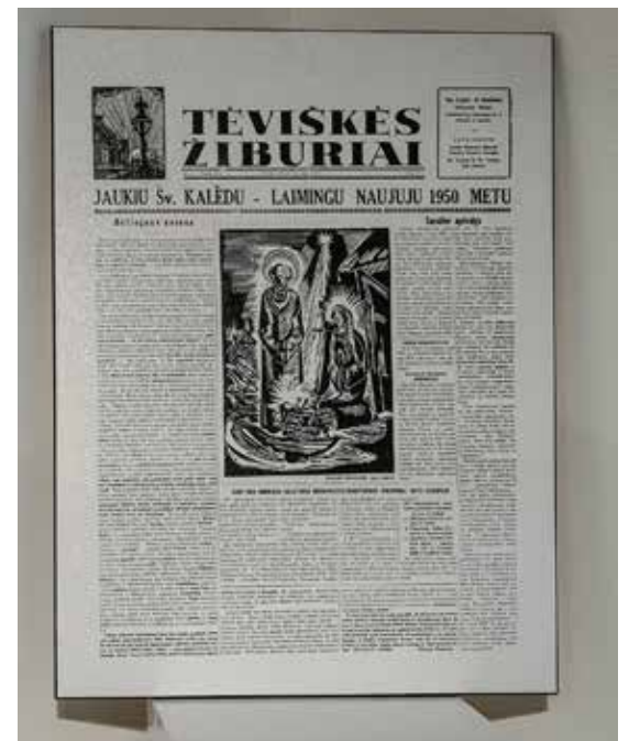
Pirmojo Tėviškės žiburių numerio I psl. – 1949.XII.24

Pirmasis Kanados lietuvių savaitraščio Tėviškės žiburiai numeris pasveikino savo skaitytojus 1949 metų gruodžio 24 dieną. Šį rudenį vienintelis Kanadoje lietuvių laikraštis mini savo leidybos 70-metį. Ta proga lapkričio 2 dieną Kanados lietuvių muziejaus-archyvo salėje rinkosi patys ištikimiausi skaitytojai ir rėmėjai, buvę darbuotojai ir savanoriai talkininkai. Sukakties proga Tėviškės žiburių steigėjai ir leidėjai – Kanados lietuvių katalikų kultūros draugija „Žiburiai“ ir Kanados lietuvių muziejus-archyvas suvienijo kūrybines jėgas ir pakvietė visus ne tik į laikraščio sukakties minėjimą, bet ir šiai datai skirtos muziejaus-archyvo parengtos parodos „Atspindžiai“ atidarymą.