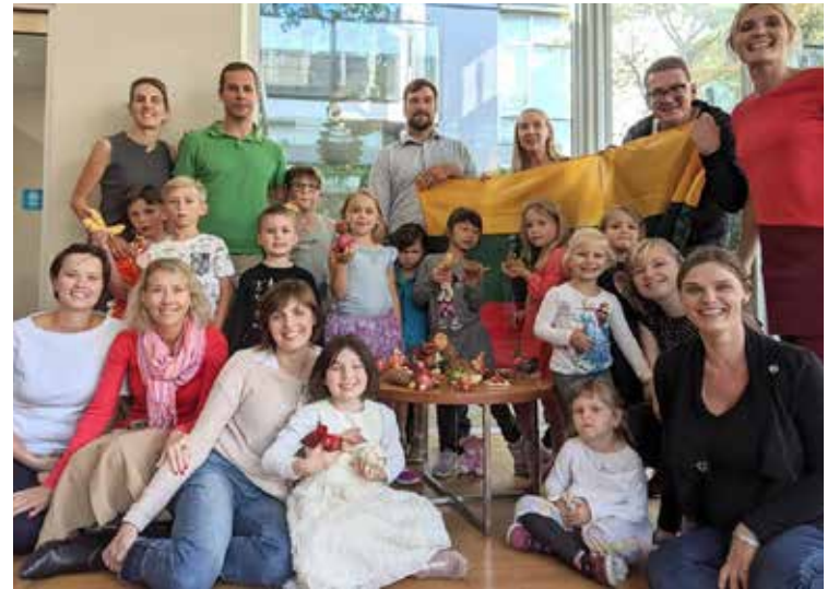
Mes visi kartu