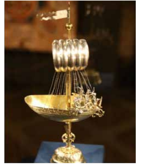
Parodoje – Radvilų giminės paveldas

bibliotekų, archyvų), bažnyčių, vienuolynų ir privačių kolekcijų, esančių 7 Europos valstybėse – Lietuvoje, Lenkijoje, Gudijoje, Ukrainoje, Vokietijoje, Prancūzijoje, Šventojoje Žemėje (Izraelyje ir Palestinoje). Dalis vertybių kitur niekada nerodytos arba mažai žinomos vertybės ne tik Lietuvoje, bet