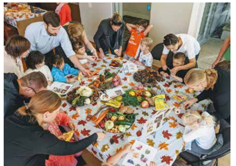
Prie didelio stalo darbmetis