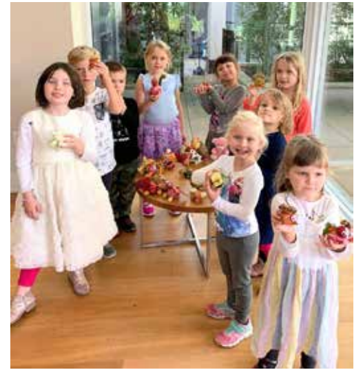
Štai mūsų kūriniai!