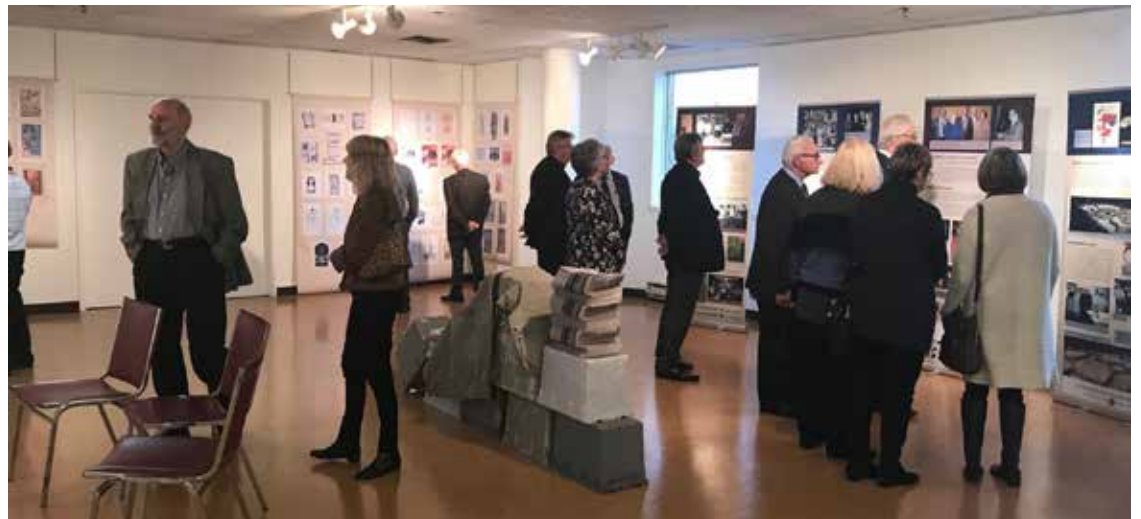
Bendras parodos vaizdas