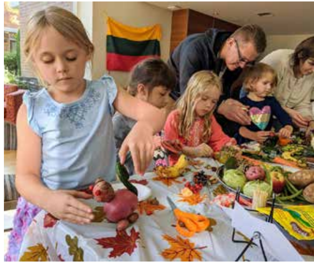
Mažieji mokomi pažinti žemės ir miško gėrybes