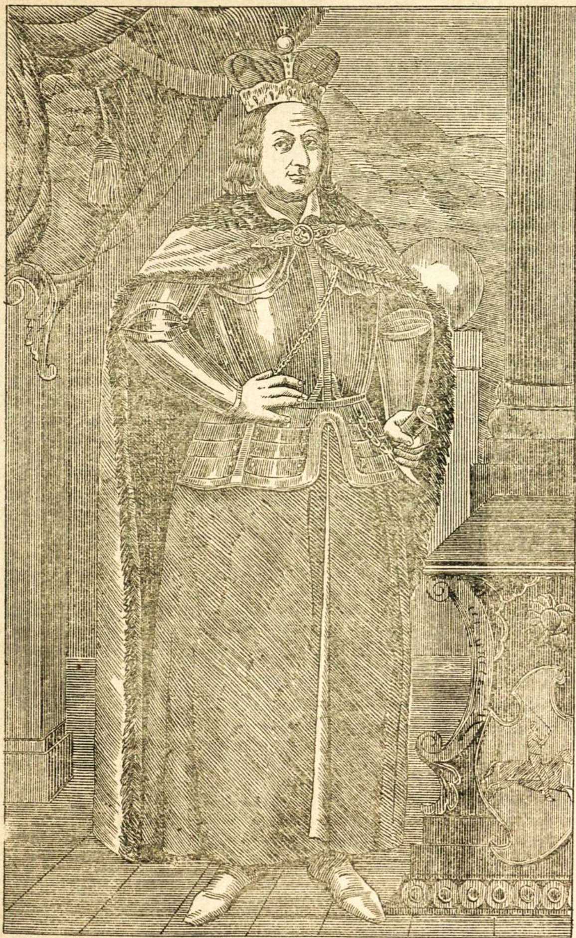
Seniansias paveikslas Didžio Lietuvos kunigaikszio Vytauto, nuimtas pilname ugije (Apraszymo netalpiname. Vytauto Istorija yra lietuviszkoj kalboj ne vienur apraszta).