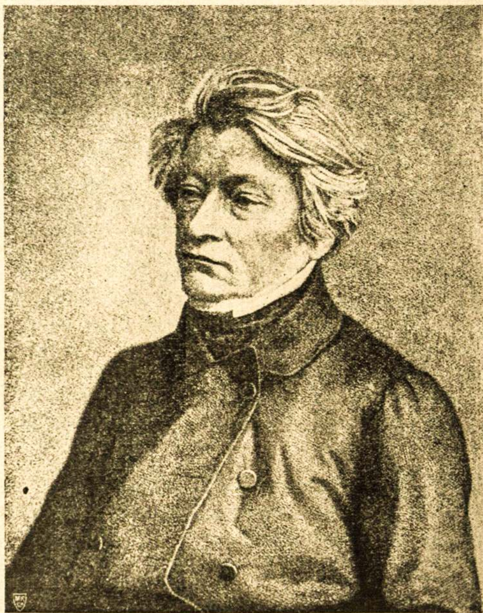
ADOMAS MICKEVICZIUS. lietuvis poetas, rašęs lenkiskai ir francuziskai; gimė 24 Gruodžio 1798, mirė 1855 m.