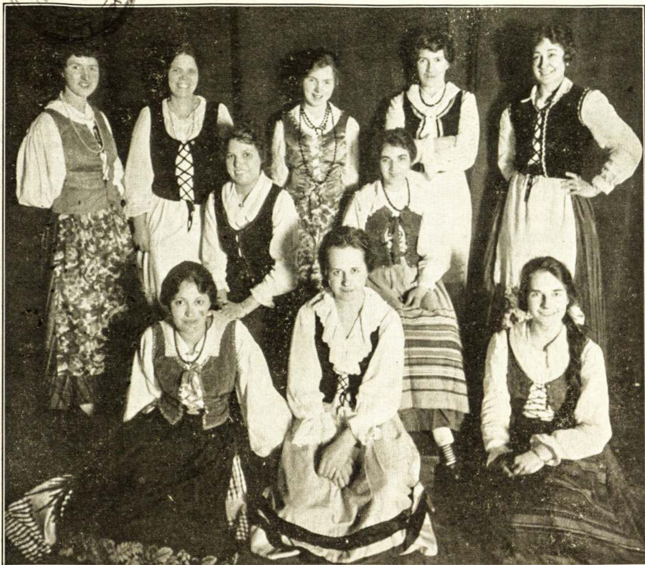
LIETUVAITĖS — ŠOKĖJOS INTERNACIONALIAM VAKARE.