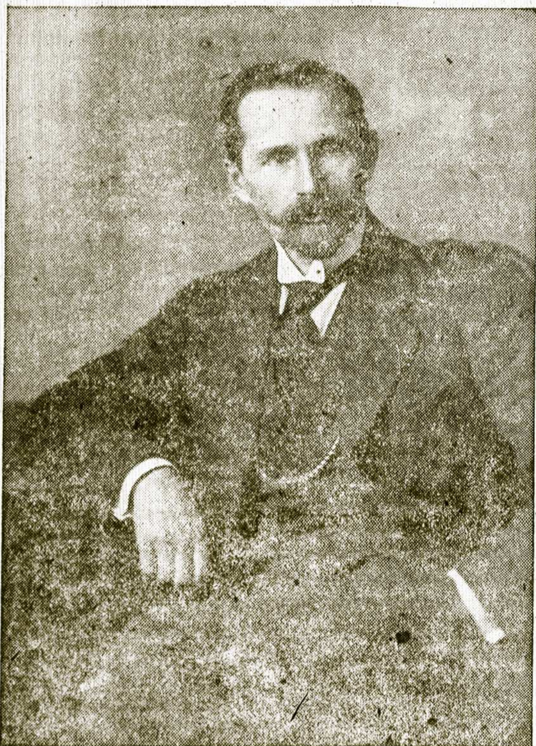
Dosniai Nepriklausomos Lietuvos rankiai