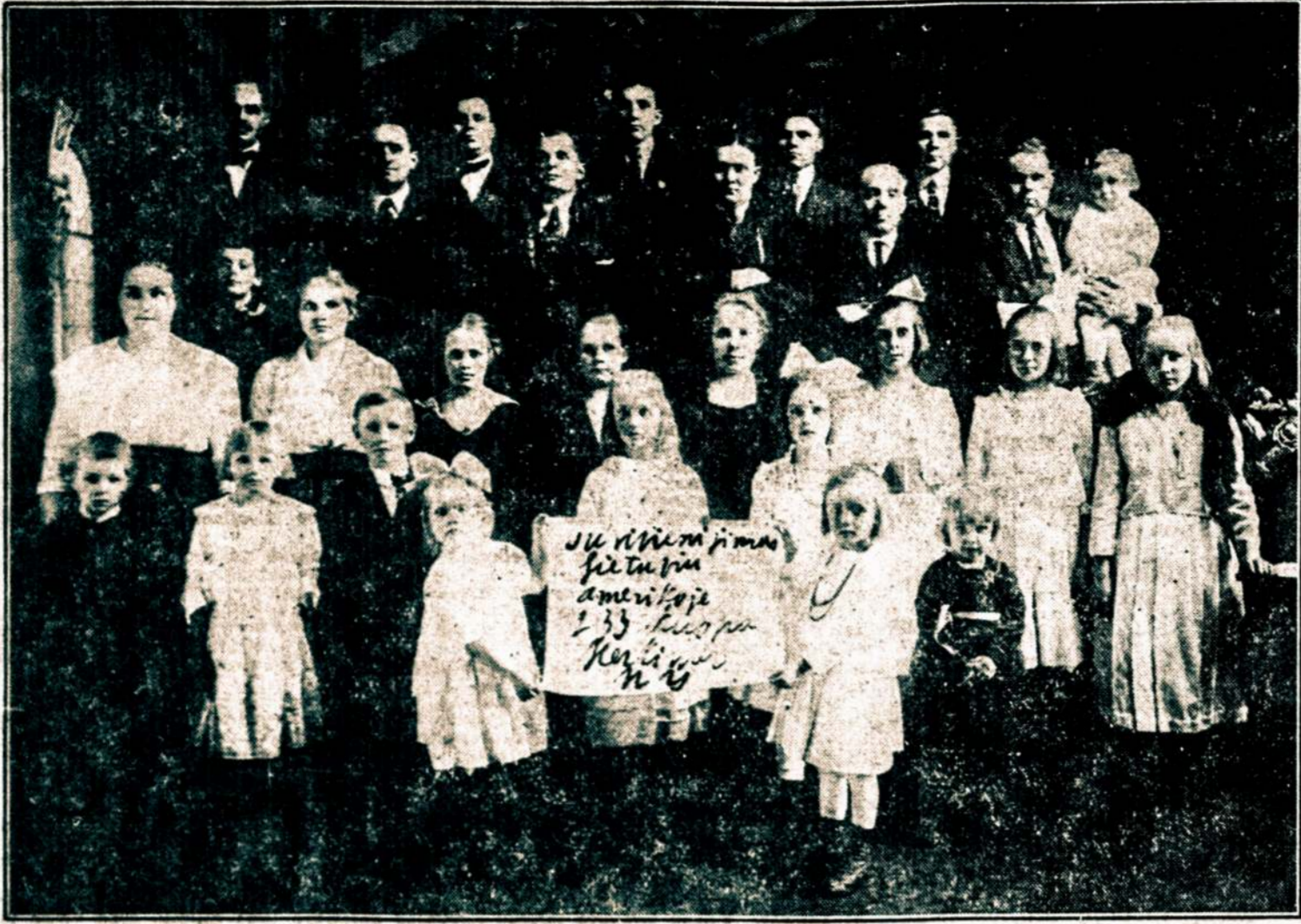
SLA. 233 KUOPA, HERKIMER, N. Y.