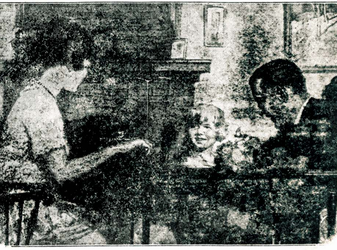
„Ji pagelbėjo mums sunkiuose laikuose paversti liuosas valandas į ekstra dolerius“