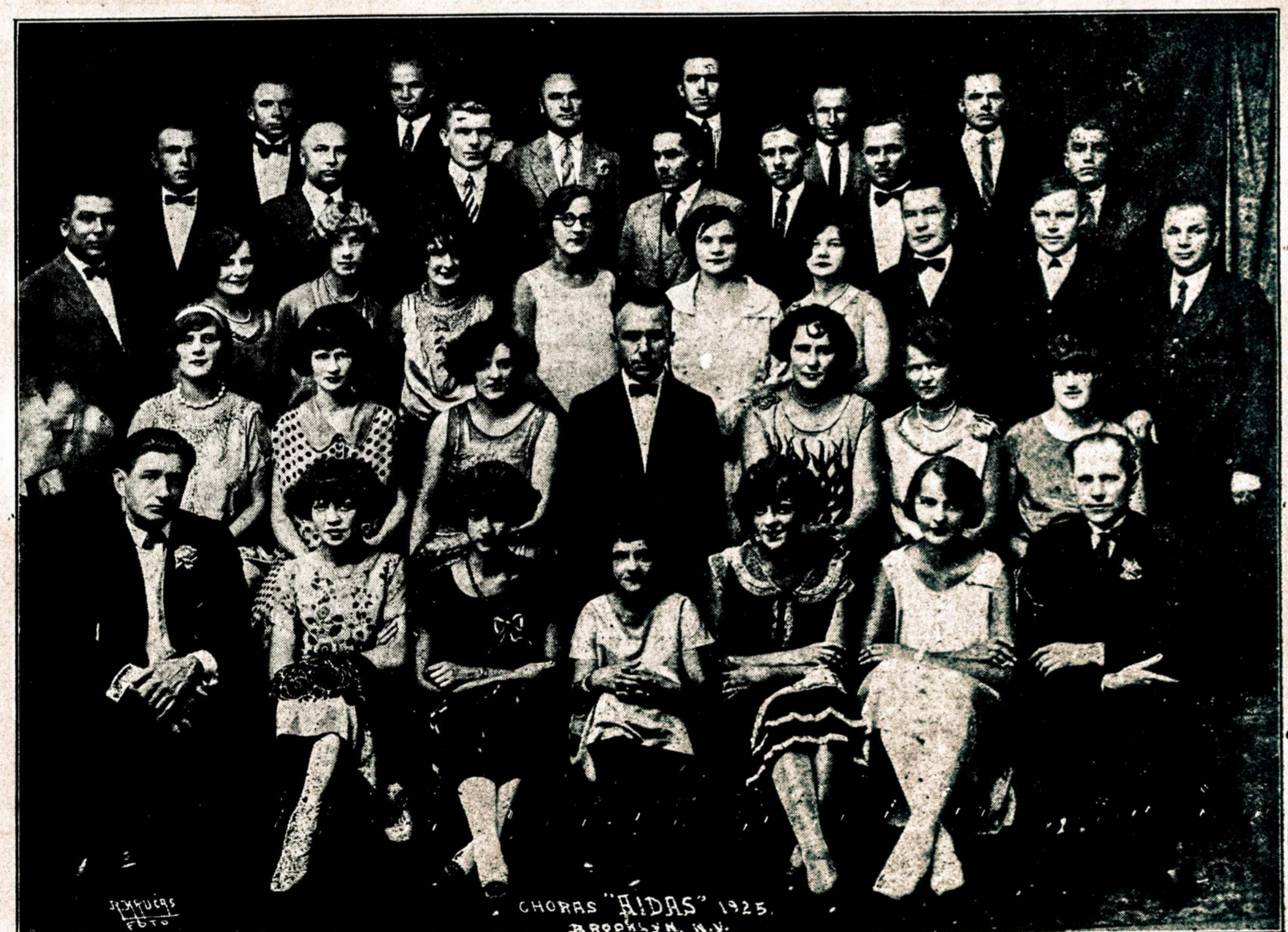
„AIDO“ CHORAS, KURIS DALYVAUS SLA. 5-to APSKRĖCIO PIKNIKE.