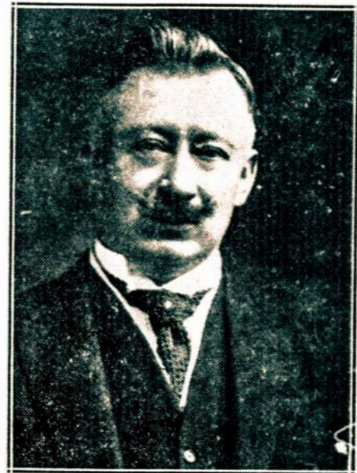
MIKAS PETRAUSKAS, Žymiausias Lietuvių Kompozitorius ir Meno Srity Veikėjas, SLA. Narys.