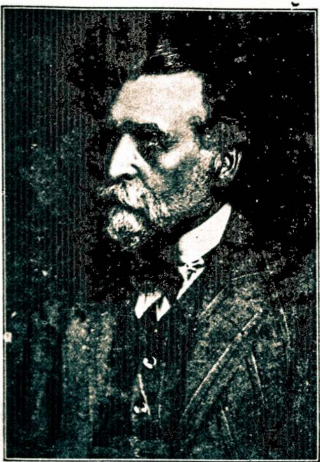
DR. JONAS BASANAVIČIUS, Lietuvių Tautinio Atgimimo Tėvas ir SLA. Garbės Narys (miręs)

mas iki šiol rėmėsi, tai nėra ir negali būti mažiausias abejonės apie laimėjimą. Tik prisiminkime musų pirmąjį, kad ir SLA. 16-tojo Seimo delegatų pasiūlymą ir pasiryžimą išlaikyti Susivienijimą pažangia lietuvių organizacija, o pamatysime, kad nieko nėra negalimo gyvenime pasiekti. Kas gi ištikrųjų tuomet galėjo tikėti, kad mūsų Susivienijimas išsilaikys, kad jis pasieks tos augstumas, kokia mes šiandien džiaugiamės?! Tokių mažai buvo. O vienok to pasiekti, nežūrint visų tų audrų, kokios Susivienijimui teko pergyventi. Ir šito pasiekta vien dėlto, kad buvo tikras pasiryžimas dirbti, kad buvo ištvermė, kad buvo sutartinas veikimas musų veikėjų tarpe. Todel vaduokimės ir mes tais pačiais obalsiais ir pagrindais, o aš užtikrinu, jog lengvai pasieksime to viso, ką Susivienijimas yra užsibrėžęs savo programoje ir darbuose pasiekti.