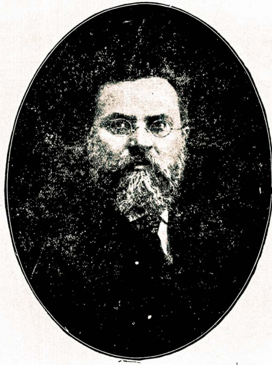
DR. JONAS ŠLIUPAS, SLA. Garbės Narys, Buvęs Doktoras Kvotėjas ir Apšvietos Komisijos Narys.

skirtumas, sulyginus musų Susivienijimo medžiaginę padėtį su ta padėtimi, kuri buvo tik 17 metų atgal. Tuo tarpu narių skaitlius tik apie dvigubai paugo.