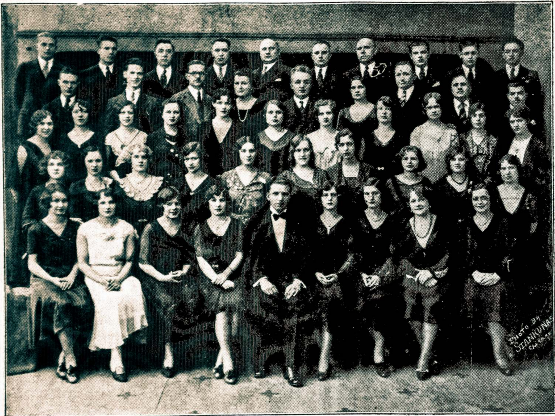
CHICAGOS „BIRUTĖS“ DRAUGIJA

su šių metų rudenio veikimo pradžia švęs 25 metų darbuotės jubilėjų. Dabar „Birutės“ Draugija rengia šaunų pikniką sekmadieny, birželio 21 d., Justice Park, Ill.